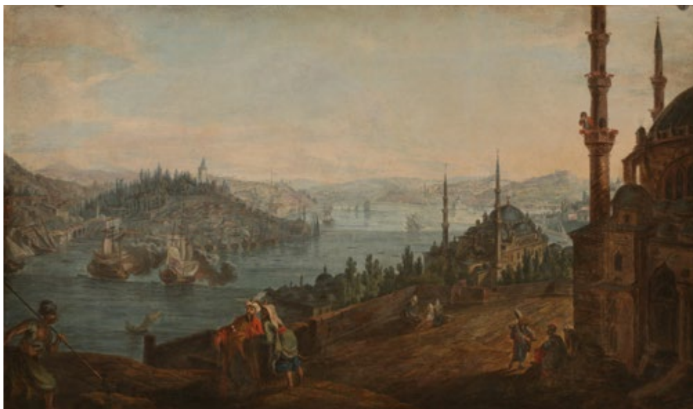
Ил. 4. Василий Петров, копия с акварели Гавриила Сергеева. Вид на залив Золотой Рог от мечети Рюстем-паши. 1790-е гг. бумага, акварель, гуашь. Угличский музей.

пейзажистов вплоть до второй половины XIX века». Среди этих пейзажистов он в числе первых упоминает Сергеева и тут же приводит как характерный пример следования щедринской традиции гравюры к изданию Джунковского (не называя имени Сергеева: видимо, его авторство большинства «александровских» видов Федорову-Давыдову не было известно) [Фёдоров-Давыдов 1953, с. 111, 112]. Иначе говоря, имя Сергеева отнесено здесь к кругу последователей художника, а его работы к преемству от уроков пейзажного класса. Вероятно, Сергеев все-таки посещал Академию, но как вольный ученик, потому это обстоятельство и не оставило следов в документах и в большинстве публикаций о нем. Уроки Щедрина он мог получить опосредовано, но в близком кругу художника.