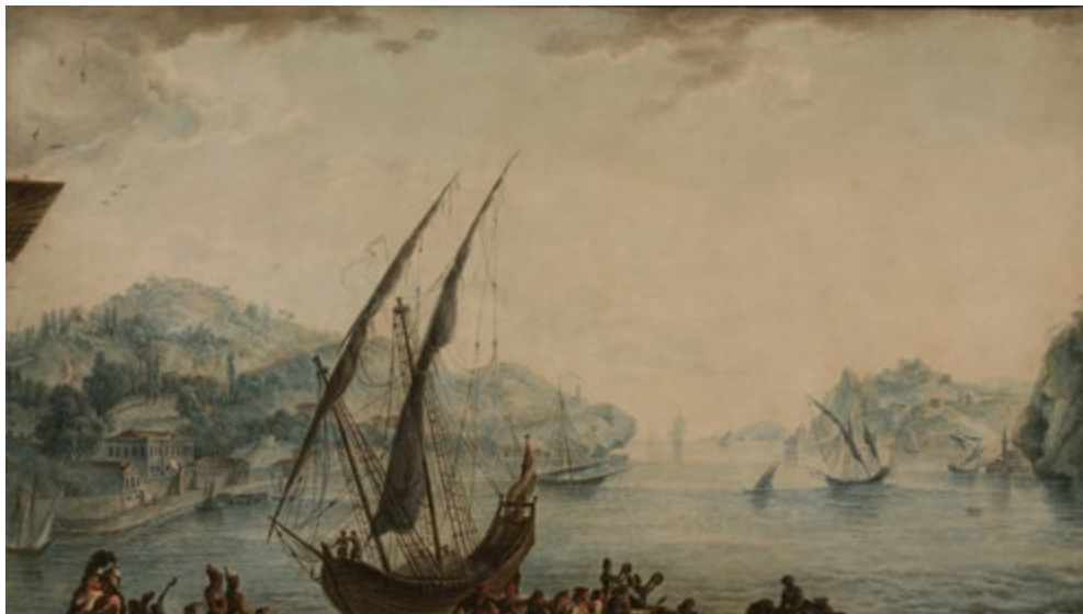
Ил. 5. Гавриил Сергеев. Вид Босфора в сторону Чёрного моря. 1794 г. бумага, акварель, гуашь. Угличский музей.

Фоменко подчеркивает, что Сергеев, выбирая место работы и ракурс, в каждом случае «привязывается к определенным точкам» [Фоменко 2013, с. 58]. Чаще всего это парные ориентиры — башня Галата, самая высокая точка ландшафта, и башня Леандра или Кыз Кулеси на скале в самом проливе.