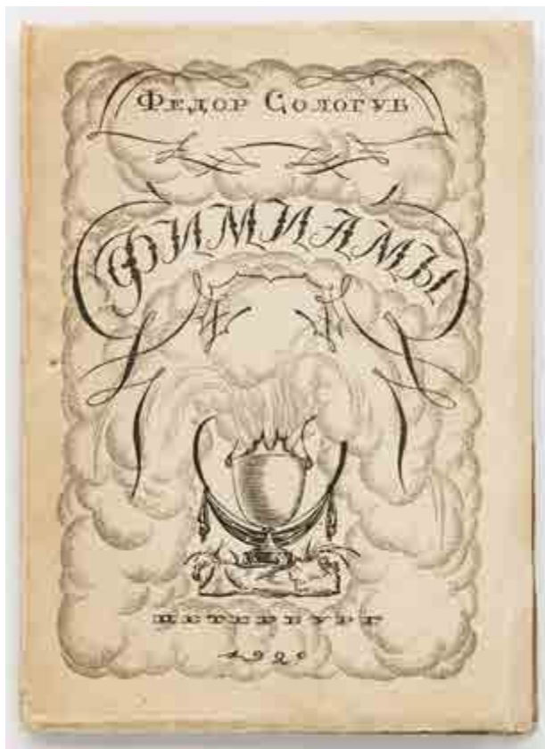
Ил. 2. В. М. Конашевич. Обложка книги Ф. К. Сологуба «Фимиамы». 1920. Б., акв., тушь.

Конашевича значительно чаще, чем торжественная театральность А.Я. Головина; редкий рисунок обходится без «колючего» штриха М.В. Добужинского. Иллюстрируя сказки Ш. Перро, художник, подобно многим «мирискусникам», иронизирует над простыми нравами и сложными церемониалами, пышными нарядами и наивным рационализмом галантного века.