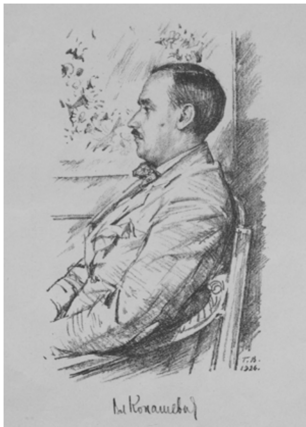
Ил. 1. Г.С. Верейский. Портрет В.М. Конашевича. 1926. Литография.

Творчество выдающегося отечественного графика, классика книжной иллюстрации Владимира Михайловича Конашевича (1888–1963) не обойдено вниманием исследователей, однако не все аспекты его разносторонней деятельности, не все этапы его биографии изучены одинаково глубоко и подробно (ил. 1). В частности, достаточно редко внимание искусствоведов привлекает самый ранний период работы художника в качестве иллюстратора и оформителя книг — начиная с создания дебютного цикла «Азбука в рисунках» (1917–1918) и заканчивая примерно 1923 г., когда полностью сформировалась оригинальная, легко узнаваемая индивидуальная графическая манера Конашевича. Безусловно, Владимир Михайлович испытывал тогда сильное влияние более опытных и искушенных мастеров, и прежде всего — корифеев «Мира искусства». Однако его стилистическая зависимость от творчества старших коллег подчас преувеличивается, трактуется слишком буквально и прямолинейно; данный вопрос нуждается в существенном уточнении. Попробуем разобраться в том, как складывались взаимоотношения молодого художника с прославленным объединением, как преломлялись в его исканиях тех лет «мирискуснические» графические традиции.