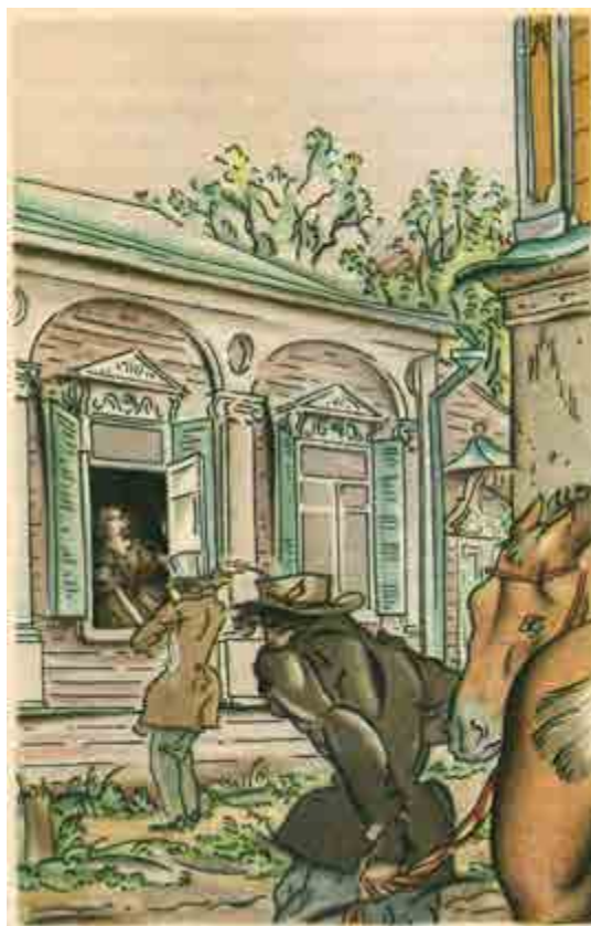
Ил. 7. В. М. Конашевич. Иллюстрации к повести И. С. Тургенева «Первая любовь». 1921. Б., акв., тушь.

Ритмика их расположения в пространстве книги созвучна темпу развития сюжета; ни один важный эпизод не остается без внимания художника. Иллюстратор явно симпатизирует главному герою, и в то же время не упускает случая подчеркнуть его наивность, неловкость, инфантильность. В сущности, это — восторженный, впечатлительный ребенок, случайно попавший в компанию взрослых, но еще не усвоивший «правил игры», принятых в этом кругу. Оставаясь наедине с возлюбленной, он робеет, теряется, а, предоставленный самому себе, может часами смотреть в окно и предаваться сладостным, несбыточным мечтам.