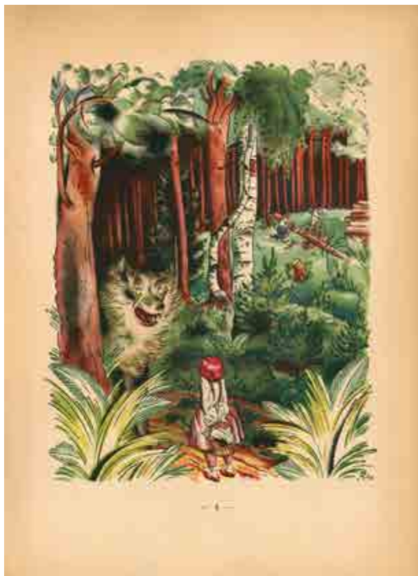
Ил. 3. В. М. Конашевич. Иллюстрации к сказке «Красная шапочка». 1922. Б., акв., тушь.

в немногочисленных собраниях группы, проходивших на квартире Нотгафта, в выставке «Мира искусства», состоявшейся в 1922 г. в Аничковом дворце. В кратком обзоре этой экспозиции художник В.П. Белкин упомянул и Конашевича, «от графики и иллюстраций которого в совершенном опьянении и восторге все книгоиздательства Петрограда, и поделом, так он все делает хорошо и сладостно» [Белкин 1922, с. 25].