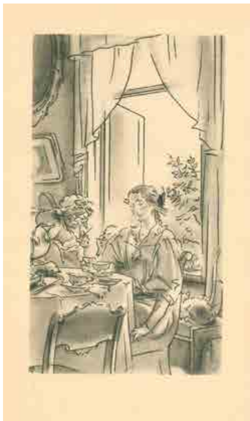
Ил. 8. В.М. Конашевич. Иллюстрации к «Стихотворениям» А.А. Фета. 1921. Б., черн. акв., тушь.

воспоминания в определенное русло. В этой системе координат интонация подчиняет себе содержание, изображенное на листе не столь важно, как недосказанное. «Линиям Конашевича присуща особая, почти пружинная упругость, они заряжены напряжением и едва ли не впервые поэтические образы нашли в этой небольшой книжке не только изобразительное, но и ритмическое соответствие» [Герчук 2008, с. 646] (ил. 8).