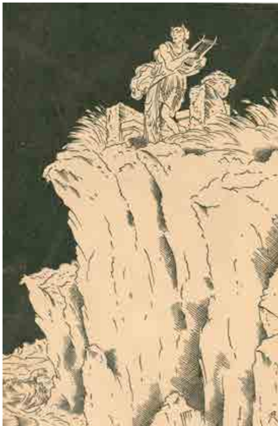
Ил. 4. В.М. Конашевич. Иллюстрации к книге Ф.Ф. Зелинского «Каменная нива. (Аттические сказки)». 1922. Б., тушь.

Вашего каталога, я получил большое редкое удовольствие <...>. Вы все же „чистейший европеец“ и хорошо , что это так...» [Бенуа 1968, с. 679]. Письмо заканчивается коротким списком детских книг с рисунками адресата, которыми Александр Николаевич «имеет удовольствие (и очень большое) обладать».