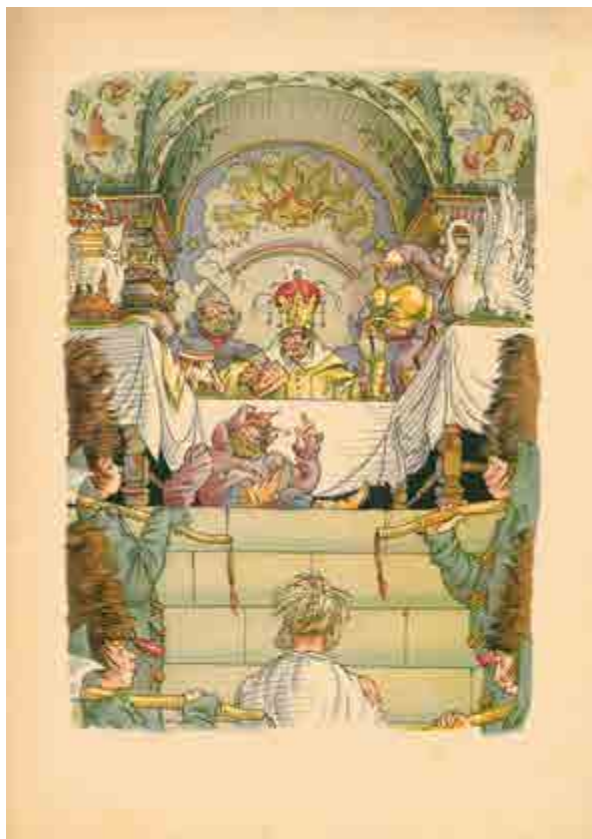
Ил. 6. В. М. Конашевич. Иллюстрация к «Сказке о рыбаке и рыбке» А. С. Пушкина. 1920. Б., акв., тушь.

шута, юных стражников (ил. 6). Финал сказки, где «проклятая баба» вновь оказывается у разбитого корыта, вовсе не кажется Конашевичу катастрофичным. Скорее наоборот, этот эпизод трактуется художником как долгожданное избавление от зловещего морока, восстановление привычного, естественного хода вещей.