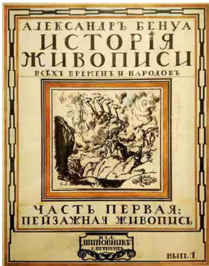
Ил. 9. Е. Е. Лансере. Вариант обложки выпусков «Истории живописи всех времен и народов» А. Н. Бенуа. 1911. Государственная Третьяковская галерея, Москва.

серыми тучами на небе и могучей фигурой царя в треуголке, всматривающегося в воды Финского залива и в левой руке держащего подзорную трубу. По верху орнаментальной рамки тушью нарисованы атрибуты петровской эпохи и даты «1703» и «1903». Лишь небольшую часть страницы внизу предполагалось заполнить соответствующим текстом Пушкина «На берегу пустынных волн...» 20 (ил. 6). Чтобы не разбивать цельность видения одного мастера в журнале была опубликована заставка Бенуа с почти фронтальным портретом Петра на берегу моря.