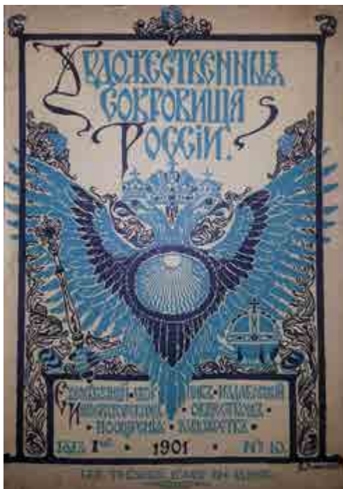
Ил. 3. Е. Е. Лансере. Обложка одного из выпусков сборника «Художественные сокровища России». 1901.

они ходили по музеям и выставкам, ставили постановки в домашнем театре. 17 марта 1895 года Евгений четко выразил в дневнике свою любовь к театрально-декораторской деятельности: «занятия театром меня утешают и ободряют. Шура, Атя, Нувель и я ставим теперь: „Орфей в аду“ по Полисьену. Нувель пишет музыку, Шура и я — декорации; я также строю театр и главный механик. [...] Декорации должны быть трактованы почти как картины, — вся разница, что здесь будет подходящий свет и 3 плана (2 кулисы и задний фон)» [Лансере 2008, кн. 1, с. 242].