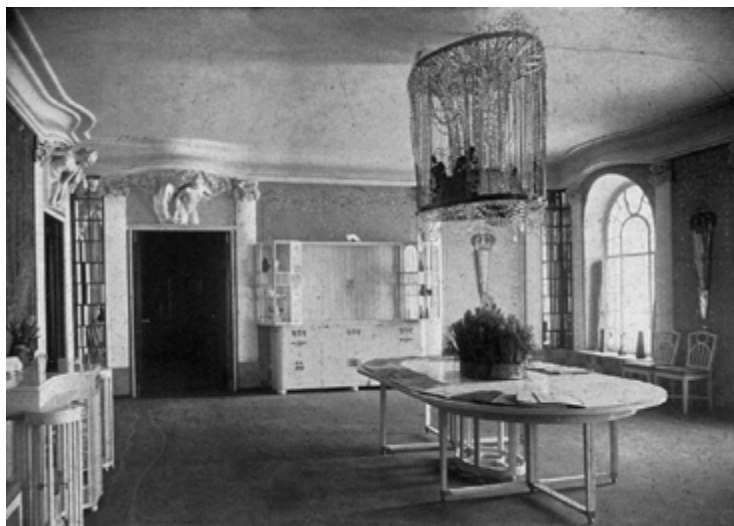
Ил. 8. Столовая. Создана по рисункам А. Н. Бенуа и Е. Е. Лансере в 1902–1903 годах. Интерьер выставки «Современное искусство» в Санкт-Петербурге.