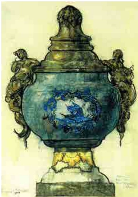
Ил. 10. А. Н. Бенуа. Эскиз вазы для Императорского фарфорового завода. 1914. Государственный Русский музей, Санкт-Петербург.

Летом того же плодотворного 1903 года А. Н. Бенуа получил предложение от товарищества Р. Голике и А. Вильборг на издание его исправленного очерка об истории русской живописи. Александр назвал его «Русская школа живописи» и попросил племянника его оформить. 1 сентября в недоумении Евгений писал дяде из усадьбы Нескучное: «Но что это за „новая история живописи“? Неужели все съизнова, или только новое издание, „роскошное и дополненное“? Такая невероятная роскошь даже безнравственна, если даже меня печатать в 2 тона!» 23 . В результате Евгений создал однотипные обложки для комплекта из десяти выпусков и рисунок на издательской папке, который совпадает с двуцветной заставкой на рекламе «нового роскошного иллюстрированного издания», помещенной в начале первого номера журнала «Мир искусства» за 1904 год (в заставке изображена квадрига Аполлона на фоне лучей солнца, а по верхней линии пущена растительная гирлянда с пятью живописными палитрами).