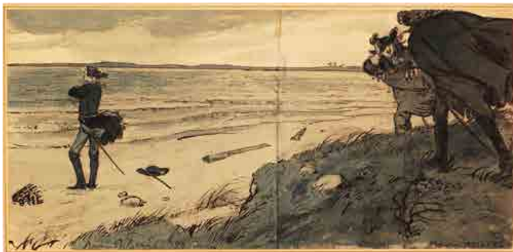
Илл. 7. А. Н. Бенуа и Е. Е. Лансере. На берегу пустынных волн. Иллюстрация к «Медному всаднику» А. С. Пушкина. 1905. Всероссийский музей А. С. Пушкина, Санкт-Петербург.

напечатано. 25 июня художник в письме напомнил Кончаловскому про оплату второго рисунка: «Я имел честь сделать два рисунка для Вашего издания сочинений А. С. Пушкина, — один к рассказу „Выстрел“, второй к повести „Дубровский“ (сцену с каретой князя, возвращающегося со свадьбы и останавливаемого Дубровским)» [Лансере 2008, кн. 1, с. 426]. Издатель написал любезное ответное письмо. Бенуа и Лансере работали над рисунками для этого издания в несколько разных манерах. Но в других проектах степень их взаимодействия нарастала.