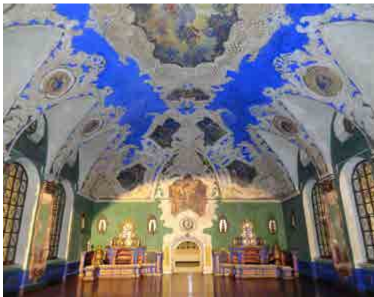
Ил. 11. Фрагмент макета зала ресторана Казанского вокзала в Москве. 1915. Архитектор А. В. Щусев. Музей архитектуры имени А. В. Щусева, Москва.

Товариществом Р.Р. Голике и А.И. Вильборг в 1910 году тиражом 600 экземпляров. Цена в зависимости от оформления заявлена от 100 до 150 рублей.