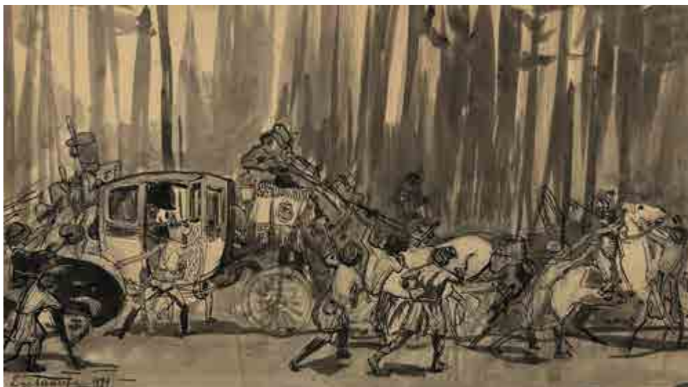
Ил. 2. Е. Е. Лансере. Нападение на свадебную карету. Иллюстрация к роману А. С. Пушкина «Дубровский». 1899. Всероссийский музей А. С. Пушкина, Санкт-Петербург.

казались фантастическим городом» [Лансере 2008, кн. 1, с. 82]. 1 апреля 1894 года Евгений изучал Новую Голландию: «Только что вернулся, смотрел ворота (Новая Голландия, склады, при луне сбоку) по совету Шуры. Мне стало страшно и жутко, глядя на них» [Лансере 2008, кн. 1, с. 193].