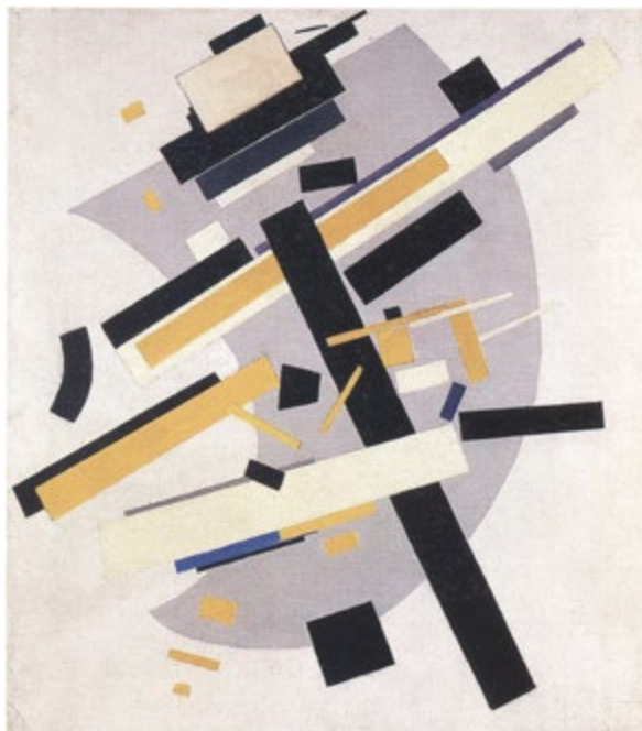
Эскиз занавеса. 1919. Иллюстрация к II части.