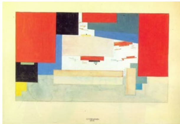
Супрематизм (Супремус № 58). 1916. Иллюстрация к I части.