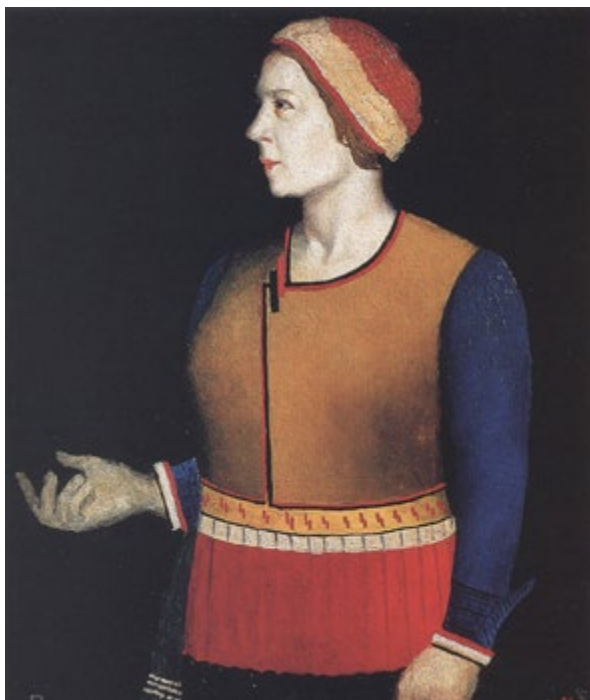
Портрет жены художника. 1933. Иллюстрация к V части.

Большой интерес представляет анализ поздних, более зрелых трудов Малевича — «Супрематизм. Мир как беспредметность или Вечный покой», «Бог не скинут. Искусство. Церковь. Фабрика», «Из книги о беспредметности». Важно, что анализ этих трудов не замкнут, а обращен и к предыдущим главам, имеет выход и в последующие. Определенные точки соприкосновения мысли Малевича и религиозной философии, не раз отмечавшиеся исследователями авангарда, в данной книге широко рассматриваются на примере анализа философских воззрений Бердяева.