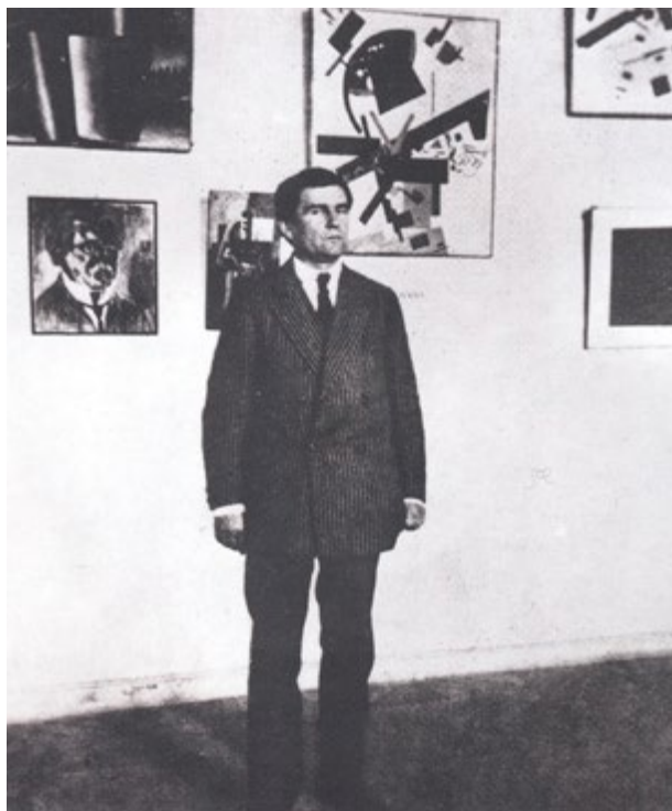
К. С. Малевич в Гинхуке. 1925. Иллюстрация к IV части книги.

Казимир Малевич давно стал одной из знаковых фигур в искусстве XX века. На сегодняшний день существует огромный пласт литературы как зарубежных, так и отечественных исследователей, посвященной осмыслению творческого пути мастера, оказавшего глубокое влияние на развитие художественного процесса XX века. Всем специалистам хорошо известно пятитомное собрание сочинений Малевича, подготовленное А.С. Шатских и А.Д. Сарабьяновым. Отдельные высказывания мастера часто цитируются в специальной литературе, и, тем не менее, существует миф о невозможности прочтения его текстов; многим теоретические работы Малевича кажутся чем-то маловразумительным. Кроме того, бытует мнение — мало ли что там наговорят художники, важно, что они реально сделали, то и следует оценивать. Однако в случае с авангардом теоретическое наследие мастеров ничуть не менее важно их практической деятельности, поскольку шла активная работа по осмыслению предшествовавшего этапа искусства и формированию нового языка изобразительного творчества.