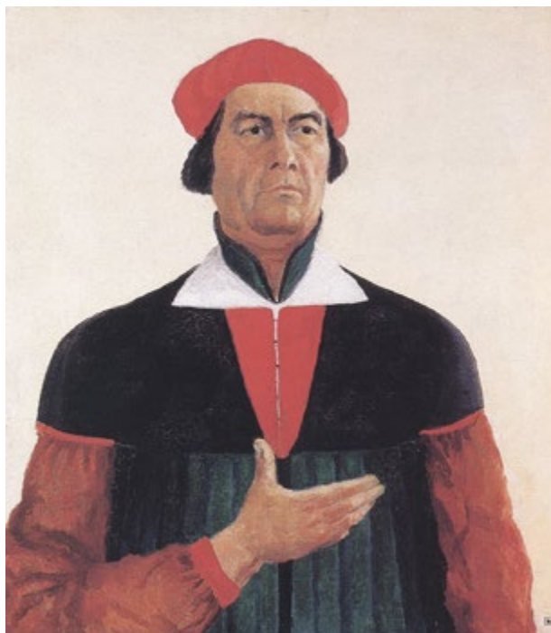
Автопортрет (Художник).1933. Иллюстрация к V части.