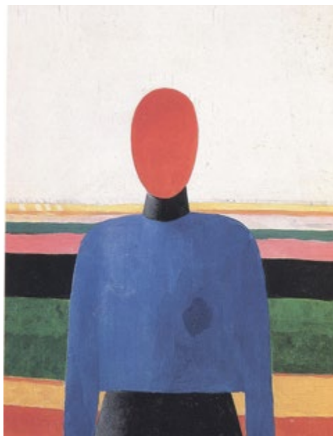
Женский торс. 1928-1929. Иллюстрация к V части.