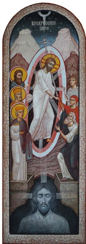
Ил. 4. Чашкин А.И. Воскресение Христово. 2020. ©