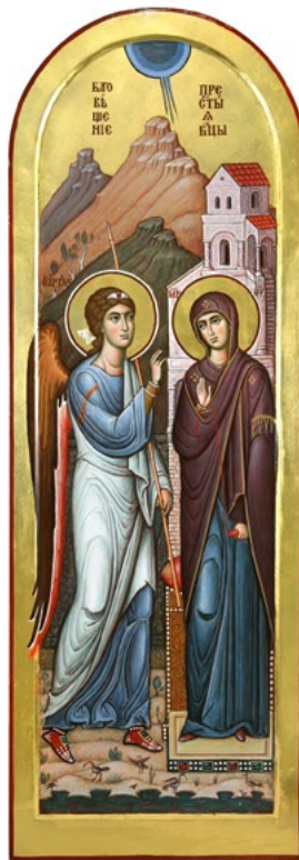
Ил. 10. Чашкин А.И. Благовещение. 2020. ©