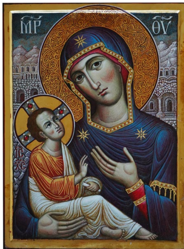
Ил. 5. Чашкин А.И. Богородица Синайская. 2012. ©