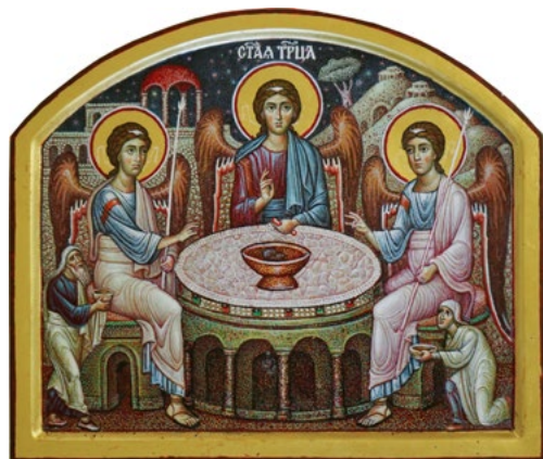
Ил. 1. Чашкин А.И. Пресвятая Троица. 2014. ©