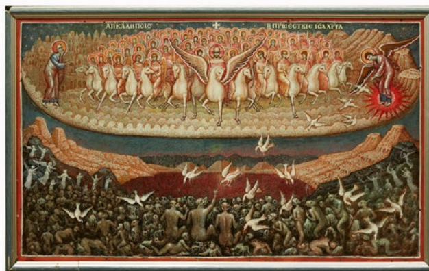
Ил. 2. Чашкин А.И. Апокалипсис. 2017. ©