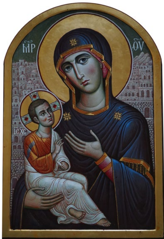
Ил. 9. Чашкин А.И. Божия Матерь Иерусалимская. 2012. ©