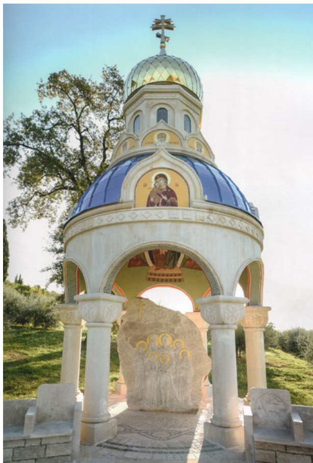
Ил. 12. Храм-часовня во имя царственных мучеников и памятник в их честь в монастыре Дайбабе. Общий вид. 2019.