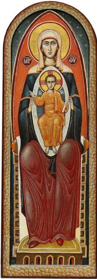
Ил. 7. Чашкин А.И. Матерь Божия с Младенцем на престоле. 2020. ©