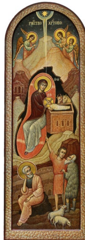
Ил. 11. Чашкин А.И. Рождество Христово. 2020. ©

Икона для Чашкина — это окно в горный мир, а каждый акт написания иконы есть особое событие в жизни Церкви, при котором духовное напряжение свидетельства материально закрепляется в изображении. Более или менее удачно, живой опыт Неба всегда является нам в живописном пространстве иконы непосредственно, а не отвлеченно-метафорически. Недаром многие иконы разделили судьбу мучеников, испытав на себе ярость тех, для кого встреча с Истиной невыносима.