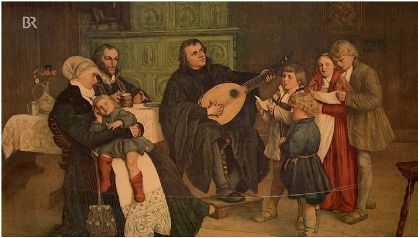
Ил. 8. Г. Шпангенберг. Лютер в кругу своей семьи. 1866. Холст, масло. 125×179. Лейпциг, Музей изобразительных искусств

Кувшин дает повод обозначить еще один аспект, связанный с образом Лютера — его деятельность как реформатора церковной музыки и музыкальной культуры Германии в целом. Эта тема широко разработана в литературе, мы также к ней уже обращались [Савицкая 2016]. Напомним лишь, что немецкая песня становится важным