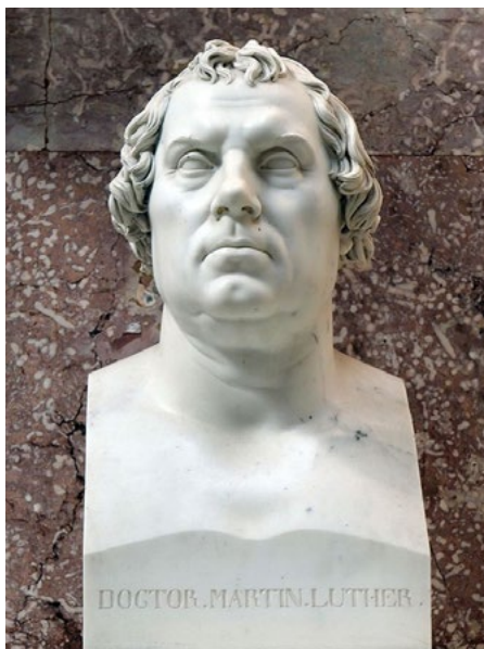
Ил. 5. Э. Ритшель. Мартин Лютер. 1831. Скульптура в парке Валхала, Регенсбург