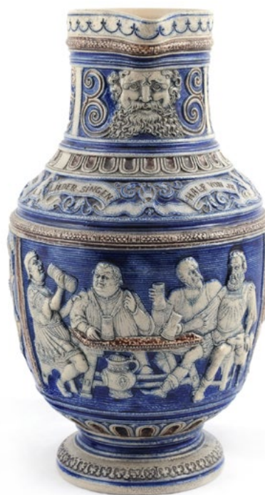
Ил. 2. Кувшин со сценой застолья и музицирования. Германия, Вестервальд, 1890–1900-е. В. 30. Фонд СГХМ, инв. № П-522

В Германии в силу особых исторических причин эпоха историзма заявила о себе предельно значимо. Раздробленная в начале XIX столетия страна к его концу не только объединяется, но становится одним из самых мощных государств мира. Весь век проходит под знаменем национальной идеи, в картине мира немцев особое место занимает миф о великом германском средневековье, что находит яркое выражение в искусстве.