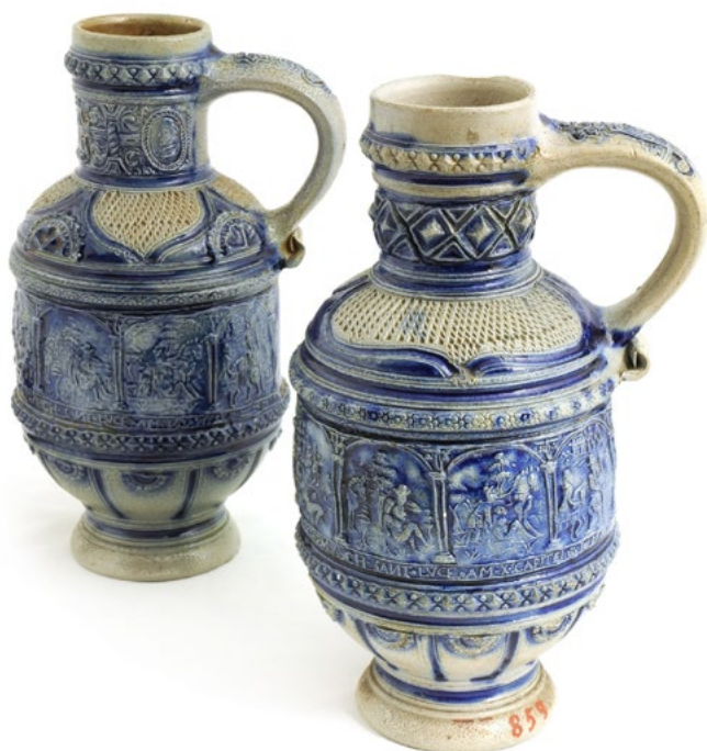
Ил. 1. Два кувшина с притчей о милосердном самаритянине. Германия, Вестервальд. Вторая половина XIX в. Каменная масса, соляная глазурь, рельеф, роспись кобальтом. В. 24. Фонд СГХМ, инв. №№ П-830 П-832

Коллекции декоративно-прикладного искусства, как правило, являются самой малоизученной частью художественных музеев. Радищевский музей — не исключение. Так, собрание немецкой керамики из каменной массы стало предметом пристального внимания только в последнее десятилетие, хотя основная часть этих предметов поступила от основателя музея А.П. Боголюбова. Между тем, именно такие художественные изделия, будучи частью обихода, в большей степени, чем другие арт-объекты, отражают традиционные представления, культурные и социальные контексты, картину мира тех, кто ими пользуется.