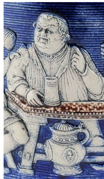
Ил. 6. Кувшин со сценой застолья и музицирования. Вестервальд, 1890–1900-е. В. 30. Фонд СГХМ, инв. №П-522. Фрагмент с Мартином Лютером

Характерная сцена воспроизведена в романе «Дебет и кредит» (1855), который, по мнению исследователей, наиболее выразительно передает мироощущение немецкой буржуазии эпохи историзма. Автор описывает состояние героини романа в день возвращения ее любимого. Все портреты на фарфоровых чашках «радуются» вместе с ней: «улыбаются доктор Мартин Лютер и черный художник Фауст, улыбаются даже Гёте и Старый Фриц» (der Alte Fritz — Фридрих II) [Freytag 1855]. Обратим внимание на очень показательный момент: портреты великих людей здесь словно оживают, включаются в происходящее действие, становятся соучастниками жизни простого, обычного человека. Так они воспринимаются героями романа — представителями немецкого «среднего» класса. Е. Бендл воспроизводит фотографию фрагмента экспозиции буржуазной гостиной в городском музее Меммингена (1929). Сохранность фотографии не позволяет рассмотреть все элементы изображения, однако две важные в контексте нашей темы детали — портрет М. Лютера на стене и сосуды в «старонемецком» стиле из каменной массы на столе — видны хорошо [Bendl 2016, p. 71]. Напомним, именно немецкая буржуазия была главным потребителем декорированной керамики из каменной массы, изготовленной полупромышленным способом отливки в гипсовых формах. Эти предметы передавали