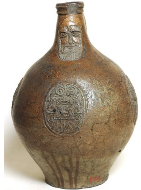
Ил. 9. Кувшин с бородатой маской. Кёльн-Фрехен. XVII в. Каменная масса коричневого тона, соляная глазурь, рельеф. В-36. Инв.№ П-1038, СГХМ

фактором сплочения, единения нации в Германии XIX века: по всей стране создаются песенные общества, организуются общенациональные и региональные фестивали. Члены песенных обществ были постоянными заказчиками пивных кружек. Сравнение кувшина СГХМ с сосудами, безусловно созданными по такому заказу 1 , позволило сделать предположение, что он имел аналогичное назначение. Музыкальность Лютера (он играл на лютне и других инструментах, хорошо пел), его любовь к пению и музыке — одна из важных составляющих рассматриваемого мифологизированного образа: постоянно, даже при переводе Библии или за молитвой, художники помещают рядом с ним лютню (ил. 10). Поэтому изображение Лютера на кувшине, созданном для песенного общества, кажется вполне логичным.