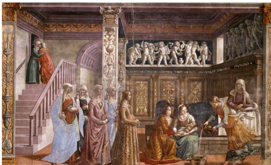
Ил. 5. Доменико Гирландайо. Рождество Марии. 1486–1490. Фреска. Капелла Торнабуони, церковь Санта Мария Новелла, Флоренция