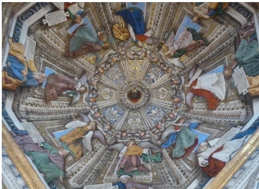
Ил. 7. Мелоццо да Форли. Купол. 1477–1482. Фреска. Сакристия Сан Марко, Санта Каза, Лорето.

наблюдать в расписанной Мазолино капелле-баптистерии в Кастильоне-Олона, где он еще больше усиливается свободным «перетеканием» композиции с одной плоскости на другую. Этот прием способствует также возрастанию иллюзии объема изображаемой архитектуры (в сценах «Иоанн Креститель обличает Ирода с Иродиадой» и «Казнь Иоанна Крестителя») или группы людей (в «Проповеди Предтечи»).