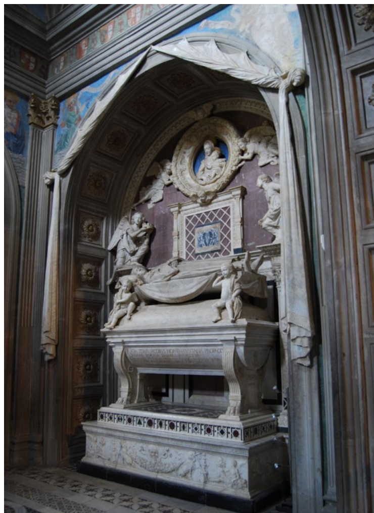
Ил. 10. Антонио и Бернардо Росселлино. Надгробие кардинала Португальского. 1461–1466гг. Мрамор, тонировка, золочение. Капелла кардинала Португальского, церковь Сан Миньято аль Монте, Флоренция.

Таким образом, именно итальянская капелла XV века оказалась наиболее открытой для использования достижений искусства Нового времени. Ее декорация предполагала множественность ракурсов и пространственно-временную протяженность восприятия, поэтому иллюзия чуда проявилась в ней особенно ярко и многопланово. В эпоху, когда ренессансная перспектива только зарождалась и была еще жива генетическая память, воспитанная на средневековых примерах-экземплях, любое явленное в художественном произведении чудо воспринималось более открыто, непосредственно и ярко. В XVI веке была достигнута еще большая техническая виртуозность, но изображение уже считалось интеллектуально, почти не оставив места трогательно-наивной вере в чудеса.