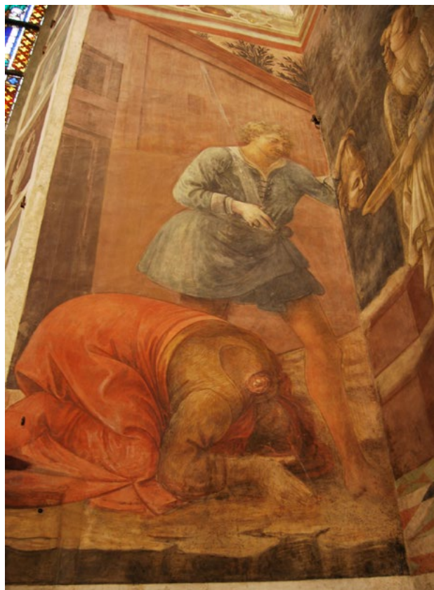
Ил. 9. Филиппо Липпи. Казнь Иоанна Крестителя. 1452–1465. Фреска. Капелла святых Стефана и Иоанна Крестителя, собор Санто Стефано, Прато.

в центр семейной капеллы копии-модели Гроба Господня, которая, как в усыпальнице Джованни ди Паоло Ручеллаи (во флорентийской церкви Сан Панкрацио), сама по себе может рассматриваться как чудо перенесения иерусалимской топографии на тосканскую землю. Примечательно, что именно в Тоскане появились одни из первых Сакри Монти, в которых фресковые композиции в небольших капеллах служили многофигурно-фоновым дополнением к скульптурным группам основных персонажей, находившихся не только в одном пространстве со зрителем, но иногда стоявших буквально в метре от него на полу. Отчасти эти скульптуры напоминали votivные (то есть изначально связанные с благодарностью за чудо исцеления) восковые изображения, которые в XV веке во флорентийской церкви Сантиссима Аннунциата занимали даже несколько ярусов [Варбург 2008, с. 84–85], практически не оставляя места молящимся.