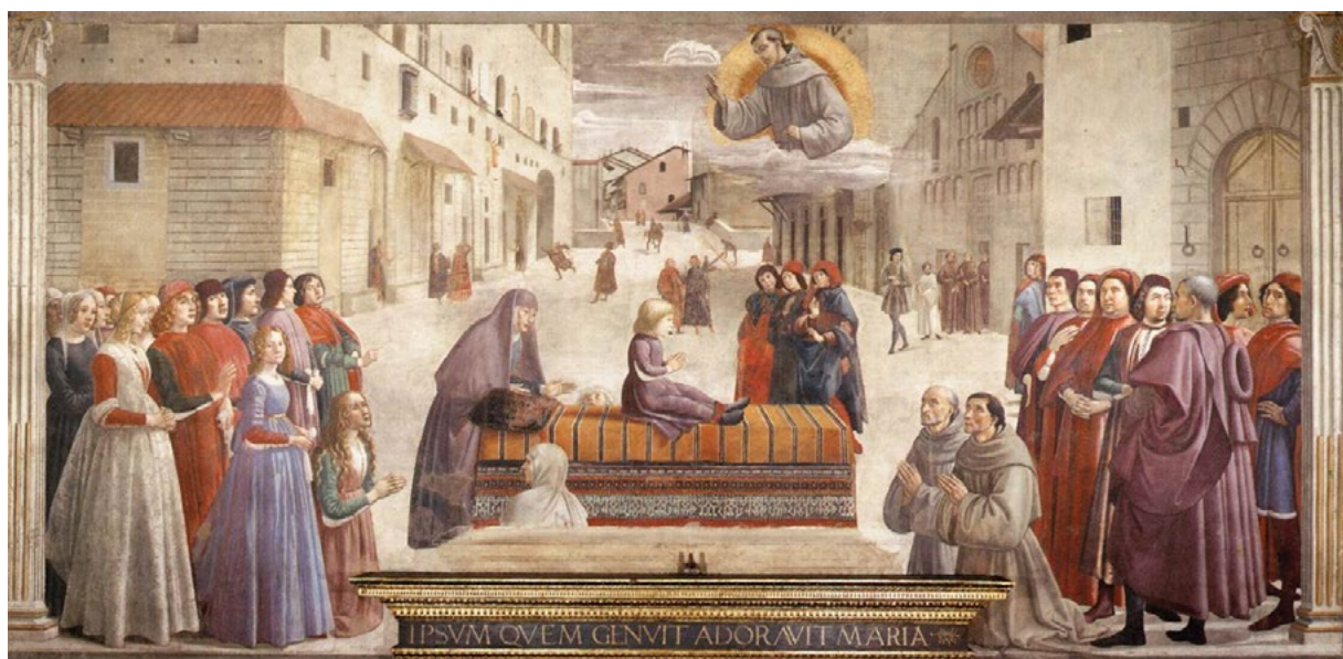
Ил. 1. Доменико Гирландайо. Воскрешение сына римского нотариуса. 1482–1485. Фреска. Капелла Сассетти, церковь Санта Тринита, Флоренция