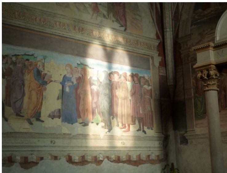
Ил. 3. Лоренцо да Витербо. Обручение Марии. 1469. Фреска. Капелла Маццатоста, церковь Санта Мария делла Верита, Витербо.

В Старой Сакристии флорентийской базилики Сан Лоренцо бронзовые побеги плюща появляются из колонн тосканского ордера (поддерживающих расположенную над саркофагом столешницу) и прямо на глазах у зрителя «устремляются» к бронзовым дискам с латунными шарами (отсылка к фамильному гербу похороненного здесь Джованни ди Аверардо де Медичи). Таким образом, в соответствии с еще классической погребальной иконографией, эти побеги становятся метафорой вечности и надежды на бессмертие [Shearman 1992, pp. 15–17].