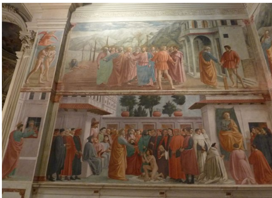
Ил. 4. Мазаччо, Мазолино да Паникале, Филиппино Липпи. Чудо со статиром. Воскрешение сына Теофила и апостол Петр на кафедре. 1424–1428, 1480-е. Фреска. Капелла Бранкаччи, церковь Санта Мария дель Кармине, Флоренция.

Чудеса и соотносимые с ними события Священной Истории становятся практически осязаемыми и актуализируются, когда они изображены в реальном городском ландшафте и «населены» многочисленными «скрытыми портретами» современников. На стенах капелл могут быть запечатлены целые театрализованные шествия. Например, в капелле Волхвов во флорентийском палаццо Медичи на Виа Ларга, по сути, показаны пышные торжества по поводу объединенных праздников Сан Джованни (небесного