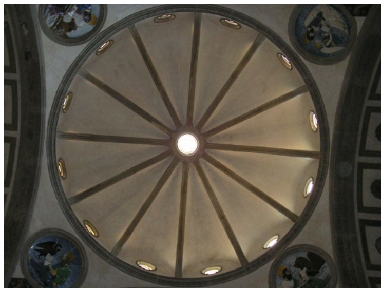
Ил. 2. Филиппо Брунеллески. Купол. 1459. (завершен после смерти архитектора). Капелла Пацци, церковь Санта Кроче, Флоренция.

Чудо может быть отмечено и реальным физическим светом. Так, в капелле кардинала Португальского (церковь Сан Миньято аль Монте, Флоренция) в определенное время суток солнечный свет озаряет «окно» с Богородицей и Младенцем, на самом деле, являющееся скульптурным тондо. А в капелле Маццатоста в церкви Санта Мария делла Верита в Витербо бифорий западной стены как бы «проецируется» на противоположную стену с «Обручением Марии» (ил. 3). Пятна света, как благословение, озаряют в этот момент фигуры будущей матери Спасителя и Иосифа, держащего процветший посох (еще одно чудо!).