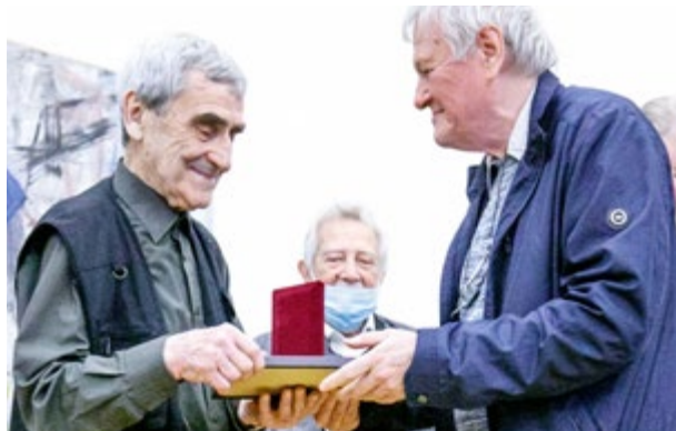
На открытии персональной выставки Павла Федоровича Никонова «Живопись наблюдений» 8 сентября 2020 года в Российской академии художеств.