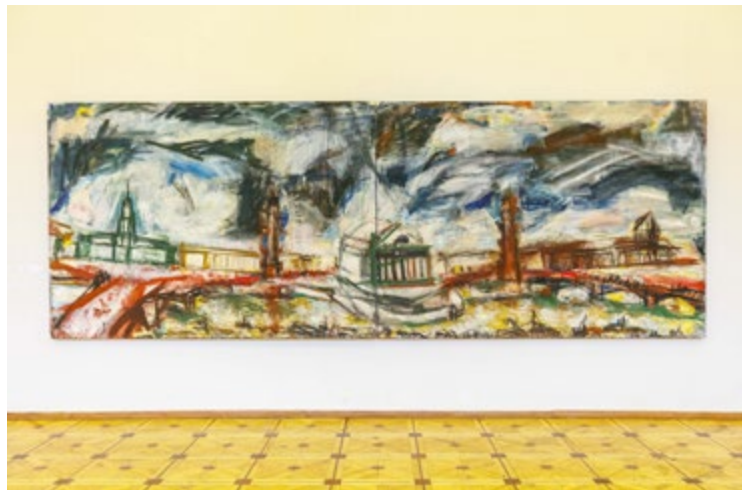
Экспозиция персональной выставки Павла Федоровича Никонова «Живопись наблюдений». Картина «Красный Питер». 2015.