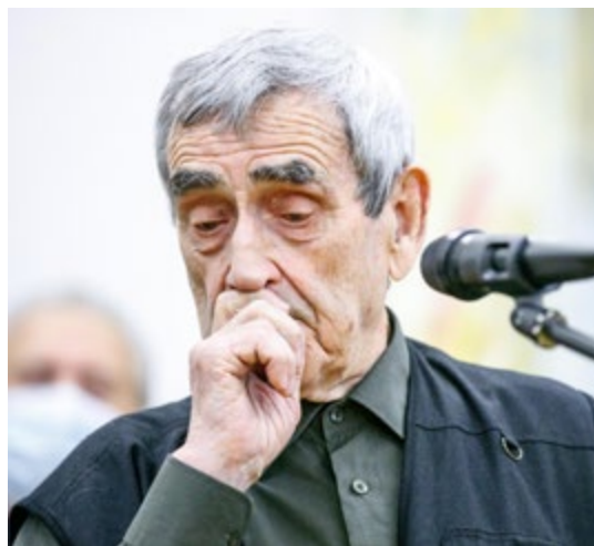
Павел Федорович Никонов на открытии персональной выставки «Живопись наблюдений» в выставочных залах Российской академии художеств 8 сентября 2020.

в капитал. По этой причине необходимо сфокусировать внимание не столько на имени, сколько на живописи и условиях, которые за ней стоят.