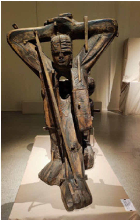
Ил. 6. Д. Д. Каминкер. Заложник. (Памяти Александра Галича). 1988. Дерево, железо. Государственный Русский музей, Санкт-Петербург.