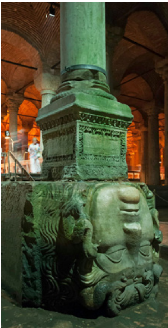
Ил. 8. Цистерна Базилика. IV–VI века. База колонны в виде головы Медузы Горгоны. Стамбул, Турция.