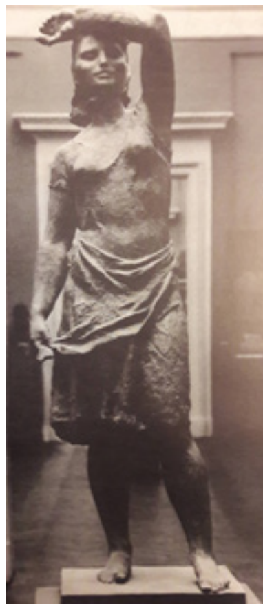
Ил. 5. В. Л. Рыбалко. Лето. 1957. Гипс. Собственность Министерства культуры РФ, Москва.

дискуссий, был отказ от копирования с гипсов. Здесь следует указать, что сам мастер отрицал любые клише в искусстве, считая, что каждое произведение должно быть результатом найденных в природе, подсказанных Природой закономерностей. Возможно, что с исторической дистанции его неприятие традиционных методов кажется слишком категоричным, но в обстановке революционных лет оно вполне вписывалось в общие тенденции искусства, свободного от любого культурно-исторического диктата.