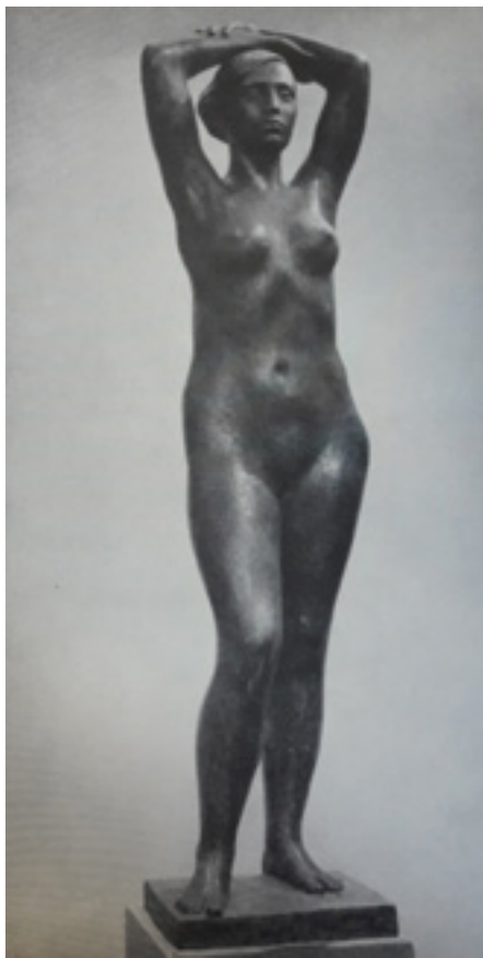
Ил. 1. А. Т. Матвеев. Женская фигура. Этюд. 1937. Гипс. Государственный Русский музей, Санкт-Петербург.

и приступает к руководству скульптурным отделением в бывшем училище Штиглица, а летом того же года избирается профессором — руководителем свободных художественных мастерских бывшей Академии художеств. С этого времени и до 1948 года он возглавляет мастерскую, выпустившую многих выдающихся мастеров скульптуры, среди которых М.К. Аникушин, Е.Ф. Белашова, В.Л. Рыбалко, Л.М. Холина. В период 1920-х годов, на который приходится расцвет деятельности скульптора, появляются такие работы, как «Флора» (1923), «Купальщица» (1923), «Заноза» (1923). Следующий важный принцип, который с особенной ясностью проявляется в «Этюде женской фигуры» (1937) (ил. 1), — это акцент на чистоте формы и общем впечатлении по отношению к деталям и украшениям: важным для неоклассического понимания формы является ее драматическое упрощение, придание ей монументальной лапидарности, повышенной выразительности простых объемов.