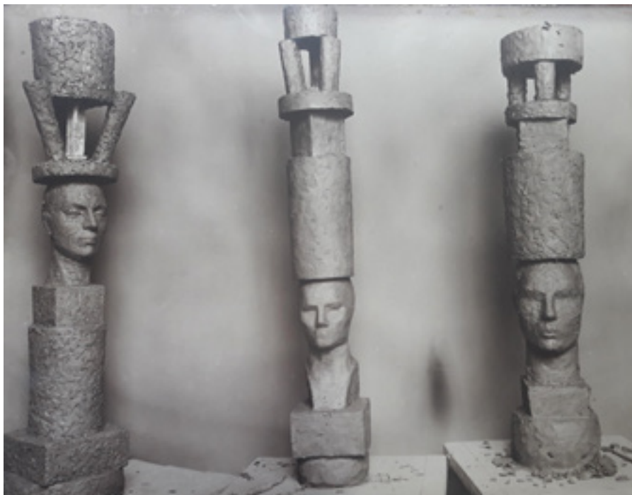
Ил. 3. Учебная композиция 1928–1929 уч. год. Мастерская профессора А. Т. Матвеева. Научный архив Российской академии художеств. Ф. 11. Оп. 1. Д. 6036. Л. 746.