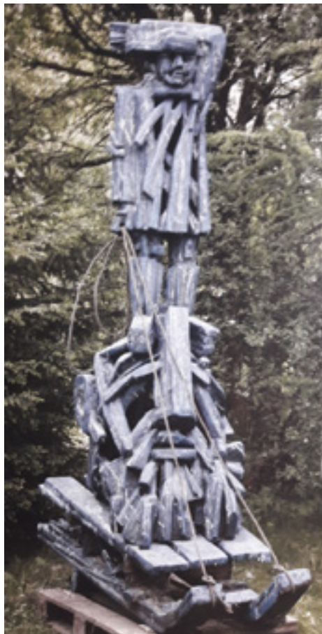
Ил. 7. Д. Д. Каминкер. Давид зимний. 1996. Дерево. Собственность автора.

прохождения предмета и пластического соотношения форм в пространстве. Задания выполняются над смешанными натюрмортами (комбинация организованного предмета и отвлеченного тела), что позволяет изучить построение реального предмета и установление пластической связи между несколькими формами. Масса и вес пластических форм меняются в зависимости от положения в пространстве. Для выявления конструктивной оси предусмотрены два задания над смешанными натюрмортами, подчеркивающие постепенное развитие форм и их взаимодействие (ил. 3).