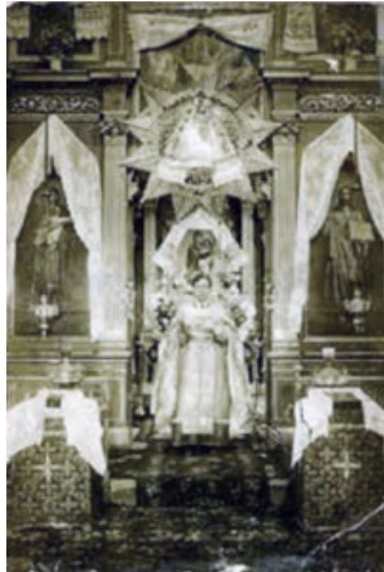
Ил. 7. Служба в церкви Рождества пресвятой Богородицы. Фотография. 1927.

помещается икона, посвященная святому или празднику, имя которого носит храм; второй ряд — деисусный чин; третий — праздничный; четвертый — пророческий; пятый — праотеческий. В конце XVII века иконостасы могли иметь шестой и седьмой ряды икон: Страсти апостольские — изображение мученической кончины 12 апостолов; Страсти Христовы — подробное изложение всей истории осуждения и распятия Христа. Эти дополнительные ряды икон не включаются в богословскую программу классического четырех-пятиярусного иконостаса. Таким образом, икона с сюжетом из Страстного цикла могла быть помещена в иконостасе храма, посвященного Богородице, вероятнее всего, в дополнительном ряду.