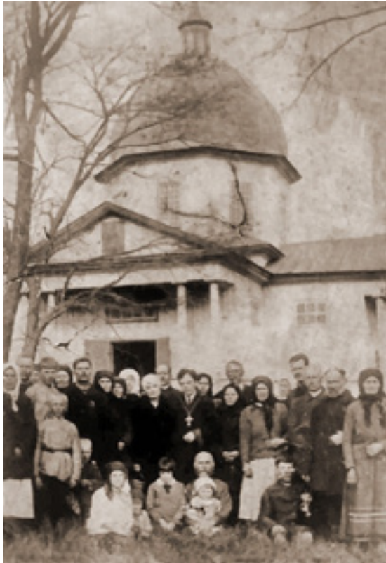
Ил. 6. Большая Мотовиловка. Церковь Рождества пресвятой Богородицы. Фотография. 1927.