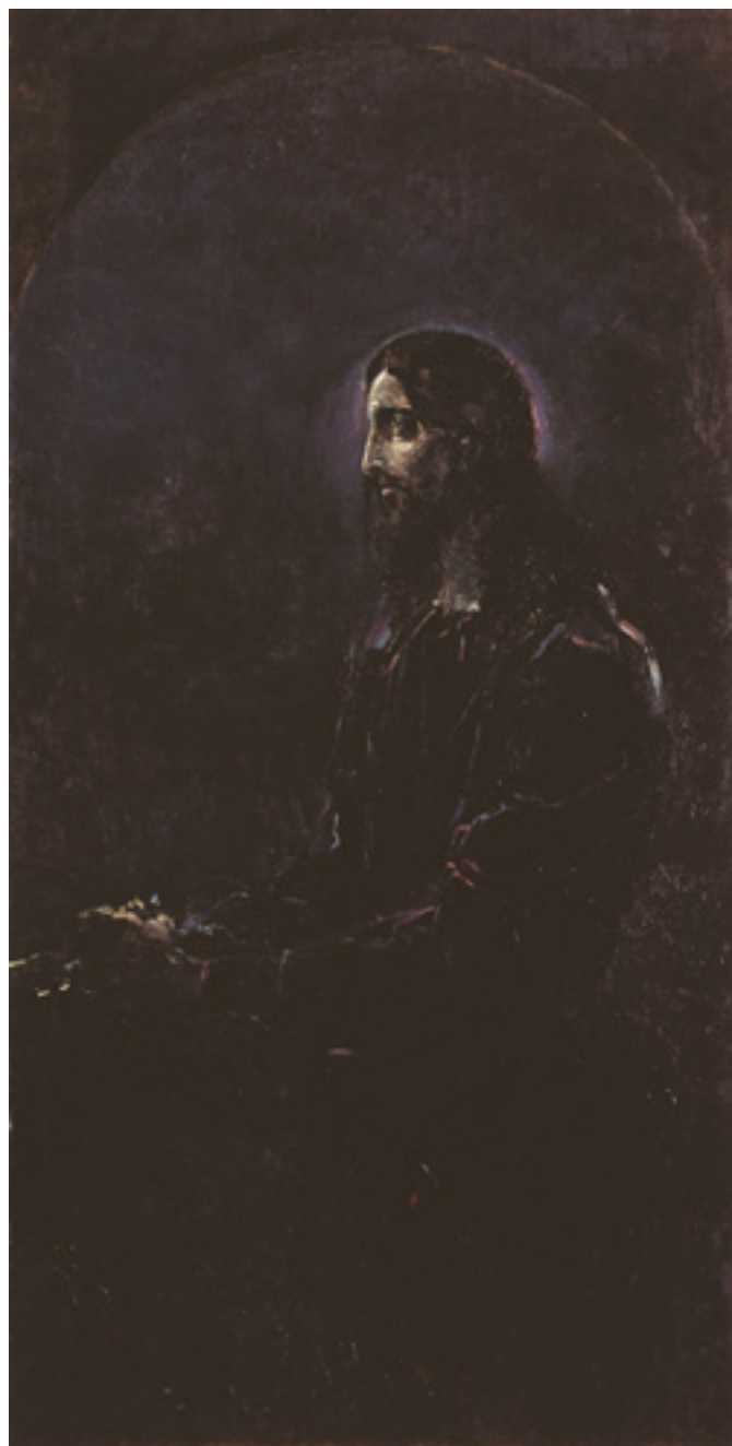
Ил. 1. М. А. Врубель. Моление о чаше. Холст, масло. 158×82. Национальный музей «Киевская картинная галерея», Украина.

В Национальном музее «Киевская картинная галерея» (НМ ККГ) хранится полотно «Моление о Чаше» (ил. 1), исполненное Михаилом Александровичем Врубелем в 1887 году 1 . Известно, что живописный образ был написан для мотовиловской сельской церкви, но подробных сведений о храме, для которого он предназначался, ни в архивных документах, ни в письмах или воспоминаниях