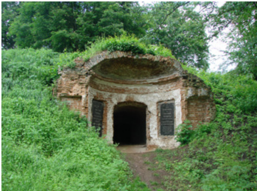
Ил. 10. Большая Мотовиловка. Усыпальница Руликовских перед реконструкцией.