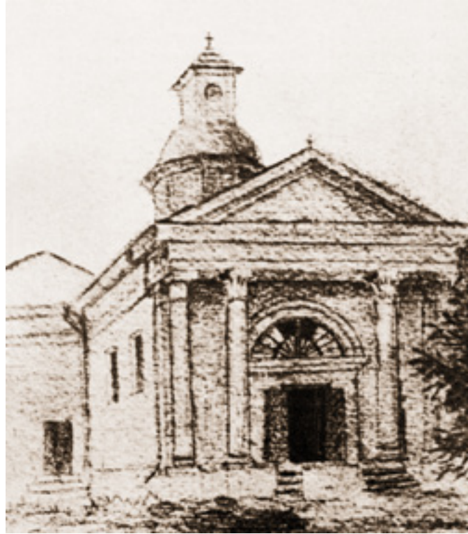
Ил. 9. Большая Мотовиловка. Костел во имя Иисуса Христа, молящегося перед страданиями. Предоставлено А. В. Страшукон.

и картон и картина сходны по технике с владимирскими эскизами» [Иванов 1912, с. 64].