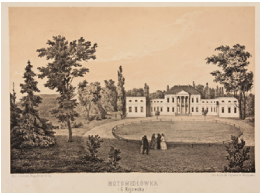
Ил. 3. Мотовиловка. Литография по рисунку Наполеона Орды. Варшава. 1876.

поездка в село Мотовиловка, расположенное в Фастовском районе Киевской области (ил. 2). Весомую помощь в нашем исследовании оказал местный краевед А.В. Страшук, который указал на некоторые исторические документы и архивные материалы, содержащие сведения обо всех храмах, располагавшихся в имении Тарновских во второй половине XIX века.