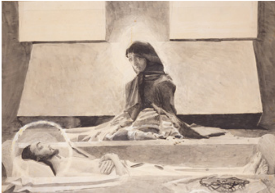
Ил. 8. М. А. Врубель. Надгробный плач. 1887. Третий вариант с фигурой Богоматери на втором плане. Бумага, черная акварель, графитный карандаш. 45×62.6 (в свету). Национальный музей «Киевская картинная галерея», Украина.

церковь», на котором были основаны наши первоначальные рассуждения, оно могло относиться также к церкви католической, т.е. сельскому костелу.