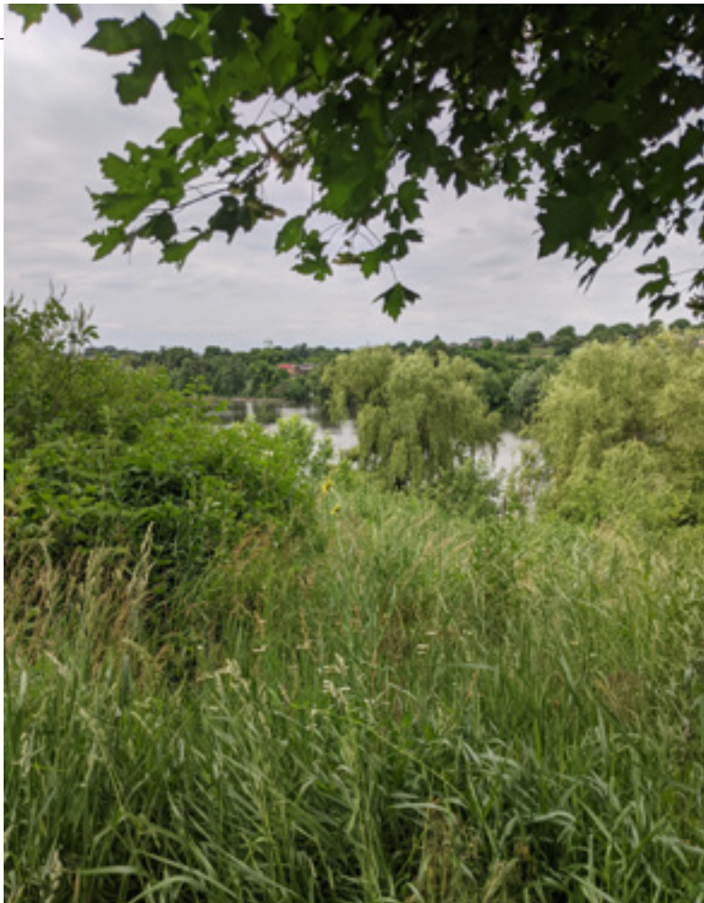
Ил. 2. Большая Мотовиловка. Фотография. 2023.

современников не обнаружено. История создания произведения до сегодняшнего дня остается непроясненной.