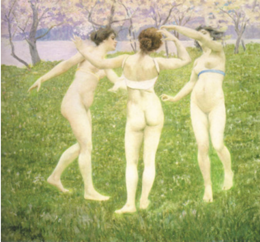
Ил. 2. Чезаре Лауренти. Новая весна. 1897. Темпера, холст. Международная галерея современного искусства Ка' Пезаро, Венеция.

прекрасных обнаженных человеческих фигур и белых лошадей, что ассоциируется с пластическими приемами мастеров кватроченто. Здесь художник создал своеобразный рельефный орнамент, в котором свободно-интуитивный ритм форм выразительно сочетается с классическим подходом в передаче анатомических особенностей движения фигур.