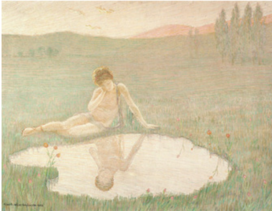
Ил. 5. Альберто Хелиос Гальярдо. Нарцисс и отражение. 1916. Масло, холст. Частное собрание, Италия.

объединяет такие вдохновленные античной мифологией картины, как «Нарцисс и отражение» (1916, частное собрание) Альберто Хелиоса Гальярдо (ил. 5), «Леда» (1907, Международная Галерея современного искусства Ка Пезаро, Венеция) Гаэтано Превиати, «Икар» (1907, частное собрание) Галилео Кини и «Рождение Венеры» (1915–1917, частное собрание, Милан) 11 Бенвенуто Бенвенути. Отметим, что образ Венеры — один из наиболее часто встречающихся. Например, Джованни Сегантини создал свой идеализированный образ богини любви в картине «Языческая богиня» (1894–1897, Милан, Галерея современного искусства). Его героиня — не земная красавица, а мечта, прекрасная нимфа, летящая над горами. Эта композиция является характерным примером искусства модерна с его асимметрией и витальностью. Здесь изображение Венеры пересекается с идеализированными женскими фигурами прерафаэлитов и Лоуренса Альма-Тадемы.