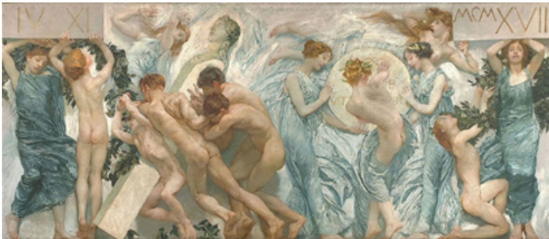
Ил. 6. Джулио Аристиде Сарторио. Церемония. Масло и энкаустика, холст. 1906–1923. Галерея Италия – Пьяцца Скала, Милан.

оживляя для современников культ эпохи Траяна и Адриана 13 . Эта картина поражает воображение многозначностью символики, в том числе тайной связью между величественной богиней фауны и беспомощной массой поверженных, выброшенных на скалу и перемешанных между собой людей и животных.