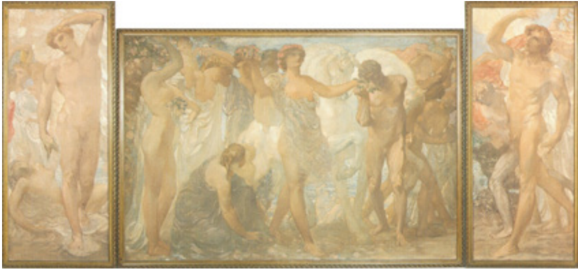
Ил. 1. Адольфо де Каролис. Лошади солнца. 1907. Темпера и масло, холст. Городская пинакотека, Асколи Пичено, Италия.

искусства, Венеция), созданные тосканцем Галилео Кини (1873–1956). В этом произведении путти представлены в образе играющих на трубах длинноногих мальчиков, тела которых волнами обвивают красные ленты и нарядные гирлянды из листьев. Сзади фигур пространство ликующего света образуют голубые морские воды и пышные белые облака. Изображения Кини определенно соотносятся с римской живописью «канделябрного» стиля в ясности ритма, повторе форм, передаче естественности движения. В композиционном плане художник также стремился решить задачи синтеза искусств в своих декоративных панно, так как они предназначались для оформления тосканского «Зала Мечты» на венецианской Биеннале 1907 года [Pica 1907, p. 386]. При сравнении с предшествующей настенной объемно-пространственной живописью романтизма и реализма в этом произведении заметен поворот Галилео Кини в сторону плоскости, к упрощению формы, к декоративности живописного языка, что сопоставимо, например, с исканиями Мориса Дени и других членов группы «Наби».