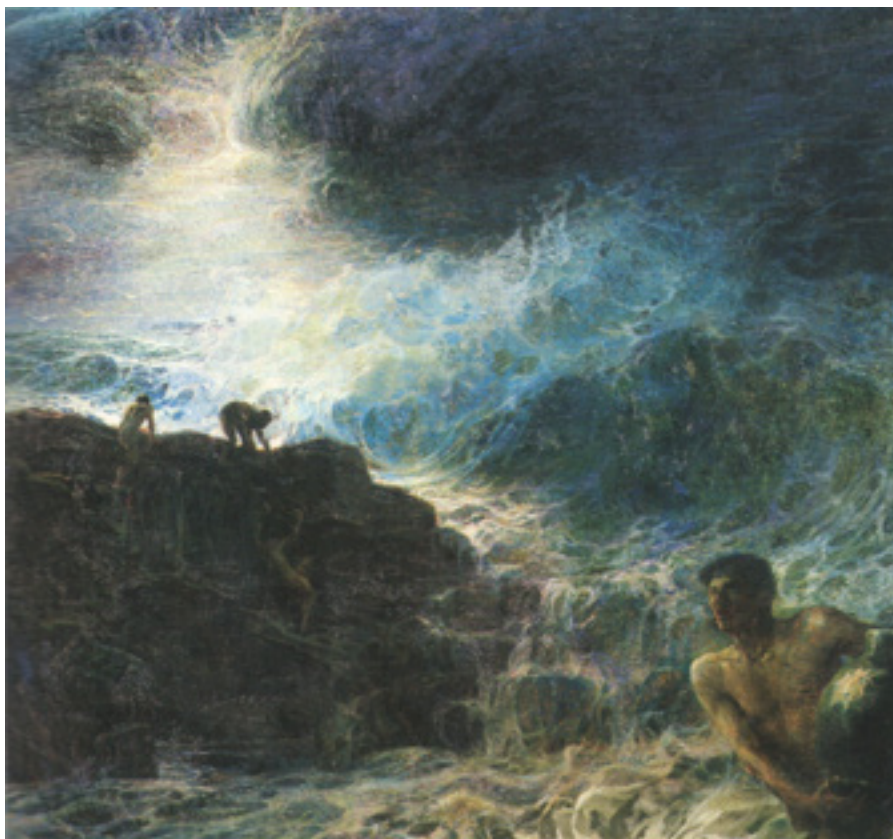
Ил. 4. Плинио Номеллини. Сокровища моря. Ок. 1901. Масло, холст. Национальная галерея современного искусства, Рим.

Дункан 10 , с которой был хорошо знаком, изобразил в образе радостной сирены, бегущей среди сверкающей морской пены («Тирренская радость», 1903, частное собрание). Античные мифологемы наблюдаются и в таких работах художника, как «Сокровища моря» (ок. 1901, Национальная галерея, Рим) (ил. 4) и «Красная нимфа» (ок. 1900, частное собрание) [Nomellini 2008]. Его картину-панно «Новые люди» (1909, Галерея современного искусства, Нерви, Генуя) также следует включить в этот ряд с точки зрения смысловых кодов, где античные мифологемы встречаются с индивидуальным мифотворчеством. В этой работе Номеллини изобразил праздничную процессию с детьми и молодыми людьми, которая возникает из ниоткуда и движется в никуда. Эти «новые язычники» размещены в условном, зыбком, наполненном светом и цветом пространстве. Важные идеи того времени угадываются в энергичных движениях преодолевающих дорогу людей, которых сопровождают красочные венки из цветов, вторящие им круглящиеся облака, символически «горящие» красным цветом развевающиеся ткани и ленты. Здесь также заметно влияние стиля либерти, который итальянские исследователи нередко называли «флореале» («цветочным»), имея в виду использование художниками вьющихся растительных и цветочных форм. В этом панно Плинио Номеллини представил в романтично-символистской форме свою интерпретацию возвращения золотого века, применяя синтетический принцип, сочетающий элементы натурального наблюдения, экспрессию и технику дивизионизма.