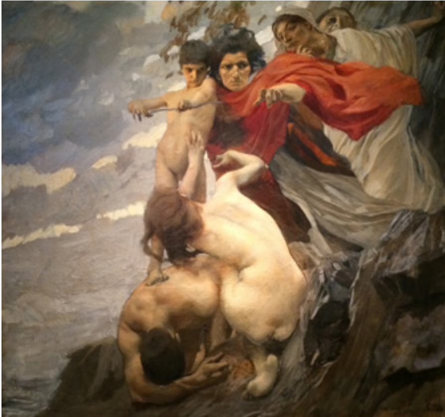
Ил. 9. Этторе Тито. Любовь и Парки. 1909. Масло, холст. Галерея современного искусства «Empedocle Restivo», Палермо.

Итальянских художников привлекала тема рока, которая нередко воплощалась в образе парки — в римской мифологии богини судьбы, рождения и смерти. К этой теме обратился художник из Неаполя Этторе Тито (1859–1941) в картине «Любовь и парки» (1909, Галерея современного искусства Empedocle Restivo, Палермо) (ил. 9). Античный сюжет о разрушительной силе слепой любви представлен художником в динамичной композиционной структуре с помощью диагонали в расположении фигур, чуждой гармонии и спокойствию классической античности, но нередко применяемой художниками начала XX века. Другой вариант этой темы, обусловленный социальным аспектом, можно встретить у миланского живописца Анджело Морбелли (1853–1919). В его холсте «Парки» (1904) тайна жизни заключена в руках вяжущих женщин — обительниц дома престарелых. В композиционном плане художник применил особенности натурального освещения, сближенные тона, пространство рамы, как бы сжимающее фигуры, и технику дивизионизма, что подчеркнуло идею неустойчивости и зыбкости человеческой жизни.