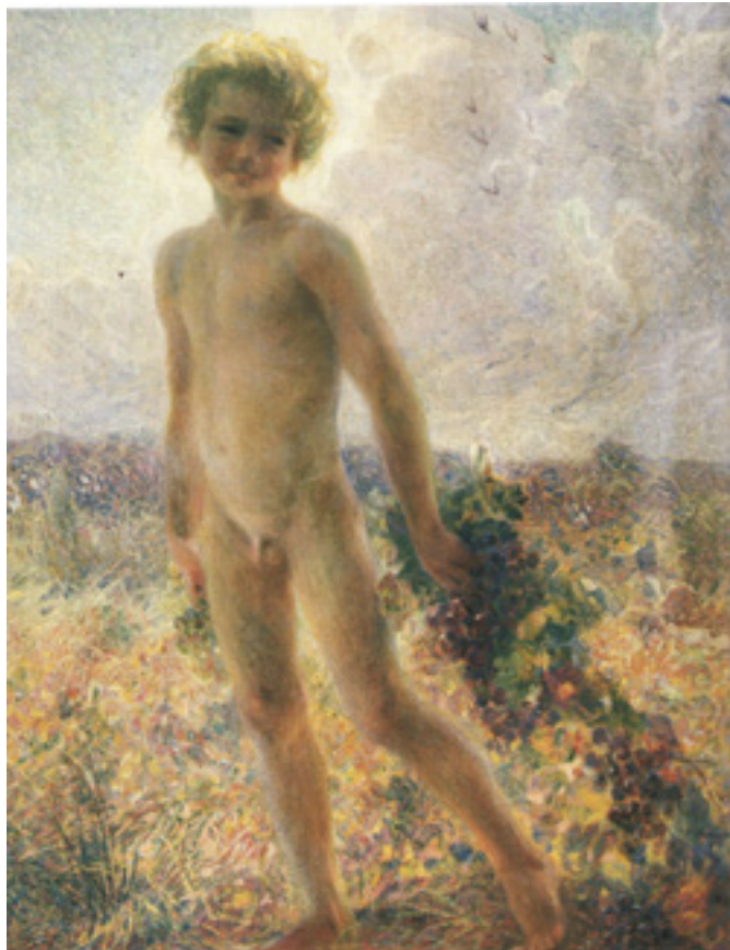
Ил. 3. Плинио Номеллини. Маленький Бахус. Ок. 1910. Масло, холст. Галерея современного искусства, палаццо Питти, Флоренция.

работе художник применил метод стилизации, используя волнообразные линии и заливки пастельных тонов, что сопоставимо, в частности, с приемами Альфонса Мухи в его театральных афишах. Этот художественный метод, отражающий важные пластические тенденции европейского модерна, в наибольшей степени применялся в графике и декоративно-оформительской стенописи, в том числе при обращении к античным сюжетам.