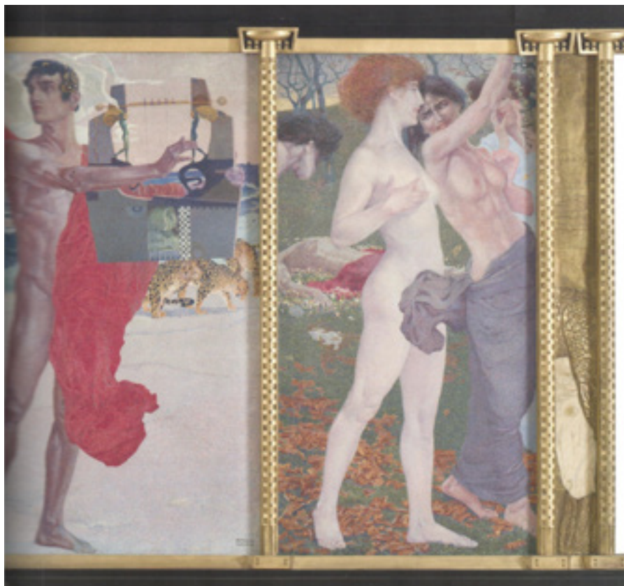
Ил. 8. Луиджи Бонацца. Легенда об Орфее. Воскрешение Эвридики. Смерть Орфея. 1905. Фрагмент. Масло, холст. Музей современного искусства Тренто и Роверето. Роверето, Италия.

известность как автор отражающих это стремление в аллегорической форме фризовых композиций, в которых одновременно выражалось поэтическо-философское сомнение в возможности возвращения былого величия. Диптихи «Церемония» и «Пробуждение» (оба 1908–1923, Галерея Италия — Пьяцца Скала, Милан) относятся к этому роду живописи (ил. 7). Данные холсты отличаются утонченным эстетизмом в решении образов: Сарторио создал динамичные символистские композиции из свободно движущихся фигур, некую авторскую аллюзию на древние римские рельефы, тем самым продемонстрировав свой интерпретационный диалог с античностью. Композиционная смелость и оригинальность художника, сочетание черт натурализма, академизма и маньеризма, необычная условная холодная гамма с зеленовато-белыми и желто-розовыми оттенками и применение техники энкаустики — все это признаки экспериментального подхода в исканиях нового синтетического стиля. Оба произведения были частью большой работы для Палаты депутатов в Палаццо Монтечиторио в Риме, которая стала вершиной его карьеры 14 .