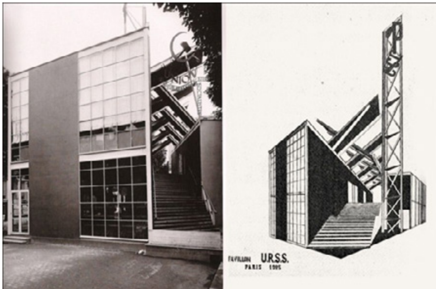
Ил. 3. Константин Мельников. Павильон СССР. Париж. 1925.