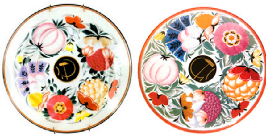
Ил. 5. Сергей Чехонин. Советский агитационный фарфор. Париж. 1925.

Высшей награды выставки — Гран-при — удостоились А.И. Кравченко и В.А. Фаворский за серии ксилографий (модной тогда техники). Представитель княжеского рода, исследователь Арктики и художник В.М. Голицын получил Золотую медаль за роспись богородицких деревянных шкатулок в народном стиле (ил. 6). Внимание членов жюри также привлекли броские рекламные плакаты А.М. Родченко с хлесткими текстами Маяковского для Моссельпрома, ГУМа и Резинотреста — они были отмечены серебряными медалями. Реклама стала важным инструментом продвижения новых идей и продуктов, а графические работы задавали стандарты для будущих дизайнеров. Рекламными постерами А.А. Экстер с костюмами жителей Марса в духе ар-деко сопровождалась на выставке кинопоказы документалистики А.М. Гана, «Кино-глаза» Дзиги Вертова, а также художественных фильмов «Стачка» С.М. Эйзенштейна и «Аэлита» Я.А. Протазанова. Ряд западных исследователей отмечали, что русские художники-конструктивисты «создавали работы, напоминавшие детали механизмов, составленные из геометрических форм, и пользовались новой техникой литерации, оказавшей влияние на графику ар-деко» [Стерноу 1997, с. 10]. За оригинальные программы художественного обучения, за новый аналитический метод и учебно-экспериментальные изделия художников и студентов был отмечен ВХУТЕМАС.