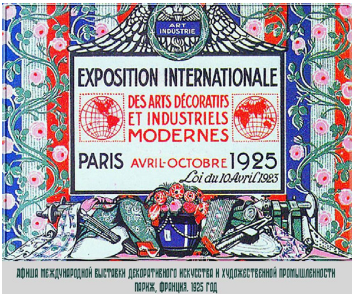
Ил. 1. Афиша международной выставки декоративного искусства и художественной промышленности. Париж, Франция. 1925 год.

Международная выставка в Париже, по замыслу ее организаторов, должна была восстановить центральную роль французских законодателей моды в общеевропейском пространстве после завершения Первой мировой войны (ил. 1). Идея проведения интернациональной выставки, сочетающей актуальный французский стиль и индустрию роскоши с демонстрацией изобретений в области науки, техники и культуры, возникла еще в довоенном Париже 1910-х годов. Она принадлежала Эктору Гимару, создателю знаменитых надземных павильонов парижского метро, и должна была стать ответом французских мастеров авторского изготовления роскошной мебели на растущий коммерческий успех индустриальной Германии, предпочитавшей поточное конвейерное производство. Вернисаж был намечен на 1915 год, но разразившаяся война и революционные