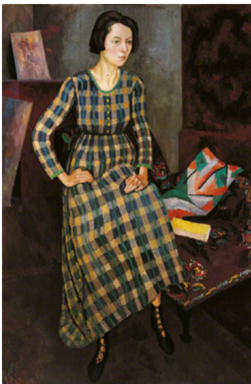
Ил. 8. Роджер Фрай. Портрет Нины Хемнетт. 1917. Темпл-Ньюсл-хаус, музеи и художественные галереи Лидса. Лидс, Йоркшир, Великобритания. Художница изображена в платье, сшитом из ткани по эскизам Ванессы Белл для «Омеги». Рядом подушка из ткани с принтом Maud, дизайн Ванессы Белл.