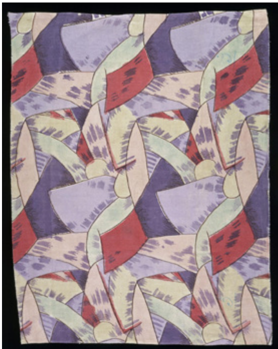
Ил. 11. Роджер Фрай. Ткань с принтом «Анемоны». 1913. Музей Виктории и Альберта, Лондон.