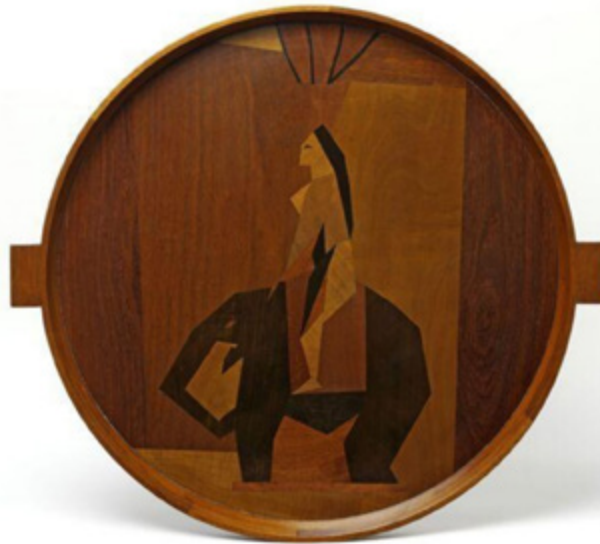
Ил. 10. Дункан Грант. Блюдо «Слон». 1914. Дерево, маркетри. Музей Виктории и Альберта, Лондон.

друга, рисуя неприличные сценки и затем пряча порнографические детали в абстрактные формы, из-за того, что Фрай был довольно консервативен. Мы маскировали сомнительные места так удачно, что только сами и могли их увидеть. <...> Роджер Фрай мог подойти и сказать: „О, какой восхитительный рисунок!“» [Cork 1976, p. 88].