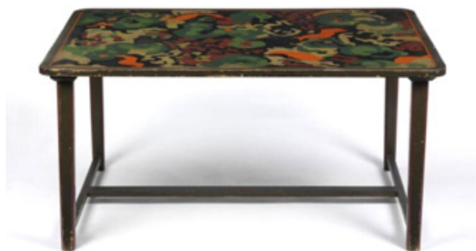
Ил. 13. Роджер Фрай. Стол «Пруд с лилиями». Дерево, роспись масляными красками. 1913–1919. Музей Виктории и Альберта, Лондон.

в мастерских, получили уверенность в том, что необходимо развивать нефигуративное направление. В «Эскизе для ковра» Фредерика Этчеллса и созданном по нему ковре (1913, музей Виктории и Альберта, Лондон), художник избавляется от целого ряда влияний в пользу упрощенных объемов основных форм, которые смешиваются в жесткую, почти архитектурную основу. И Уиндем Льюис достиг почти той же лаконичности в «Эскизе ковра» (1913, музей Виктории и Альберта).