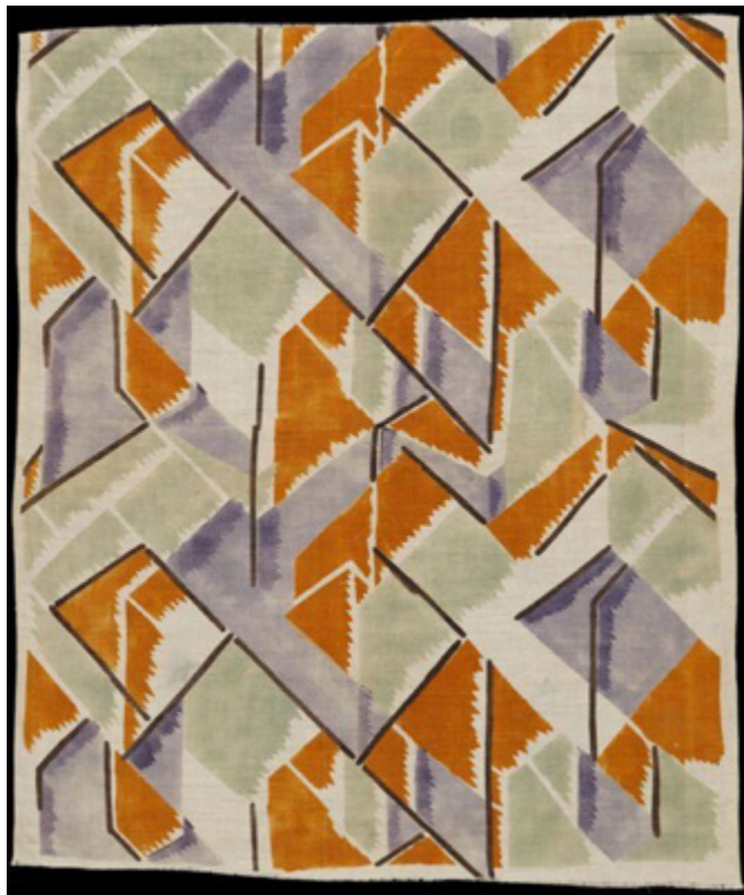
Ил. 7. Ванесса Белл. Ткань с принтом Maud. 1913. Музей Виктории и Альберта, Лондон.