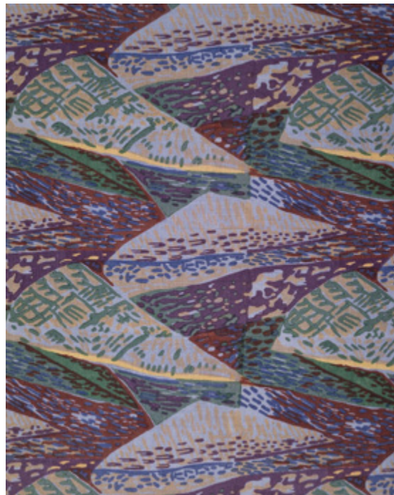
Ил. 12. Роджер Фрай. Ткань с принтом «Маргаритки». 1913. Музей Виктории и Альберта, Лондон.