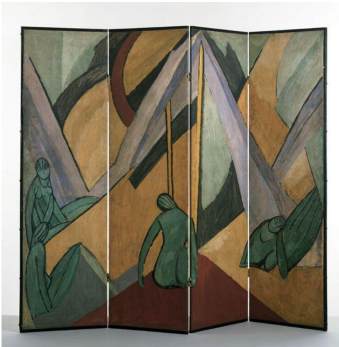
Ил. 14. Ванесса Белл. Ширма. 1913. Бумага, дерево, темпера. 1913. Музей Виктории и Альберта, Лондон.

и той же ткани создавали декоративные портьеры и платья для покупательниц. Тот же узор могли использовать для ковра или основы абстрактной картины. Работающие в мастерских художники занимались только декорированием, оставляя производство самих предметов профессионалам. Одной из основных задач была необходимость создавать легко воспроизводимые рисунки, так что дизайн был основан на упрощении, абстрактной композиции и чистом цвете. Например, они предлагали стулья, раскрашенные желтыми, зелеными и синими полосами, обои с пурпурным небом, синими скалами, занавески и ширмы с полуабстрактным рисунком синего, темно-красного и охристого цвета (ил. 14). Один из созданных по их эскизам ковер, который теперь находится в лондонском музее Виктории и Альберта, критики назвали «Лужей крови», поскольку его рисунок состоял из сходящихся к центру прямоугольников, менявших цвет от серого к фиолетовому, вишневому и, наконец, красному в середине, — и это название сохранилось до сегодняшнего дня.