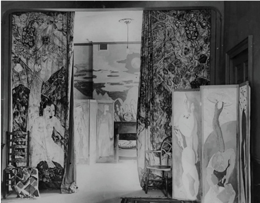
Ил. 2. Фотография входного холла мастерских «Омега». 1913. На переднем плане ширма Анри Дусе с Адамом и Евой в Эдемском саду.

что прошло время унылой и глупой серьезности, и наступил момент для радости и веселья, воплощенных в мебели и тканях (ил. 2).