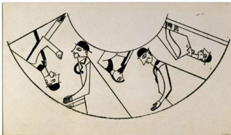
Ил. 6. Уиндем Льюис. Эскиз принта для абажура настольной лампы. 1913. Музей Виктории и Альберта, Лондон.

художник не испытывал особой симпатии к идеалам «Омеги». Стараясь заметить, где только возможно ручным трудом «мертвенность» механического воспроизводства, члены мастерских «Омега» делали все вручную — раскрашивали ширмы, покрывала, веера и т. д. Конечно, создание такого рода «безделушек» не могло удовлетворить амбиции Уиндема Льюиса. Тем более что в мастерских действовал принцип анонимности, раздражавший молодого художника, жаждавшего известности (ил. 6).