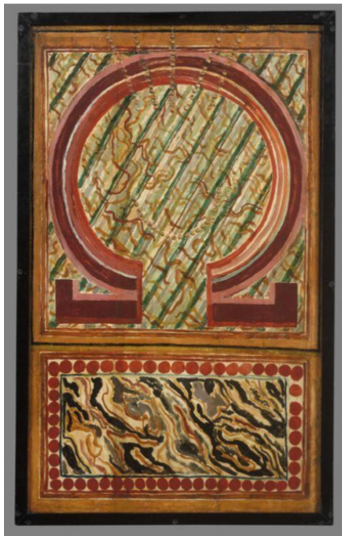
Ил. 3. Дункан Грант. Вывеска мастерских «Омега». 1913. Дерево, масло. Музей Виктории и Альберта, Лондон.

концепцию Уильяма Морриса, что объекты, изготовленные машинами, страдают от безжизненности и отсутствия человечности. Но в то же время Фраю была близка одна из идей Баухауса, что простота в дизайне предпочтительнее объектов, которые становятся непрактичными, если они чрезмерно украшены. Главной задачей мастерских было дать возможность молодым художникам, получавшим еженедельную оплату своего труда, не беспокоиться о выживании, а посвящать все свободное время живописи. Еще одной целью, о которой говорил Фрай, было новое чувство цвета и композиции, использованное в декоративном искусстве. Одним из главных принципов работы мастерских «Омега», на котором настаивал Роджер Фрай, была анонимность. Он считал, что предметы и мебель следует покупать и ценить за их красоту, а не за репутацию художника. Произведенные таким образом предметы не зависели от известности имени автора, их анонимность гарантировала автономию и ценность только формы. Все произведения подписывались знаком мастерских в виде греческой буквы: «Ω». «Омега» — последняя буква греческого алфавита, и в конце XIX века она использовалась для обозначения «последнего слова» в любой теме (ил. 3).