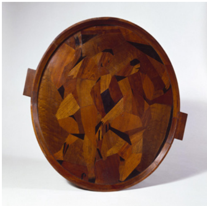
Ил. 5. Анри Гожье-Бжеска. Блюдо «Борцы». 1913. Дерево, маркетри. Музей Виктории и Альберта, Лондон.