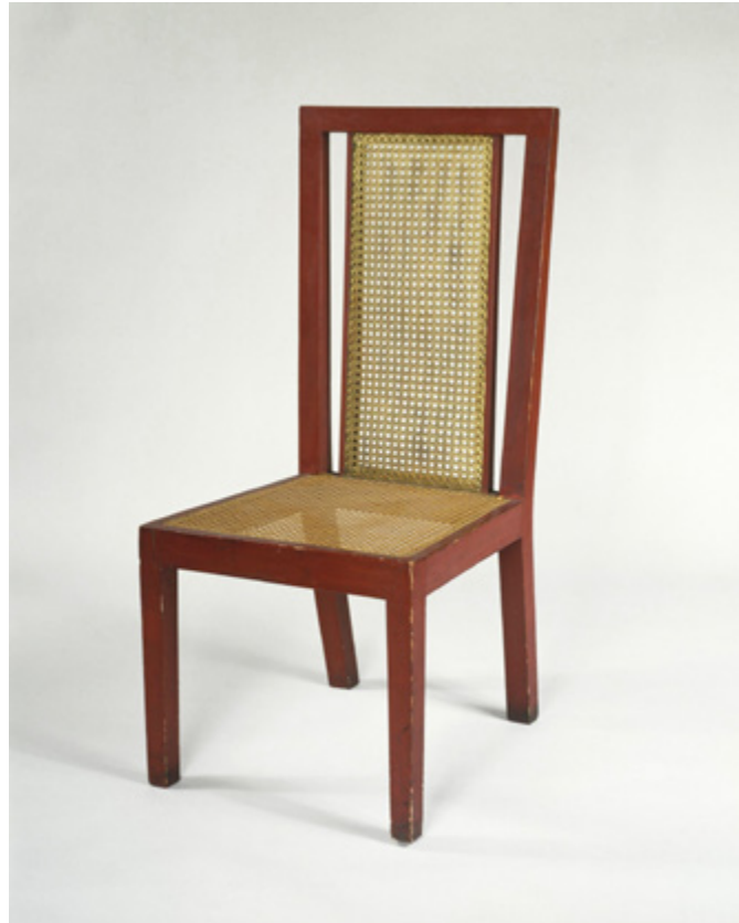
Ил. 4. Стул Dryad Limited, изготовленный по эскизам Роджера Фрая. 1913. Музей Виктория и Альберта, Лондон.

с тростниковыми сиденьями брали у компании Dryad Limited, постельное белье с принтами заказывали у текстильной мануфактуры во Франции (ил. 4).