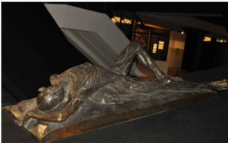
Ил. 5. И. В. Буяльский. Лежащее тело. Скульптор П. К. Клодт, художник А. П. Сапожников. Бронза.

как художника декоративно-прикладного искусства и одного из ведущих современных мастеров гобелена.