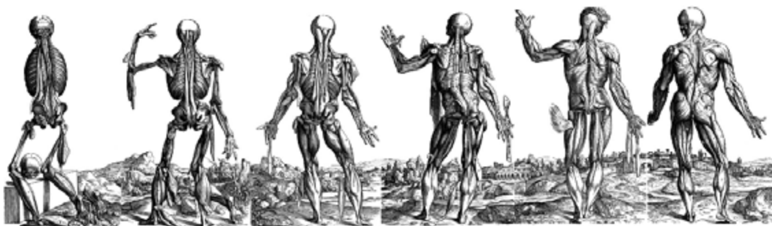
Ил. 1. Иоганн Стефан ван Калькар. Иллюстрация к анатомическому пособию Андреаса Везалия «О строении тела человека». Гравюра.