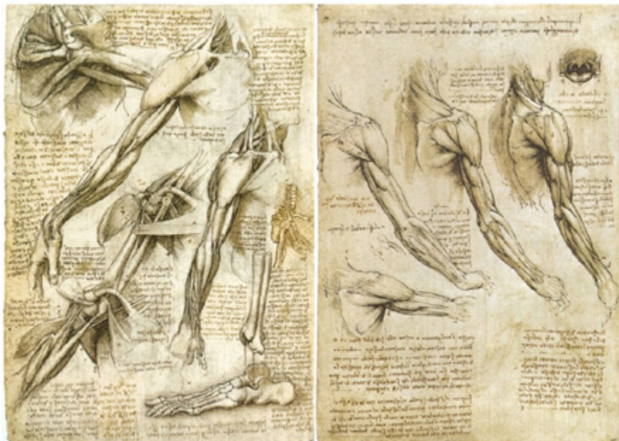
Ил. 2. Леонардо да Винчи. Анатомический анализ верхних конечностей и плечевого пояса. Бумага, тушь, перо.