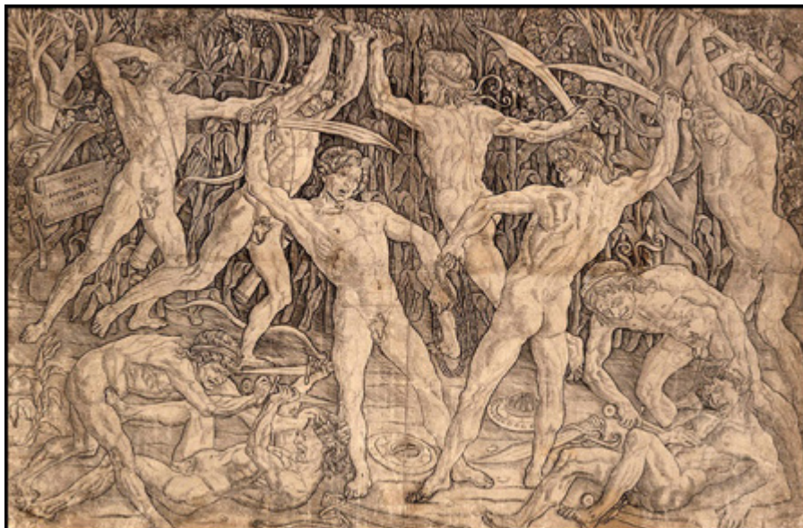
Ил. 4. Лука Синьорелли. Рисунки для фрески «Судный день».

установленные рамки, попытались определить значение, цель и необходимость ее применения в изобразительном искусстве, попутно уточнив определение «пластики» в контексте использования при создании художественного произведения.