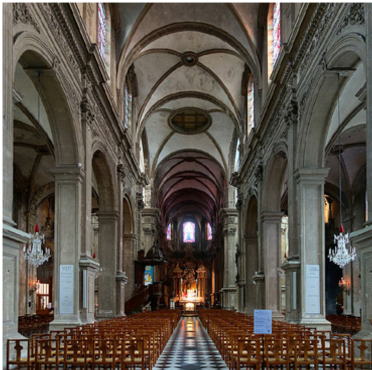
Ил. 6. Центральный неф Нотр Дам де Грас де Камбре. Камбре, Франция.