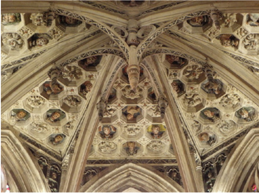
Ил. 2. Свод осевой капеллы Нотр Дам де Марэ де ла Ферте Бернар. Ла Ферте-Бернар, Франция.

травее, подчеркивая тем самым сакральную значимость пространства. Шесть нервюр свода последней травеи сходятся в многослойную конструкцию, центром которой является нервюра, образующая четкий круг. По сторонам ее поддерживают небольшие волютообразные конструкции, что также указывает на знание архитекторами классической архитектурной традиции. Ядром всей композиции последней травеи оказывается скульптура, изображающая творца, летящего на облаках. Подобное декоративное решение свода с петле-видной нервюрой, образующей практически самостоятельное архитектурное тело, могло быть подсмотрено архитекторами в соборе Сен Жерве Сен Проте (Saint-Gervais-Saint-Protais).