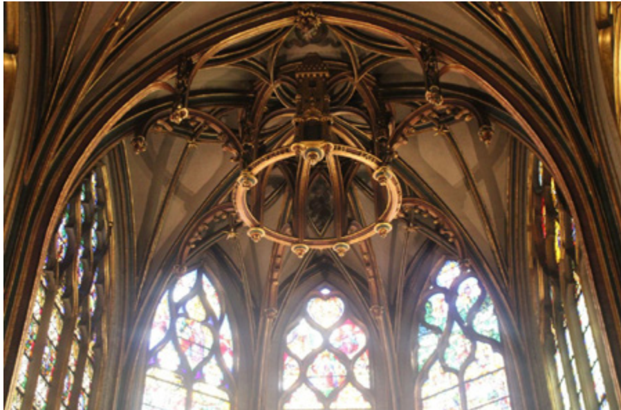
Ил. 3. Свод северной капеллы Богоматери Сен Жерве Сен Проте. Париж, Франция.