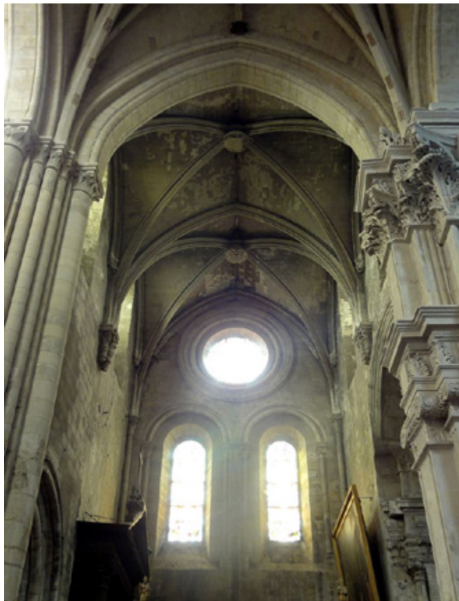
Ил. 5. Средокрестие Сен Маклу в Понтуазе. Понтуаз, Франция.

понимать, что если Сент Эсташ строился в XVI веке с нуля, то Сен Маклу — это по большей части все-таки памятник реставрации раннего Нового времени. Наиболее показательным здесь является пространство средокрестия, где западные опоры представляют собой группу наложенных друг на друга классических пилястр, в то время как восточные являются тонкими готическими колонками с растительными капителями. Иными словами, мы сталкиваемся со случаем буквального одевания средневековой конструкции в ренессансные декорации. Любопытной оказывается и попытка не просто добавить ренессансную декорацию, но подстроить ее под метрическую систему готического собора. Имеется в виду введение ярусных отметок, которые соответствуют конструктивным особенностям. То есть, нижние пилястры завершаются прихотливой ионической капителью на уровне пяты арки нижней аркады. Далее же, на нее непосредственно ставится следующая пилястра, которая в свою очередь завершается композитной капителью на уровне пяты арки свода. Можно констатировать, что в случае с XVI веком мы сталкиваемся с примерами уникального поиска компромисса между еще очень устойчивыми принципами поздней готики и во многом насильственным вторжением Ренессанса. При этом следует отметить, что, несмотря на всю пестроту различных вариантов стилистического синтеза, ощущение собора как единого целого все еще остается в пределах готических интонаций, что демонстрируют в первую очередь структурные элементы.