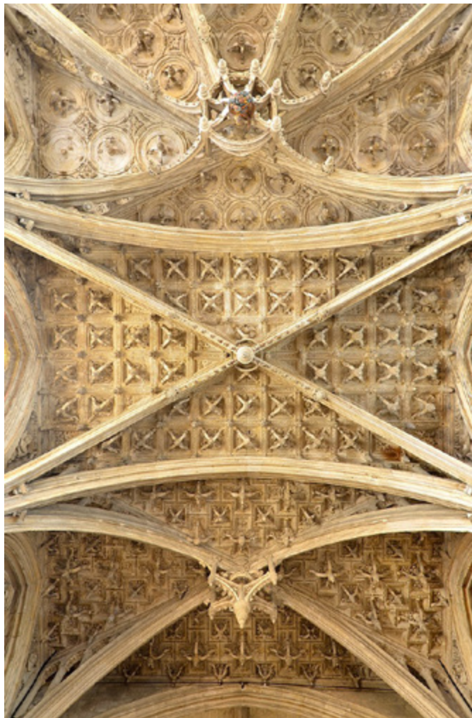
Ил. 1. Свод осевой капеллы Нотр Дам де Марэ де ла Ферте Бернар. Ла Ферте-Бернар, Франция.

Наконец, третья травея содержит внутри исключительно круглые кессоны, что очевидно отвечает по форме очертаниям конхи, в ромбовидные промежутки между которыми вставлены изысканные цветочные мотивы. В отличие от первых двух травей капеллы, в круглых кессонах третьей отсутствуют растительные элементы (ил. 2).