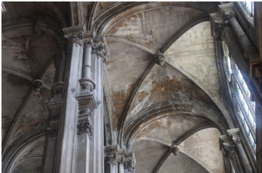
Ил. 4. Боковой неф Сент Эсташ. Париж, Франция.

готику с Ренессансом, что привело к визуальным усложнениям и перенасыщением деталями внутреннего пространства.