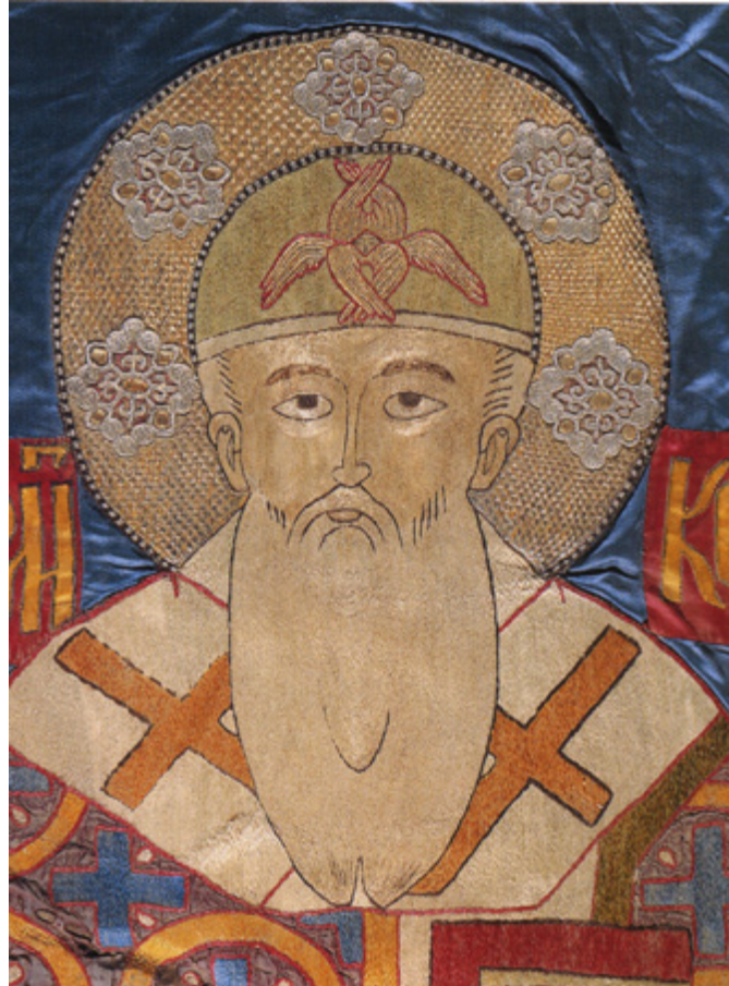
Ил. 9. Митрополит Иона. Покров. Деталь. Музеи Московского Кремля.

на покрове, она утвердилась в своем мнении. Именно с этой атрибуцией — мастерская Анастасии Романовны, конец 1540-х — 1552 гг. — памятник стал широко известен, много раз публиковался и экспонировался, но на сегодняшний день она должна быть пересмотрена.