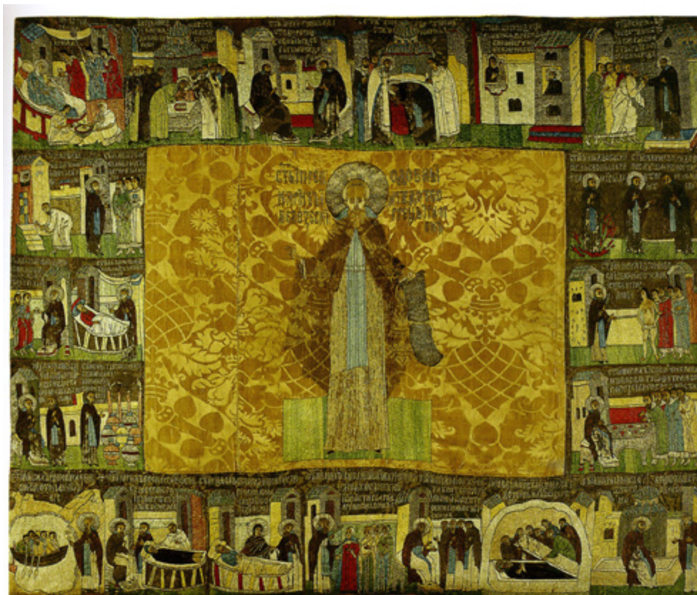
Ил. 6. Кирилл Белозерский в житии. Пелена. Государственный Русский музей, Санкт-Петербург.

жемчужгом, в венце девят каменей. А кругом покровов Трехаръ чудотворца Сергия низан жемчужгом. Подложен тафтою зеленою» [Описи 1615 и 1635 гг. 2021, с. 334–335].