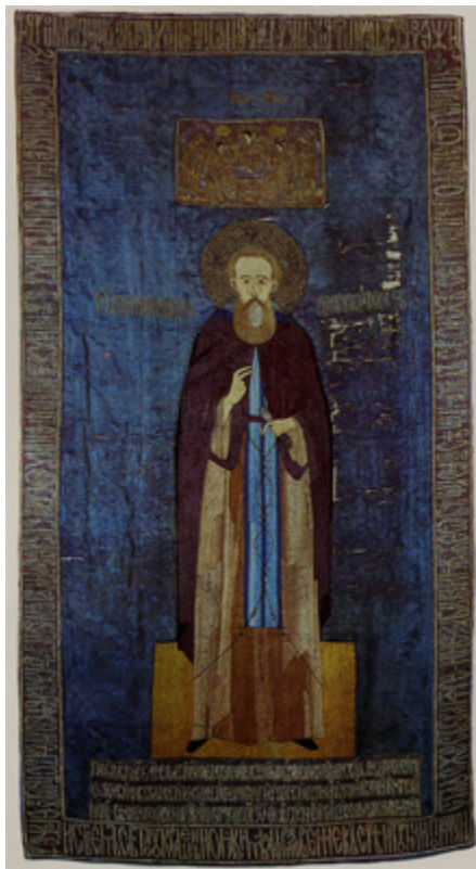
Ил. 3. Сергей Радонежский. Покров. 1524. Сергиево-Посадский историко-художественный музей-заповедник, Московская область.

и кондаком (высота букв на верхней и боковых каймах около 7,7 см). Нижняя кайма была занята тремя строками вкладной надписи, буквы около 4,5 см высотой. Они сохранились, но черный шелк между ними практически утрачен 5 .