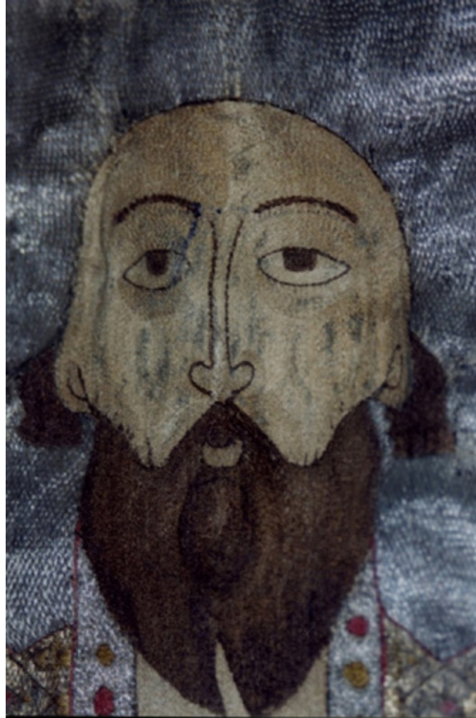
Ил. 10. Леонтий Ростовский. Покров. Деталь. 1514. Государственный музей-заповедник «Ростовский кремль». Ростов Великий, Ярославская область.