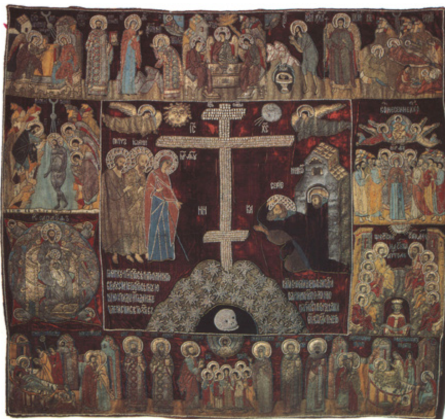
Ил. 4. Явление Богоматери Сергию Радонежскому. Пелена. 1524. Сергиево-Посадский историко-художественный музей-заповедник, Московская область.

Далее, начиная с 28 марта 1534 года, записаны датированные вклады Ивана Васильевича, по своему отцу и прочие. В тексте Вкладной книги упомянуты знаменитая пелена 1524 года, покров с Голгофским крестом вклада второй супруги Василия Елены Глинской (т.е. 1525–1538 годов) и два лицевых покрывала: один на черном атласе, второй — на синей камке с каймами вишневого атласа. Первый покров, шитый изначально на черном атласе и переложенный на дымчатую камку, до сих пор не был идентифицирован. По крайней мере, те покрывала, которые введены в научный оборот, не соответствуют этому описанию.