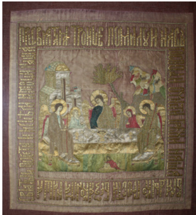
Ил. 7. Святая Троица. Пелена из Кирилло-Белозерского монастыря. Кирилло-Белозерский историко-архитектурный и художественный музей-заповедник, Кириллов, Вологодская область.

пелены с Троицей из Кирилло-Белозерского монастыря и несколько фрагментов шитья, в позднее время нашитых на детали облачения в той же обители.