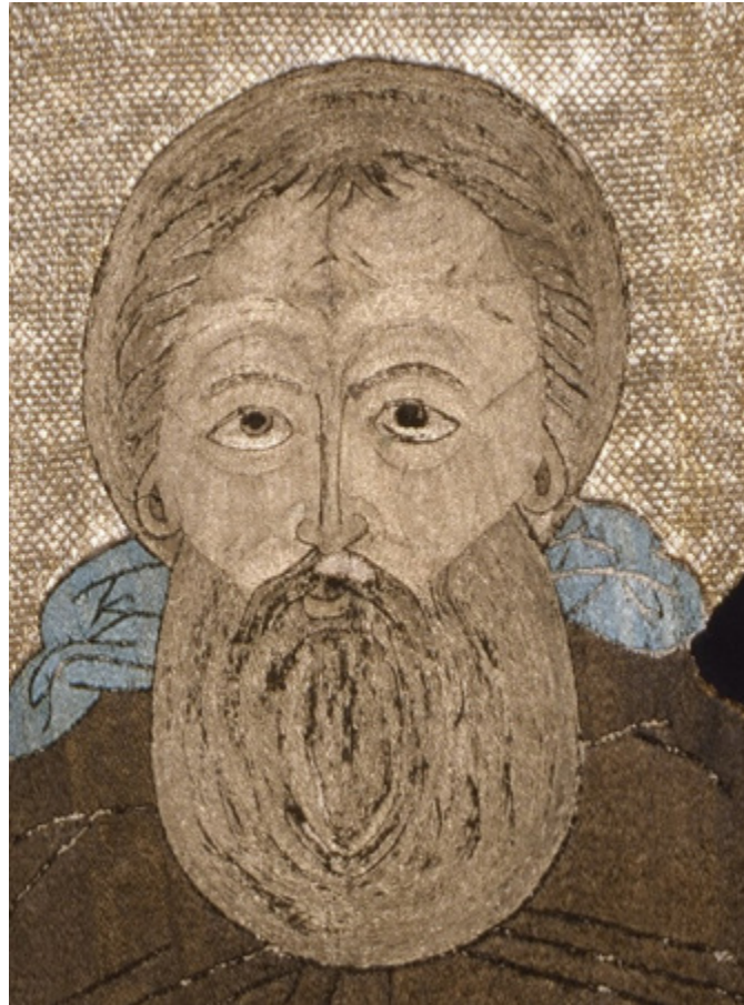
Ил. 11. Кирилл Белозерский. Покров. Деталь. 1514. Государственный Русский музей, Санкт-Петербург.

по краю — все эти детали относятся к XVII веку и были смонтированы на покров одновременно [Качалова 2005, с. 176–183]. Опись 1627 года сообщает: «...в раке у чудотворца покров по таусинной камке, образ чудотворцов шит золотом и серебром волоченым...» [Маясова 1995, с. 31]. В описи 1701 года покров уже сменил фон и приобрел свой нынешний вид: «...на чудотворцовых мощах два покрыва: первый нижний, отлас лазоревой, а на нем вышит шелком разным его чудотворцов образ, по краям покрыва обшито кружиком кованым, золото с зеленым шелком, подложен тафтою желтою» [Маясова 1995, с. 31].