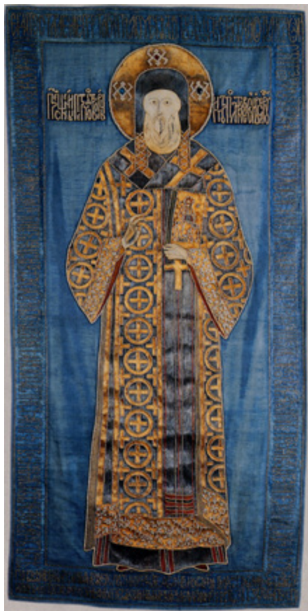
Ил. 1. Митрополит Петр. Покров. 1512. Музеи Московского Кремля.

В распоряжении исследователей имеется ряд памятников, имеющих твердую атрибуцию, то есть тех, в принадлежности которых к великокняжеской мастерской у нас нет поводов сомневаться, поскольку вкладные надписи с датами и именами имеются на самих вещах: это — покровы митрополита Петра 1512 года 1 , Леонтия Ростовского 1514 года 2 и преподобного Кирилла Белозерского 1514 года 3 . В эту же группу входят и два предмета из Троице-Сергиева монастыря: покров преподобного Сергия Радонежского и пелена «Явление Богоматери Сергию», оба 1524 года 4 .