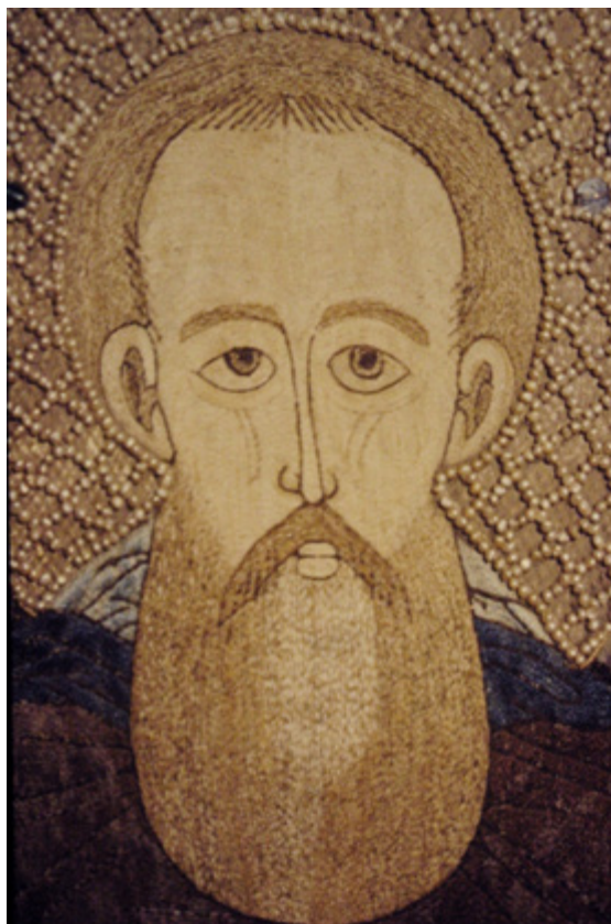
Ил. 5. Сергей Радонежский. Покров. Деталь. 1524. Сергиево-Посадский историко-художественный музей-заповедник, Московская область.

почему исследователи, писавшие о покрове, утверждают, что изображение шито «по синей камке» [Маясова 1971, кат. 69, с. 126; кат. 69, с. 140].