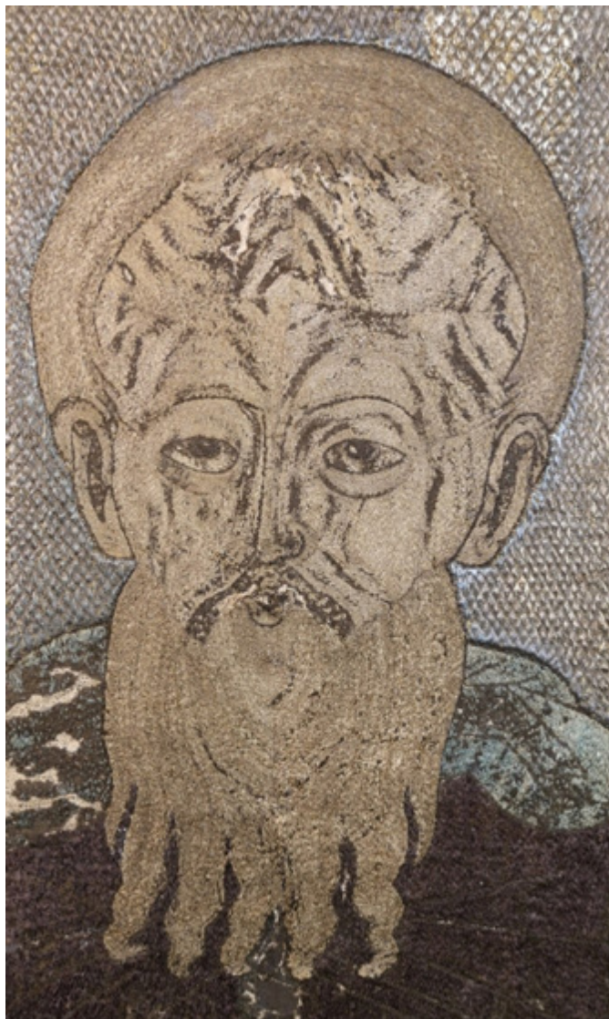
Ил. 12. Пафнутий Боровский. Покров. Деталь. Государственный Русский музей, Санкт-Петербург.

покровы Леонтия, Кирилла и Пафнутия (ил. 10, 11, 12). Рисунок ушей (тоже очень характерная деталь) у Ионы и Пафнутия идентичен. Абрис глаз и ушей — это своеобразные маркеры мастерской. Можно сравнить две пары ликов на покрывах Ионы и Пафнутия (ил. 9, 12) и на покрывах Ионы 1553 года и Кирилла 1555 года.