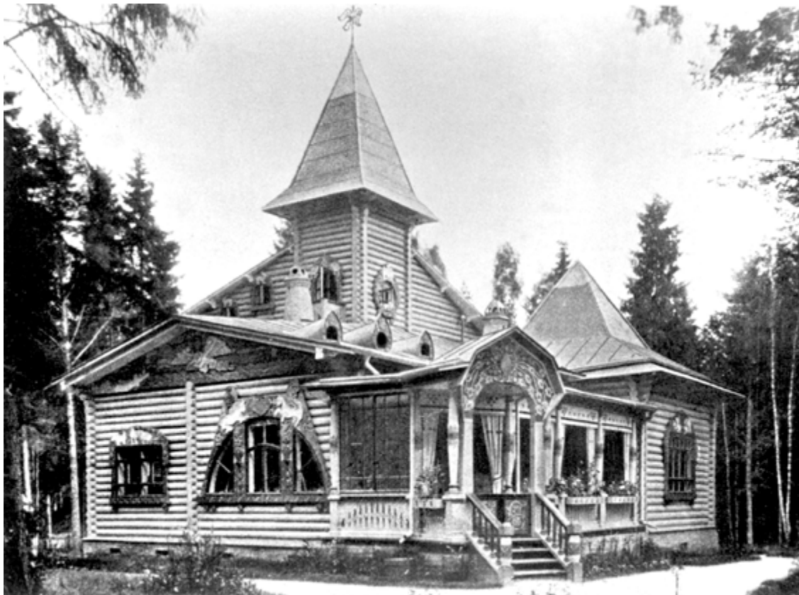
Ил. 6. С. И. Вашков. Дача И. А. Александренко в поселке Клязьма. 1908. Фото 1910-х годов.

в древнерусском зодчестве» [Забелин 1900], оказавшем, видимо, большое влияние на мировоззрение Вашкова.