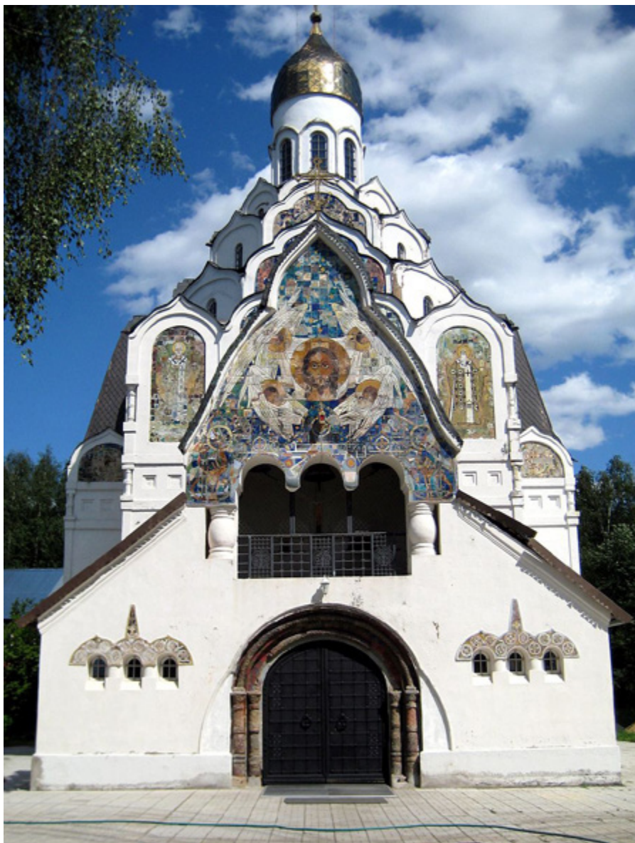
Ил. 18. Церковь Спаса Нерукотворного в поселке Клязьма. Современное фото.

Среди дорогой дачной застройки поселка дача Александренко 13 сразу обращала на себя внимание сказочностью образа и цельностью архитектурно-стилистического решения всего участка: дача владельца, хозяйственные постройки, садовые скамейки, фонари, ограда с резными воротами и калитками были спроектированы Вашковым по единому замыслу. Их объединяло яркое многоцветье деревянной сюжетной резьбы и то ощущение неподдельной рукотворности, которым дышат все создания Вашкова.