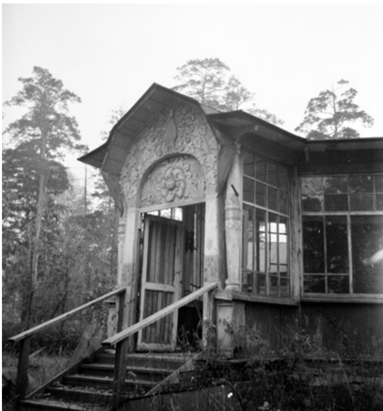
Ил. 7. Крыльцо дачи И. А. Александренко. 1987. Публикуется впервые.

события современности. Всецело поглощенный организаторской и художественной работой, Вашков почти не писал статей сам — исключение составляют две небольшие статьи и рецензия 1914 года [Вашков 1914а, 1914б, 1914в]. Его задачей было сплотить единомышленников для общего дела. «Благородное сердце, живой и острый ум обаятельного собеседника, бодрого духом, кипевшего избытком жизненных сил человека» [Пшеничников 1914, с. 12] — все это делало Сергея Ивановича центром внимания и притяжения московской художественной среды и втягивало знавших его ученых, археологов и художников в бурный водоворот его новых творческих замыслов. Нередко пользуясь советами В. М. Васнецова, Вашков как редактор «Светильника» всегда находил способ сообщить об этом при публикации своих произведений [Катапетасма 1913, Георгиевский 1914], подчеркивая этим свое почтительное ученичество 6 .