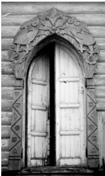
Ил. 11. Резная дверь на балконе второго этажа башни. © Фото М. В. Нащокина. 1987. Публикуется впервые.

водосвятные чаши, подсвечники для местных икон, запрестольные семисвечники, пасхальные трикирии и дикирии, рипиды, кропила, ковчеги для святых Даров, дароносицы, мирницы, кадила, киоты, складни, аналои, панихидные столики, гробницы для плащаницы, свечные ящики и прочую церковную мебель, оклады для евангелий и икон, церковные ткани и одежды священства (стихари, фелони, оплечья, саккосы, епитрахили, посохи), митры, панагии, венчальные венцы, Голгофские, запрестольные, напрестольные, выносные, наперсные и даже крестильные кресты. Поражают широкая вариативность и элегантная простота созданных Вашковым предметов, нередко восходящая к лаконизму раннехристианских форм.