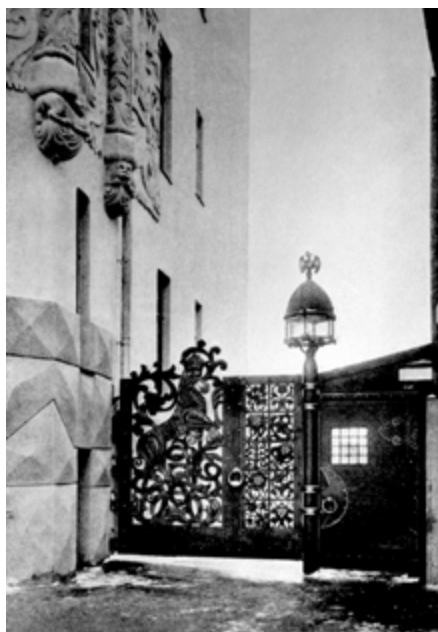
Ил. 5. Ворота и калитка во двор доходного дома церкви Троицы, «что на Грязех». 1908–1909. Фото 1910-х годов.

Выраженное в текстах предпочтение народного искусства профессиональному, поиски фольклорных истоков русской архитектуры, содержательной наполненности его форм и образов сближают кредо Вашкова с художественными поисками Абрамцевского кружка 1880–1890-х годов и Талашкинских мастерских рубежа веков. Интересен его вывод: «Как ни хорошо, как ни прекрасно было византийское искусство, оно все же не могло вытеснить и заглушить своим блеском и пышностью слабое, еще не вполне сформировавшееся, но уже народившееся русское самобытное искусство... Не находя себе приюта ни в величественных храмах византийской архитектуры с их холодной торжественностью, ни в пышных палатах князей, оно ютилось и развивалось в деревянных избах и клетях, на коньках высоких теремов, по подзорам дверей и окон...» [Вашков, 1903б, с. 5]. Это пылкое утверждение совпадает со взглядами И.Е. Забелина, изложенными в его знаменитом труде «Русское искусство. Черты самобытности