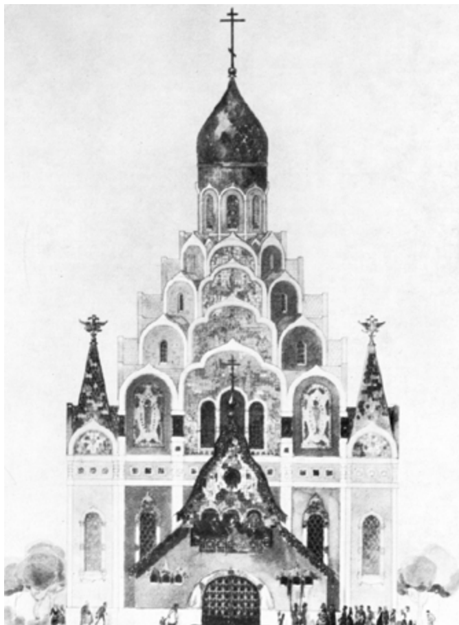
Ил. 17. С. И. Вашков. Проект храма-памятника в честь 300-летия Дома Романовых Свв. Николая Мирликийского и митрополита Алексия. 1913.

Один из русских архитекторов писал в 1910 году: «...уже ясно сознана задача искусства — художника-зодчего для нашего времени: если мы, прикованные к городу, лишены природы неумолимой жизнью, — архитектура должна заметить насколько возможно красоты этой природы, <...> должна насадить в своем орнаменте еще невиданные цветы, населить его фантастическим миром зверей и птиц. Вдохновляемый народным творчеством, детски искренним и глубоким, зодчий найдет новые формы и введет в заколдованный круг красоты весь город с его площадями, улицами, домами и нашим жилищем» [Эйсер 1910, с. 8]. Дом Вашкова — образец решения этой задачи.