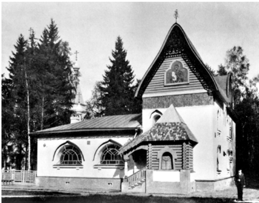
Ил. 16. С. И. Вашков. Церковно-приходская школа имени Ивана и Пелагеи Александренко в поселке Клязьма. 1910–1913. Фото 1910-х годов.

современной архитектуре... уже появились люди вдумчивого творческого проникновения в глубины подлинного русского зодчества. Сергея Ивановича я причисляю к этим немногим художникам...» [там же]. А отношение Вашкова к Васнецову было почти благоговейным. «Пушкин и Васнецов! Какое прекрасное сочетание двух русских гениев, как много говорят русскому сердцу эти два славных имени. Один — воссоздатель русского языка, другой — национального искусства...» [Вашков 1914б, с. 31–32].