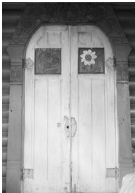
Ил. 13. Резная дверь первого этажа, ведущая с террасы в дом И. А. Александренко. © Фото М. В. Нащокиной. 1987. Публикуется впервые.