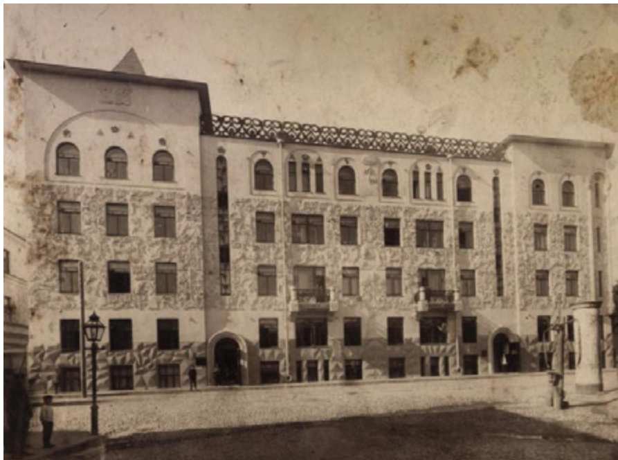
Ил. 4. С. И. Вашков. Доходный дом церкви Троицы, «что на Грязех». Чистопрудный бульвар. С. И. Вашков. 1908–1909. Фото 1910-х годов.