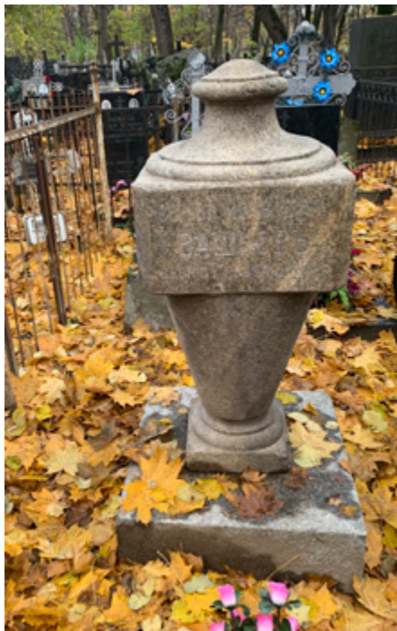
Ил. 19. Надгробие С. И. Вашкова на Ваганьковском кладбище. Октябрь 2024.

с ее резными наличниками и другими деталями остался в русской архитектуре начала XX века уникальным по замыслу, цельности и художественным качествам.