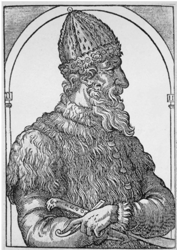
Ил. 2. Иван III. Гравюра из «Космография» А. Теве. 1575.

К началу XVI века использование небольших по формату портретных изображений (или миниатюрных) [Кызласова 1993, с. 80] в межгосударственном общении уже не было чем-то исключительным. Еще на исходе 1469 года в Италию был отправлен посол Иван Фрязин (Джан Баттиста Вольпе) для переговоров о женитьбе Ивана III на Софье Палеолог. Посланник получил наказ привезти ее изображение («а царевну на иконе написану принесе») [Независимый летописный свод 1999, с. 418, 430]. В этот же период могло появиться изначально карандашное изображение Ивана III (ил. 2). Его появление, как считал Д.А. Ровинский, было обусловлено желанием Софьи также получить представление о внешности русского правителя [Ровинский 1882, с. 3]. «Портрет» Василия III, переведенный в гравюру, чего требовали тогдашние условия книжной печати, широко известен по публикации 1575 года второго тома «Космографии» Андре Теве (ил. 3). В отличие от «прямоличного» погрудного изображения из собрания Павла Йовия, еще одна гравюра, выполненная Августином Хиршфогелем, использованная в издании записок о Московии Сигизмунда Герберштейна 1547 года, представляет того же Василия III в полный рост, в профиль, сидящим на троне (ил. 4). Все перечисленные образцы изображений признаны Д.А. Ровинским «достоверными», т. е. восходящими к натурным рисункам. Уже от них пошли многочисленные вариации, которые широко распространились в Европе [Ровинский 1882, с. 3].