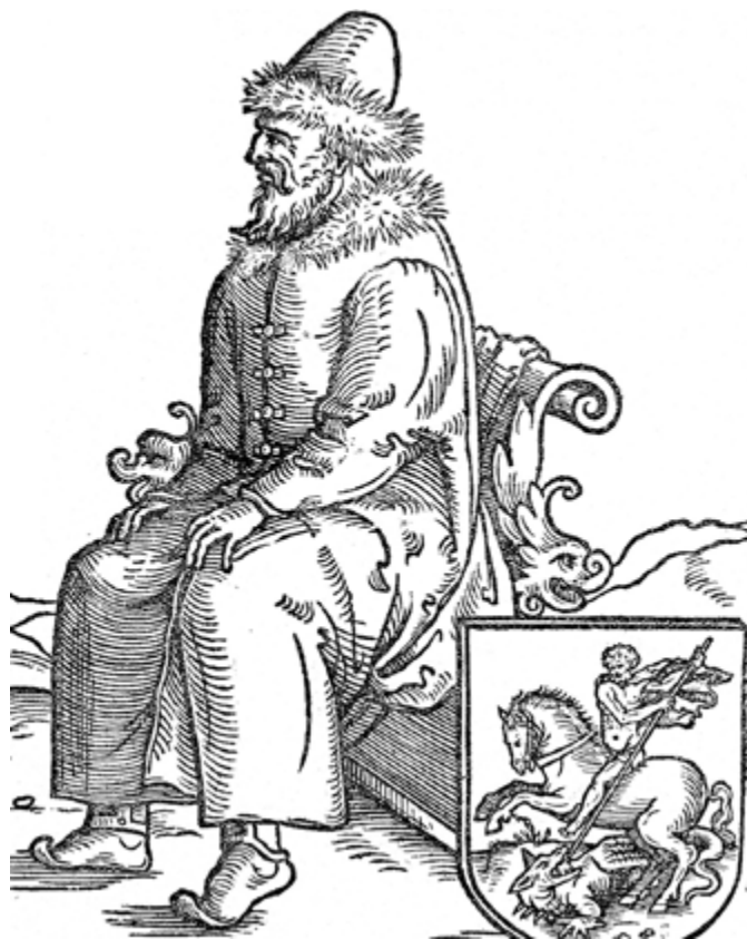
Ил. 4. Василий III. Гравюра из «Записок» Сигизмунда Герберштейна. 1547.