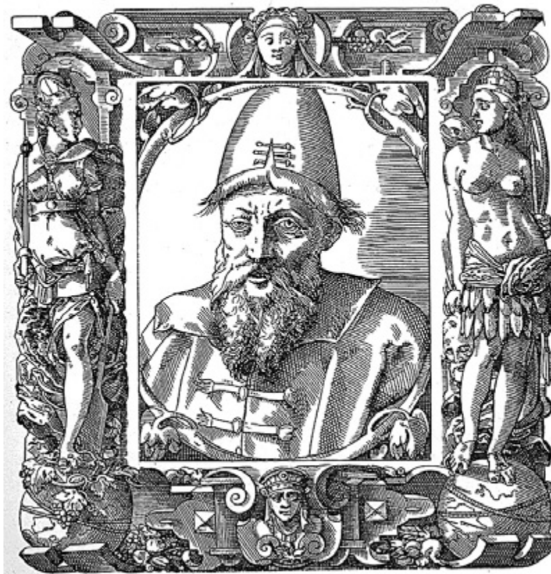
Ил. 3. Василий III. Гравюра из сочинения Павла Йовия. 1575.