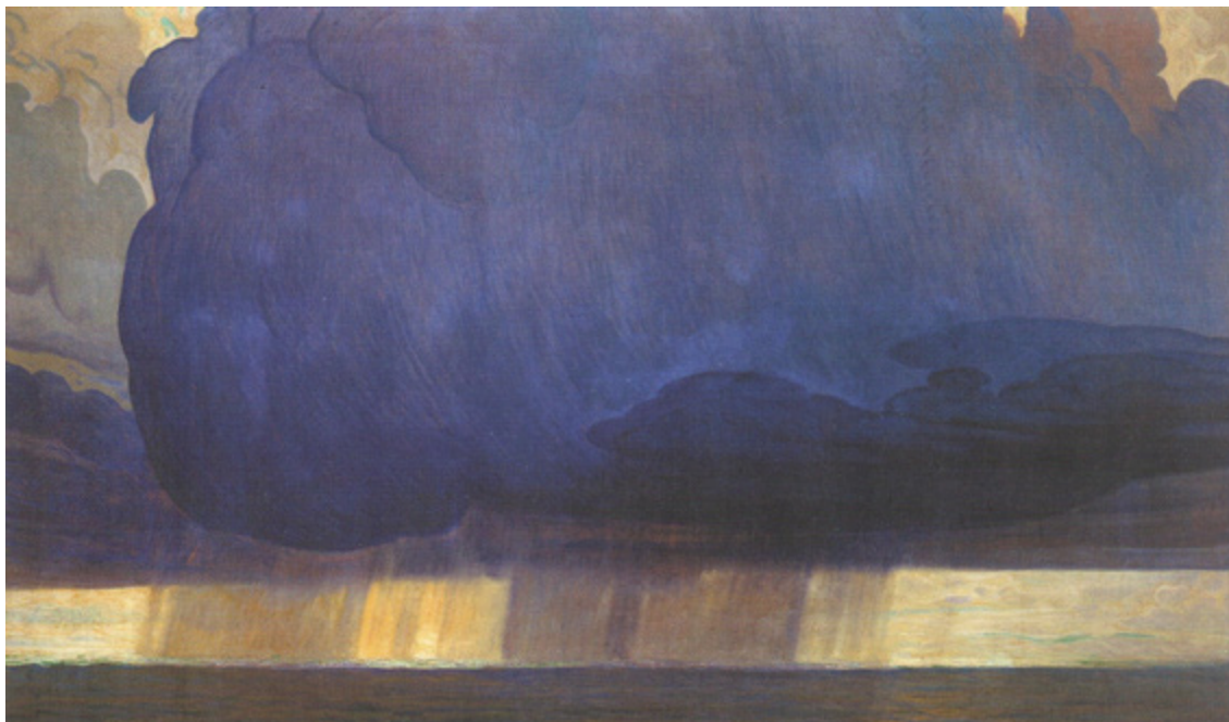
Ил. 15. Галилео Кини. Тифон. 1911. Холст, масло. 118 x 220. Частное собрание. Венеция.