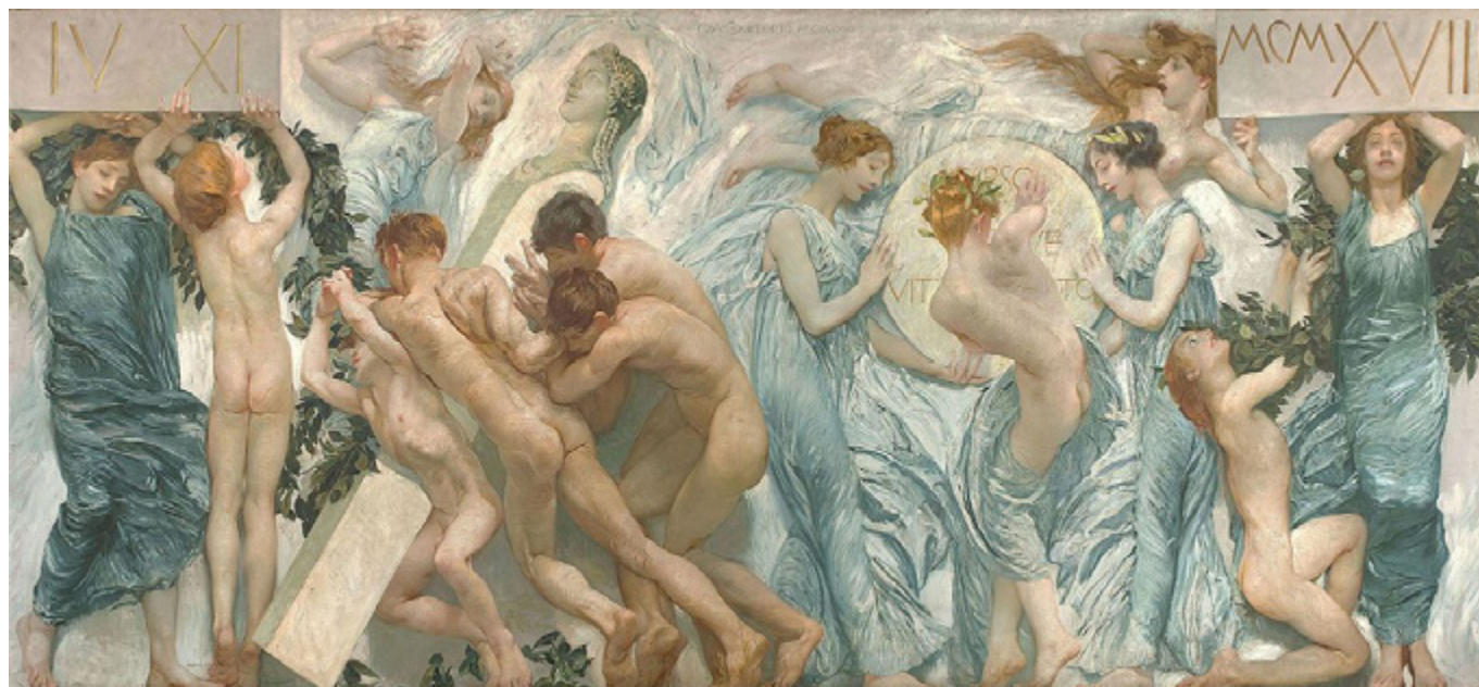
Ил. 11. Джулио Аристид Сарторио. Церемония. 1908–1923. Энкаустика. 178,4 × 396. Галерея Пьяцца Скала. Собрание Фонда Карипло, Милан.