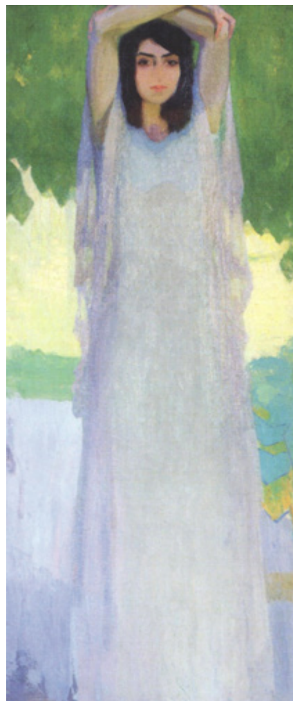
Ил. 14. Амедео Бокки. Безумная. Из триптиха «Сестры». 1916. Холст, масло. 173 × 80. Национальная галерея, Парма.