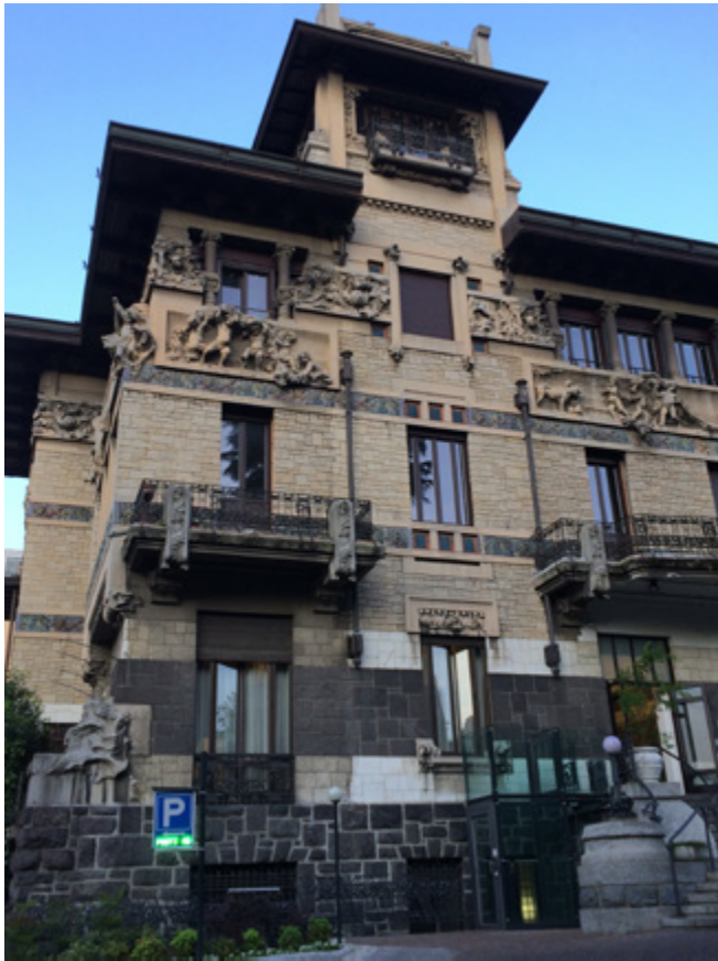
Ил. 4. Вилла Факканони-Ромео. 1912–1913. Архитектор Джузеппе Соммаруга. Милан.