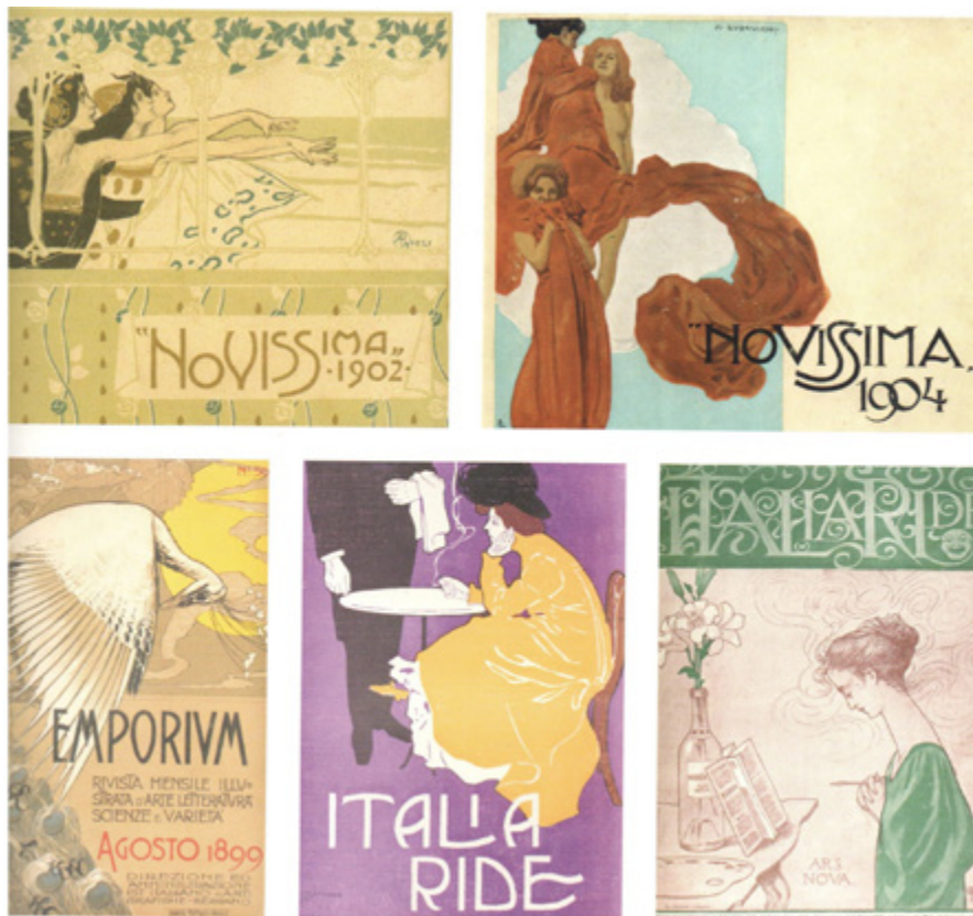
Ил. 2. Обложки журналов «Novissima», «Emporium», «Italia Ride». 1899–1902.