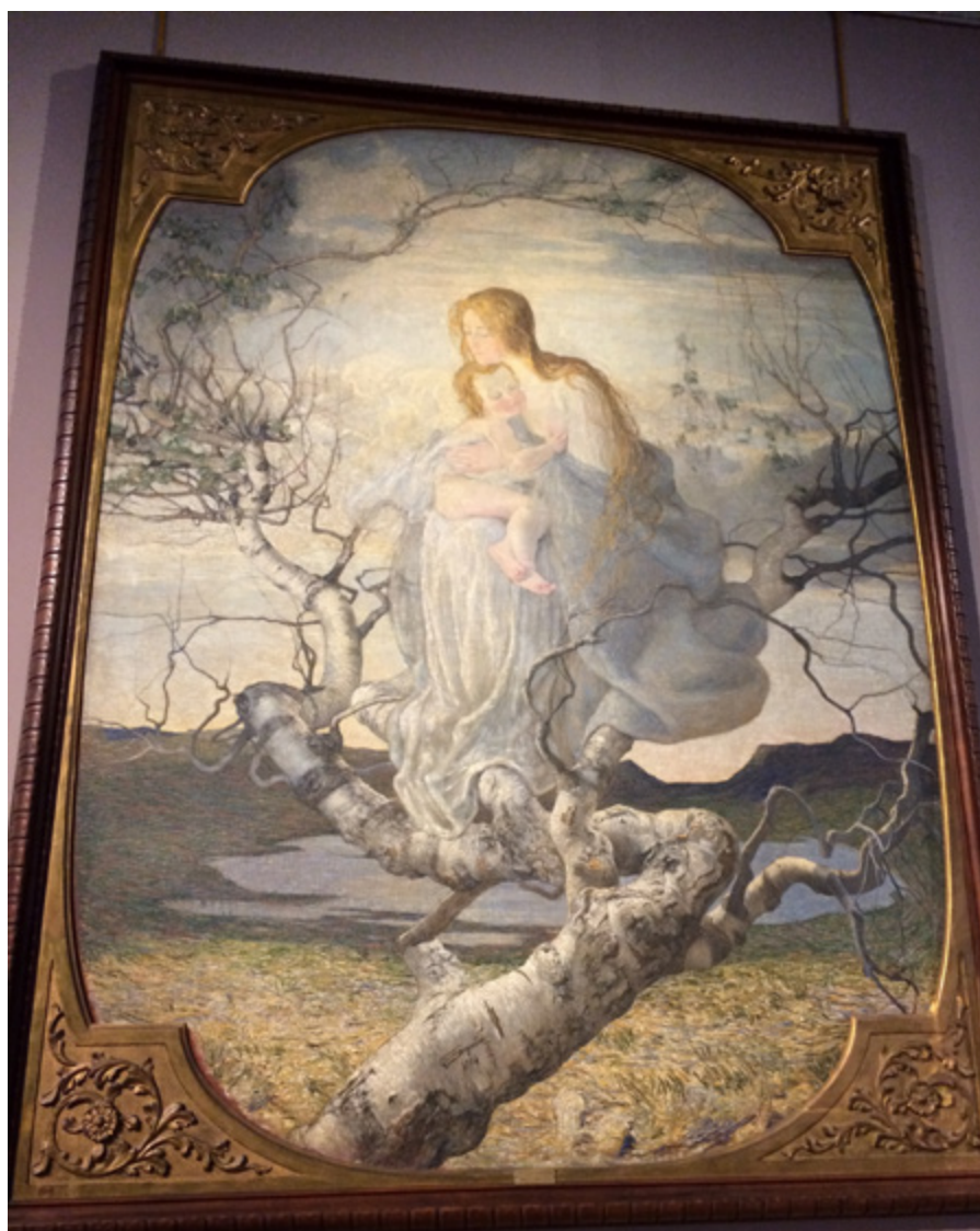
Ил. 9. Джованни Сегантини. Ангел жизни (Христианская богиня). 1894. Холст, масло. 276 × 217. Галерея современного искусства, Милан.