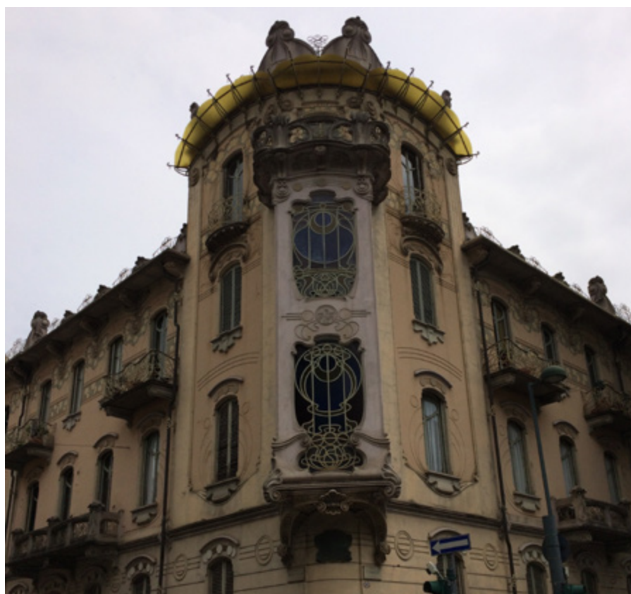
Ил. 3. Дом Ла Флер. 1902. Архитектор Пьетро Фенольо. Турин.