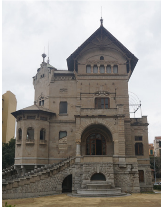
Ил. 5. Особняк Винченцо Флорио. 1899–1903. Архитектор Эрнесто Базиле. Палермо.

приведены точные адреса, с улицами и номерами домов. В то же время одними фактами дело не ограничивается: предлагается концептуально-проблемный анализ творчества итальянских мастеров круга модерна и приводятся отдельные очерки о биографии и произведениях наиболее ярких его представителей. Все эти части составляют единую содержательную структуру книги и расположены последовательно. Иллюстрируют книгу по большей части авторские фотографии, выполненные во время многократных путешествий по различным регионам, музеям и архивам страны. Глубина погружения в материал впечатляет: Н.В. Штольдер многие годы участвует в работе межинститутской группы «Европейский символизм и модерн». Ее увлечение итальянским вариантом стиля началось с посещения выставки «Либерти. Стиль для современной Италии», состоявшейся в 2014 году в городе Форли, где были представлены живопись, скульптура, декоративно-прикладное искусство, мебель, графика, театральные афиши и архитектурные проекты. С этого момента начался роман автора с итальянским модерном.