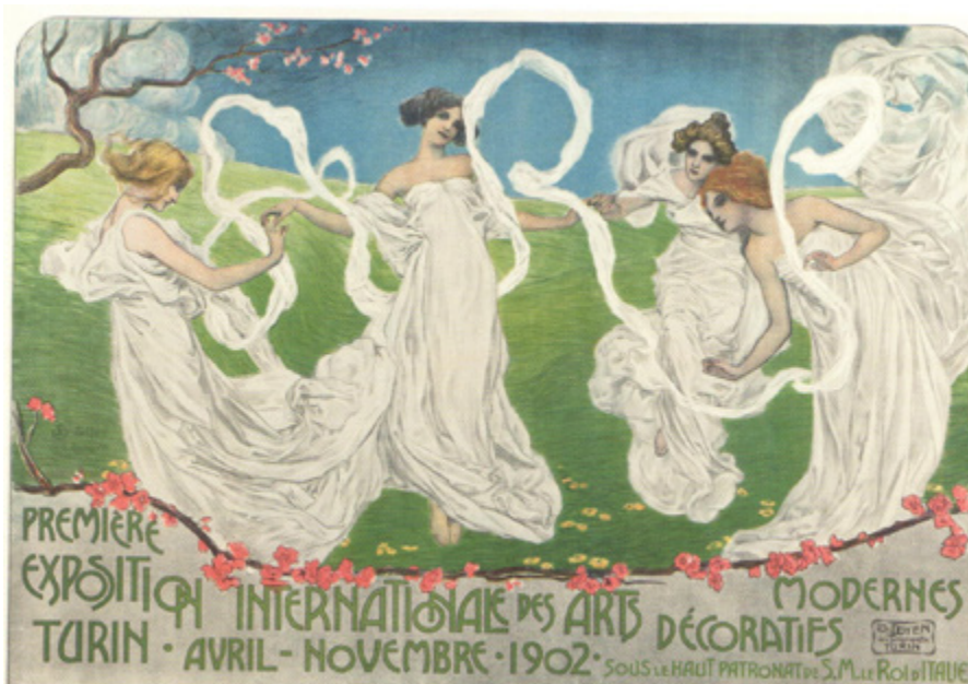
Ил. 1. Леонардо Бистольфи. Афиша Первой Международной выставки современного декоративного искусства. 1902. Литография. 44,5 x 110. Собрание Антонио и Марины Форкино, Турин.

Небольшая по формату книга вместила в себя многое из того, что является, на мой взгляд, прекрасным примером дисциплины научной мысли. Это справочник по произведениям модерна: архитектура, скульптура, живопись, декоративно-прикладное искусство, графический дизайн. Для произведений архитектуры