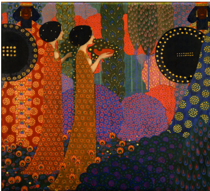
Ил. 12. Витторио Дзеккин. Принцессы и воины. Из цикла «Тысяча и одна ночь». 1914. Холст, масло, позолота. 170 × 188. Международная галерея современного искусства Ка'Пезаро, Венеция.