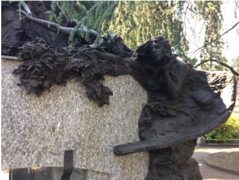
Ил. 6. Маурицио Ведани. Монумент Рибони-Бонелли. Радости и печали. 1907. Фрагмент. №83. Мрамор, бронза. Чимитеро Монументале, Милан.