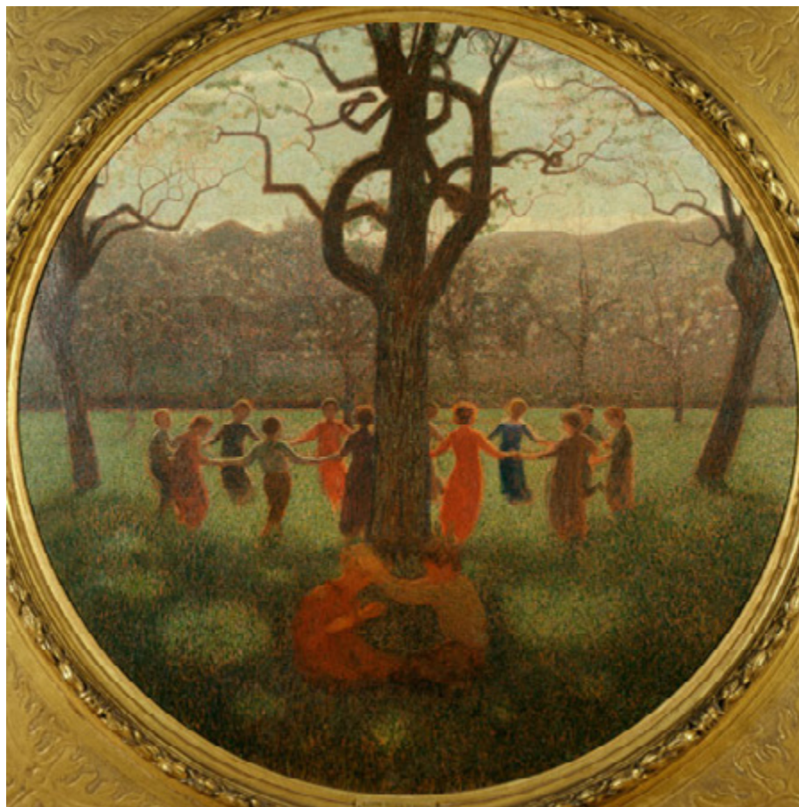
Ил. 10. Джузеппе Пеллицца да Вольпедо. Весенняя идиллия (Хоровод). 1906–1907. Холст, масло. Галерея современного искусства, Милан.