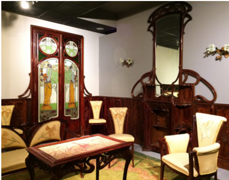
Ил. 17. Луиджи Фонтана. Жилая комната. 1902. Музей Вольфсоняна, Генуя.

на периферии других видов художественного творчества. Как и мебель, и дизайн в целом, итальянская скульптура либерти, разноплановая в жанровом отношении — портреты, монументальная и мемориальная пластика, мифологические темы — представлена целым созвездием имен.