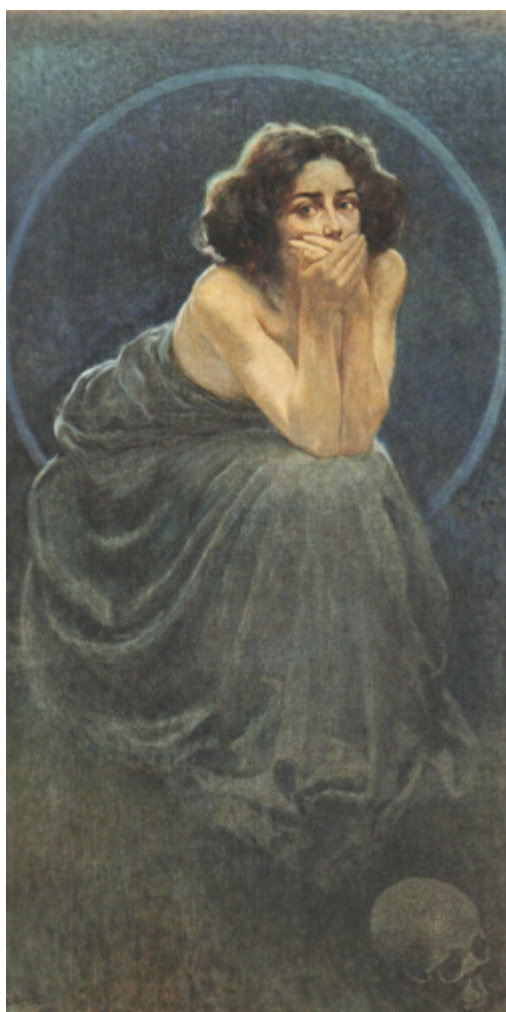
Ил. 13. Джордже Кьенерк. Молчание. Из триптиха «Загадка человека». 1900. Холст, масло. 170,5 × 94. Городской музей, Павия.