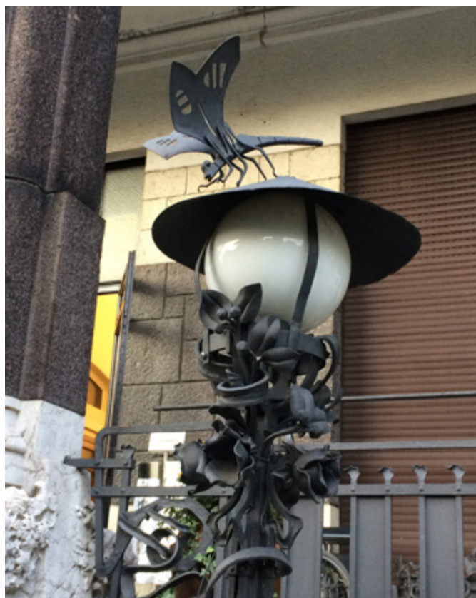
Ил. 16. Алессандро Мадзукотелли. Фрагмент оформления фонарного столба. 1912–1913. Вилла Факканони-Ромео. Милан.

В архитектуре наиболее яркими оказались школы Милана, Палермо и особенно Турина — архитектурной столицы либерти. Одним из основных принципов либерти было органическое встраивание его в ткань сложившейся исторической архитектурной среды города — именно поэтому итальянский архитектурный модерн не очень заметен на улицах городов.