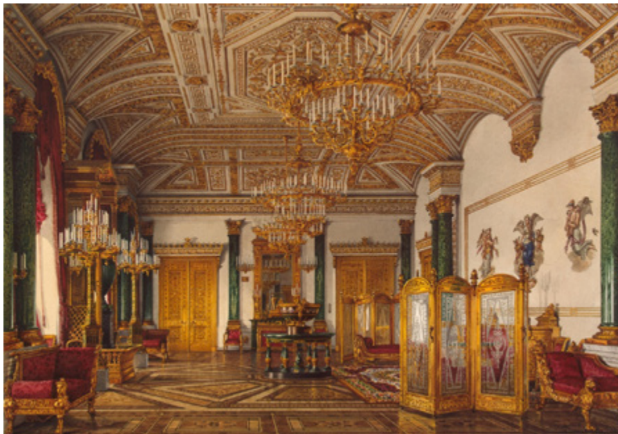
Ил. 2. Ухтомский К.А. Виды залов Зимнего дворца: Малахитовая гостиная. 1865. Бумага, акварель. Государственный Эрмитаж, Санкт-Петербург, Инв. № ОР-14371.

лучших мастеров. К работам в императорской резиденции были привлечены и работники фирмы Трискорни, занимавшиеся в том числе малахитовыми работами в демидовском доме. Болезнь П.Н. Демидова, спешный отъезд на лечение и скорая кончина отложили знакомство публики с первым русским малахитовым залом на десятилетие.