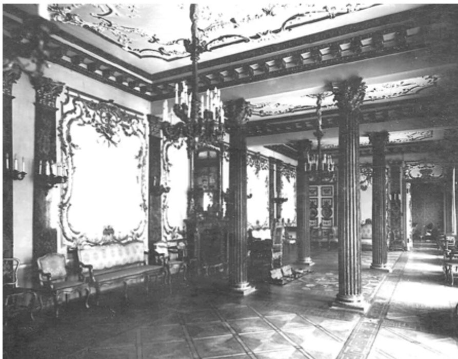
Ил. 1. Малахитовый зал особняка Демидовых на Большой Морской улице. Фото начала XX века.