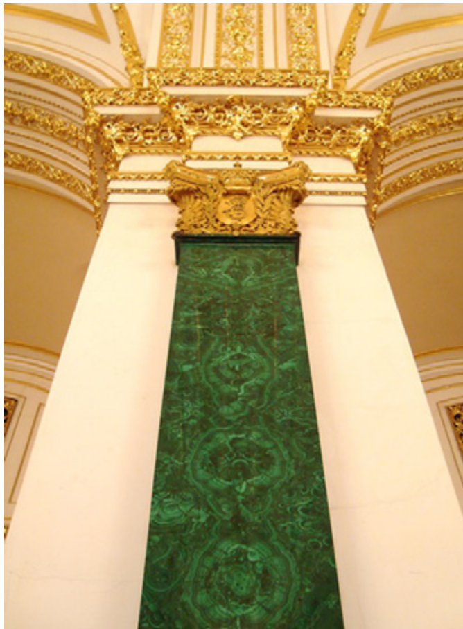
Ил. 8. Пилястра из малахита Демидовых.

Предложенное архитекторами решение свидетельствовало о тонком понимании особенностей малахита разных месторождений и позволяло нивелировать разницу в оттенках минерала и технологии изготовления пилястр. Эффектный рисунок на пилястрах из демидовского камня подчеркнут светом из окон на противоположной стене. Более темный оттенок и большее количество стыков турчаниновского малахита не так бросаются в глаза, поскольку расположены против света. Также различия материалов и технологий маскировало размещение: более качественный материал обрамлял тронное место — церемониальный центр, тогда как менее выразительным деталям отводилось место за спинами дефилирующих придворных.