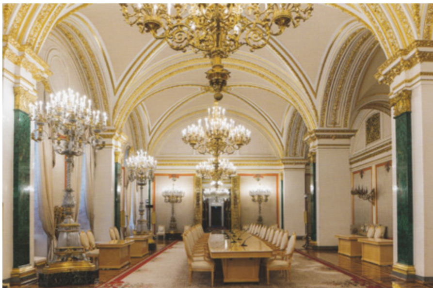
Ил. 4. Екатерининский зал Большого Кремлевского дворца. Современный вид.

трон, и основное пространство зала с наружной стеной, разделенной восемью арочными окнами. На двух центральных пилонах и соответствующих им пилонах-ризалитах в простенках между окнами размещены полноценные пилястры, по углам же зала — половинные (ил. 5). Они акцентируют внимание ярким и глубоким цветом. С внутренней стороны алькова пилястр нет, и, судя по проектному чертежу, они не предполагались (ил. 6).