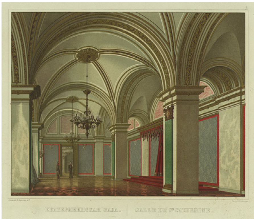
Ил. 3. Екатерининский зал Большого Кремлевского дворца. 1851. Рисовал Н. Черкасов, хромофотография Ф. Дрегер и К°.