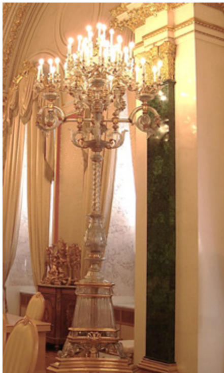
Ил. 7. Пилястра из малахита Турчаниновых. Архив Л.А. Будриной.

Демидовы же поставляли своим клиентам (среди которых были императорские фабрики в Петергофе и Екатеринбурге, а также «Английский магазин» Никольса и Плинке, проводивший масштабные работы в Исаакиевском соборе) крупные блоки плотного камня, на более светлом, «голубоватом» фоне которого четко читался выразительный контрастный рисунок. Отчетливо можно увидеть особенности демидовского камня в большой вазе Медичи Екатеринбургской фабрики на Советской лестнице, крупных малахитовых вазах и столешницах в Большом итальянском просвете Государственного Эрмитажа, а также в колоннах и панелях Исаакиевского собора. Крупные размеры и плотность демидовского камня давали возможность использовать технику фанеровки, плотно стыкуя большие пластины, что позволяло избегать участков брекчеевидной затирки и подчеркивало богатство тона и рисунка природного материала. Это прекрасно отражено в соответствующих пилястрах Екатерининского зала (ил. 8).