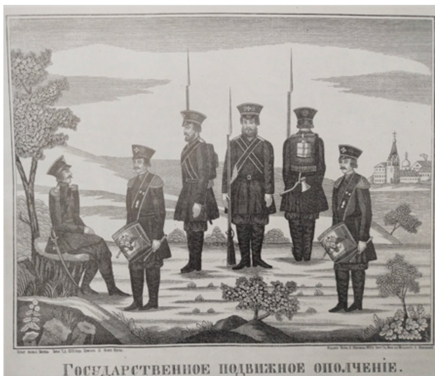
Ил. 7. «Государственное подвижное ополчение», гравюра на металле, бумага, 33 × 42 (26,7 × 32). 1855. Москва. Институт русской литературы (Пушкинский Дом) РАН.