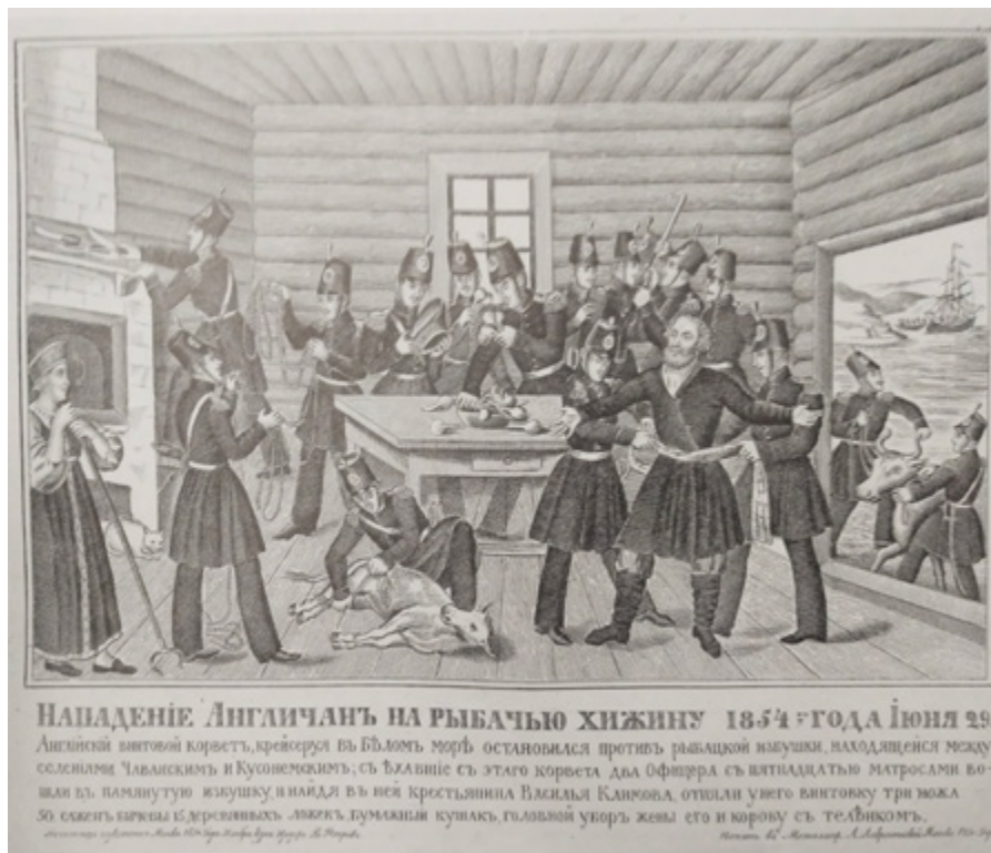
Ил. 3. «Нападение англичан на рыбацкую хижину 29 июня 1854 года», гравюра на металле, бумага, 43,4 × 58,6 (30,5 × 37,2), металлография А. Лаврентьевой. 1854. Москва. Институт русской литературы (Пушкинский Дом) РАН.

человека. Большая часть листа занята изображением боя, разворачивающимся параллельно плоскости листа, подобно действию на сцене. Стены Севастополя, изображенные в углу листа, еще раз напоминают зрителю о географии сражения.