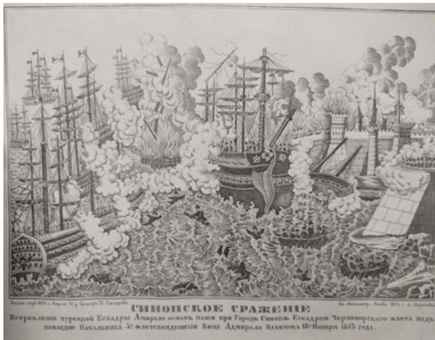
Ил. 5. «Синопское сражение», гравюра на металле, бумага, 33 × 42 (26 × 36), металлография А. Шераповой. 1854. Москва. Институт русской литературы (Пушкинский Дом) РАН.

гравюре, характерной для Европы середины XIX века. Печатаются и «песенные» лубки, в которых изображение иллюстрирует размещенный под ним текст песни. Выходили песенные лубки, посвященные прощанию с отбывающим на фронт солдатом, и листы по мотивам казачьих песен.