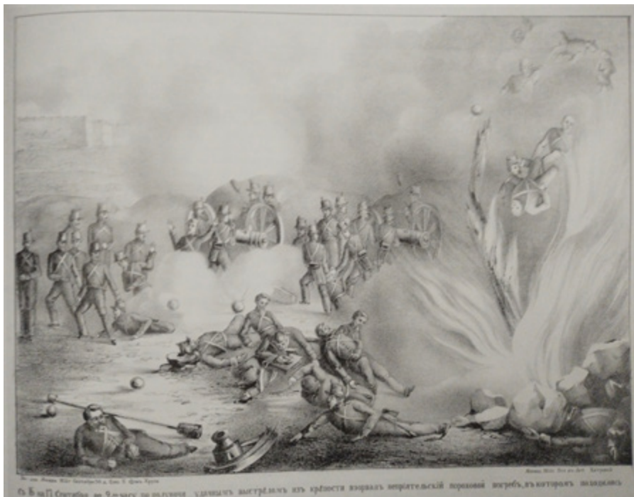
Ил. 4. «Взрыв порохового погреба 17 сентября 1854 года», литография, бумага, 44,2 × 59 (35,7 × 46), литография Хитровой, издание А. Г. Кузнецова. 1854. Москва. Институт русской литературы (Пушкинский Дом) РАН.

преимущественно точкой, а не штрихом. Большая часть фона заполнена дымом от взрывов, и лишь в левом верхнем углу проглядывает фрагмент крепости. В батальном лубке смерть противника демонстрировалась и ранее, например, в период Отечественной войны 1812 года, однако теперь она показана приближенно к реальности — пугающей и мучительной.