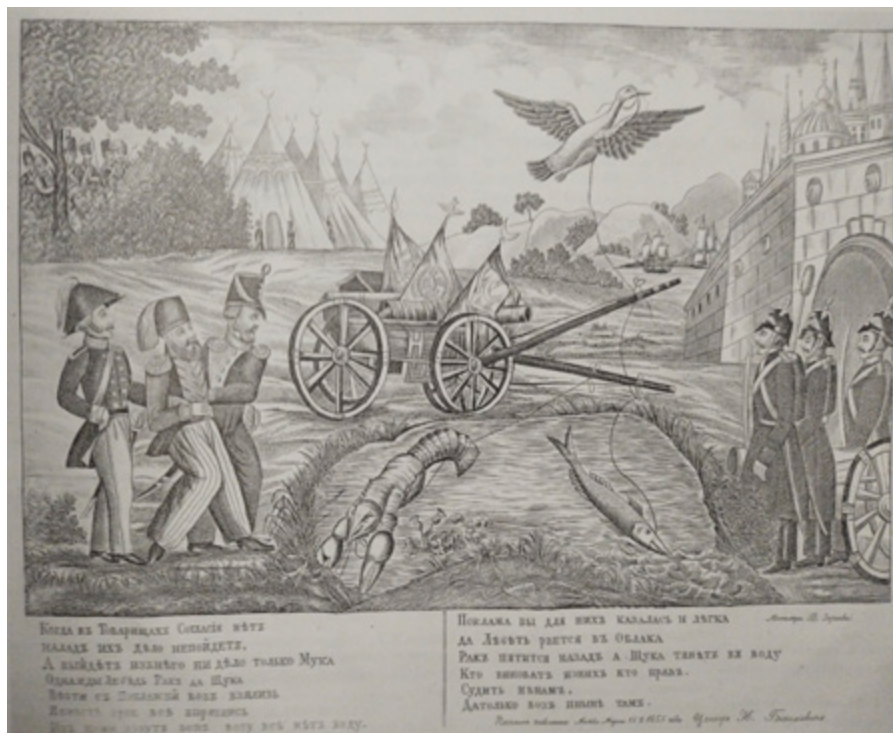
Ил. 8. «Лебедь, щука и рак», гравюра на металле, бумага, 33 × 42 (28,4 × 35,3), металлография В. Зернова. 1855. Москва. Институт русской литературы (Пушкинский Дом) РАН.

лист «Государственное подвижное ополчение» 1855 года (ил. 7). Подвижное ополчение, состоявшее из мужчин до 43 лет, не числившихся в постоянных войсках, и содержавшееся помещиками и общинами, было в период Крымской войны достаточно многочисленным. Листы с формой рассказывали больше о видах полков, а также могли играть роль справочника для человека, читающего репортажный лубок.