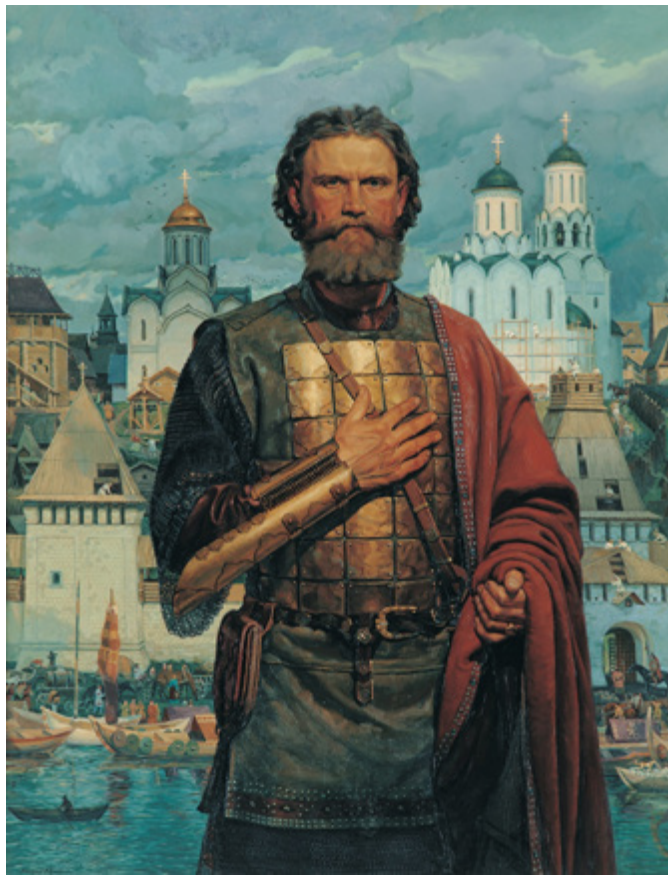
Ил. 3. В.В. Маторин. Святой благоверный великий московский князь Дмитрий Донской. 2002. Холст, масло. 166 × 130. Государственный военно-исторический и природный музей-заповедник «Куликово поле», Тульская область, ГМЗ-КП-1525/1.

искусстве. После всего, что было сделано, молодой художник вдруг смело заявил, что герой все еще не разгадан. На картине бунтовщик на эшафоте с опущенной головой и закрытым от зрителя лицом. Последние слова покаяния обращены к народу «Прости, народ православный; отпусти мне, в чем я согрубил перед тобой...», но они тонут в сером тумане московского утра. На картине три главных действующих лица: глашатай, палач и бунтарь. За ними сакральное пространство власти — панорама Кремля, а внизу — пространство социального безразличия. Картина звучит: шепот людей, слова чиновника, оглашающего смертный приговор, прощание измученного бунтовщика. Подлинный герой картины — это время, в данном случае время царствования Екатерины II, присвоившее всем участникам событий их исторические роли.