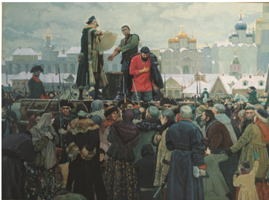
Ил. 2. В.В. Маторин. Казнь Пугачева. «Прости, народ православный». 2000. Холст, масло. 221 × 300. Музей Российской академии живописи, ваяния и зодчества Ильи Глазунова, Москва.