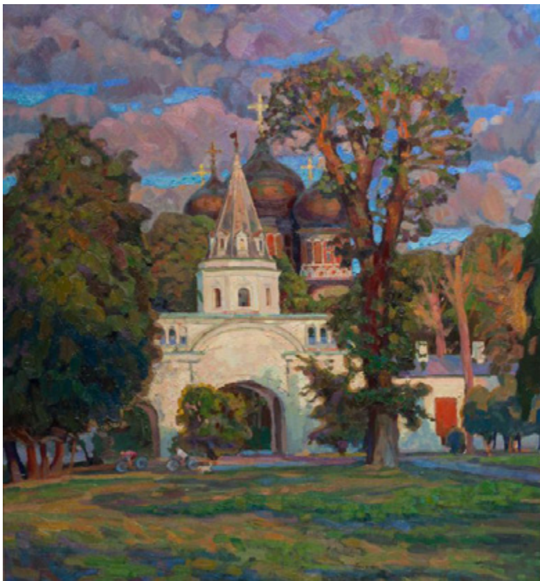
Ил. 6. В.В. Маторин. Последний луч. 2013. Холст, масло. 80 × 73,5. Московский государственный объединенный музей-заповедник «Коломенское-Измайлово», Москва, МГОМЗ КП-19765.

интервью, что посвятил полотну прошлым и нынешним священнослужителям храма на Измайловском острове. В работе нашло свое выражение сложное восприятие современным человеком православной культуры с ее высокими идеалами христианской жизни. Название картины, по словам художника, было подсказано ему ребенком, нашедшим на полотне знакомого героя мультфильма — белую ворону.