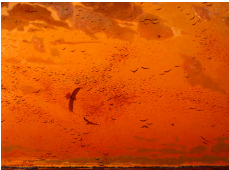
Ил. 5. В.В. Маторин. Задонщина. 2013. Холст, масло. 150 × 200. Государственный военно-исторический и природный музей-заповедник «Куликово поле», Тульская область, ГМЗ-КП-1588/2.

заливает все пространство алыми красками, на небе выделяются только степные птицы. «Задонщина» — произведение древнерусской литературы XIV века; созданное вскоре после битвы, оно стало выражением душевного состояния ее современников. Это песнь славы и одновременно плач по погибшим. В «Задонщине» В.В. Маторина нет героя, это всецело стихия, вобравшая в себя очень многое.