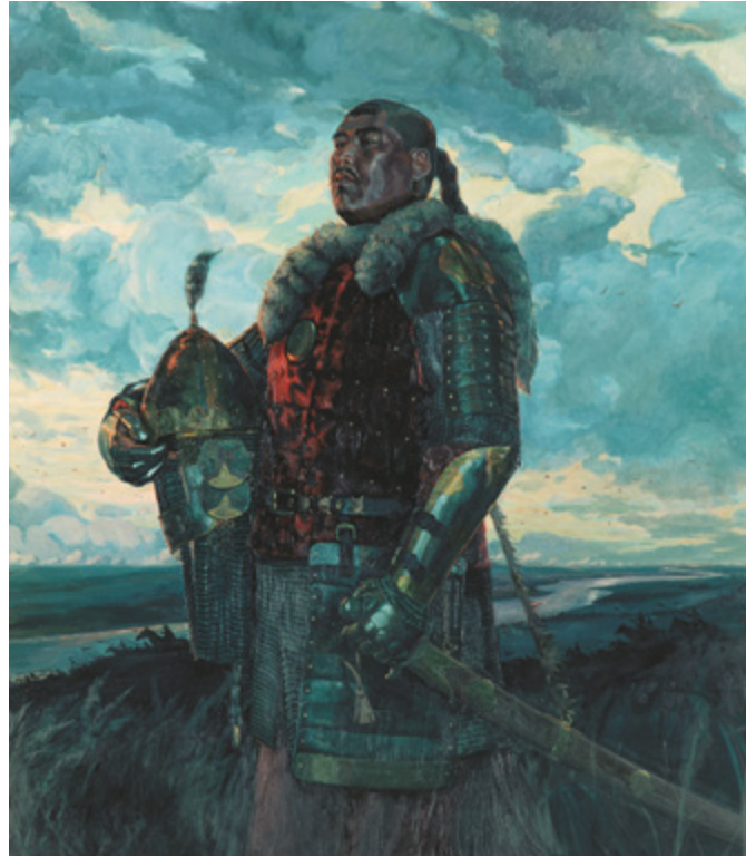
Ил. 4. В.В. Маторин. Хан Мамай. 2004. Холст, масло. 180 × 156. Государственный военно-исторический и природный музей-заповедник «Куликово поле», Тульская область, ГМЗ-КП-1525/3.

победителя и покровителя мирного труда. Художник вспоминал о работе над портретом: «...у меня родился образ сильного, мудрого, великого человека, героя-защитника, героя-строителя. Моя работа — не икона, но и не просто портрет» [Погодин 2006, с. 121].