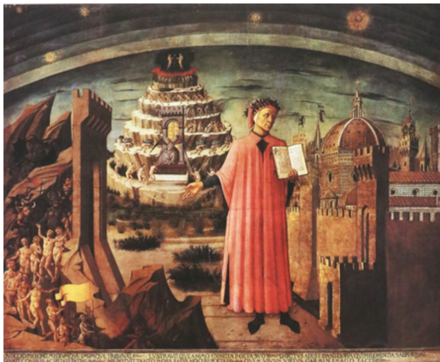
Ил. 1. Доменико ди Микелино. Данте. Фреска. 1465. Санта Мария дель Фьоре, Флоренция.

приведенную в порядок душу светом естественной философии, чтобы затем совершенствовать ее познанием божественных вещей» 4 .