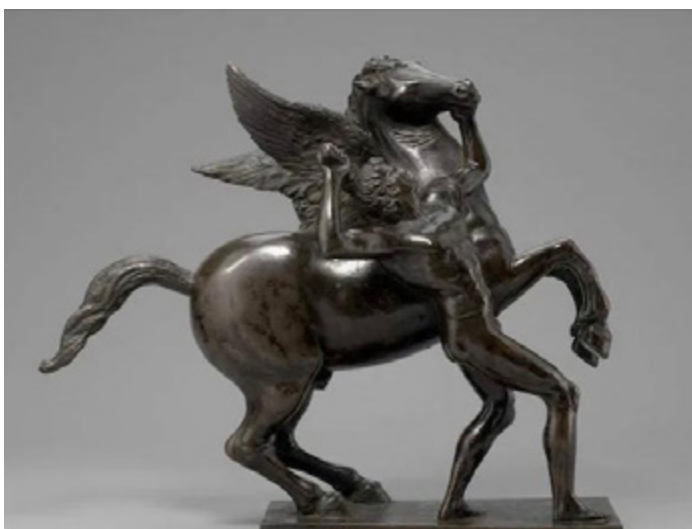
Ил. 8. Бертольдо ди Джованни. Беллерофонт и Пегас. Мрамор. Ок. 1480–1482. Музей истории искусства, Вена.