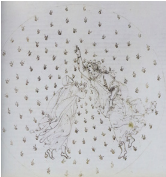
Ил. 4. Сандро Боттичелли. Иллюстрация к «Божественной комедии». «Рай», VI. Бумага, металлический штифт, перо, чернила. Гравюрный кабинет, Государственные музеи, Берлин.