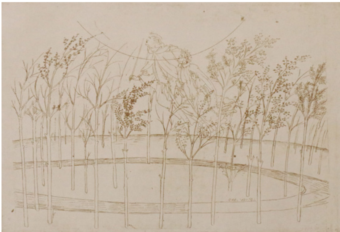
Ил. 3. Сандро Боттичелли. Иллюстрация к «Божественной комедии». «Рай», I. Бумага, металлический штифт, перо, чернила. Гравюрный кабинет, Государственные музеи, Берлин.

последних десятилетий XV века. Своеобразный «психологизм» образа кажется родственным неоплатоновскому, ибо платоновское понятие «поэт» — многогранно, оно содержит в себе мысли о вдохновенном творчестве, торжествующем над хаосом материального; о проникновении в структуру вселенной; о беспокойстве души, рвущейся из плена земной видимости к духовному созерцанию 10 .