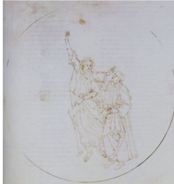
Ил. 5. Сандро Боттичелли. Иллюстрация к «Божественной комедии». «Рай», X. Бумага, металлический штифт, перо, чернила. Гравюрный кабинет, Государственные музеи Берлина.

Традиция изображения Данте образцом духовного величия, отмеченного чертами неоплатонического идеала, заметна и в его портрете, приписываемом Сандро Боттичелли (Колоньи, Женева, Фонд Мартина Бодмера) 12 . Считается, что портрет был исполнен около 1495 года по заказу Лоренцо ди Пьерфранческо Медичи в то время, когда художник работал над иллюстрированием для него «Божественной комедии» (1492–1498). Облик поэта как бы в параллель медальерному, героизирующему искусству передан предельно сжатым языком — характерной выразительностью профиля в лавровом венке, но в нюансах обрисовывающей его линии прочитывается представление о творце, наделенном исключительной глубиной мысли и силой внутреннего видения.