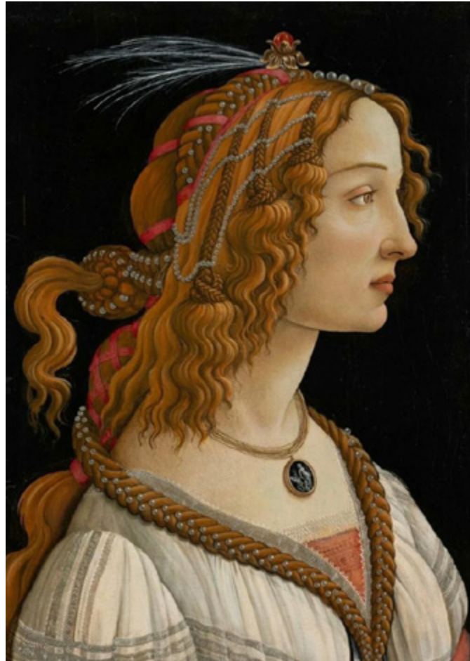
Ил. 10. Сандро Боттичелли. Портрет молодой женщины. Холст, темпера. 1480–1485. Художественный институт Штеделя, Франкфурт-на-Майне.

«Запряженной колесницей Платон именуется дух, отдающийся божественному в глубине человеческой души, единство души есть возница, разум <...> — добрый конь, смятенное воображение и чувственные вожделения — дурной, а вся душа в целом — сама колесница... Он изобразил ее крылатой...» 16 . Преодолев метания в сторону страстей и желаний, душа человека обращается к истинному порядку вещей и на этом пути достигает своего высшего призвания.