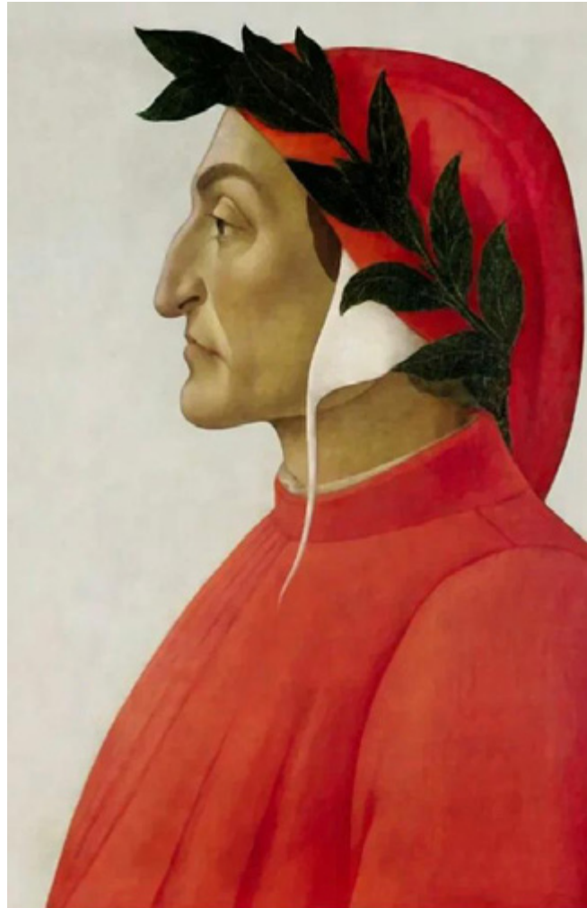
Ил. 2. Сандро Боттичелли. Данте. Дерево, темпера. Ок. 1495. Фонд Мартина Бодмера, Колоньи, Женева.

Флоренции, Ада, Чистилища и небес в виде сфер и знаков планет. В этом развернутом «сценарии» проводится мысль о Данте — флорентийце, славном гражданине своей Родины, на что указывает изображение Флоренции, мотив имеет также религиозный подтекст: крест Собора, главного здания города, находится на одной линии с Солнцем — символом божественного. Данте, в соответствии с концепцией росписи, творец, движимый возвышенной любовью, ибо звезда Венеры светит над ним. И он — мыслитель, поднявшийся до вершины знания, которая ассоциируется с высшими сферами, с теологией — от книги в руке Данте исходят лучи. Образ Данте — поэта, теолога и гражданина — соотносится во фреске еще со средневековой оценкой, но вместе с тем обращен и в сторону нового, гуманистического подхода, его творческая личность представляет неоплатонический тип творца.