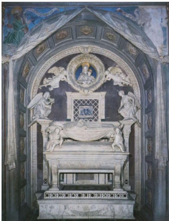
Ил. 6. Антонио Росселлино. Надгробный памятник кардиналу Иакову Португальскому. 1461–1466. Сан Миньято аль Монте, Флоренция. Общий вид.

расширяются знания об античности, в том числе об античном погребальном декоре. Гробница кардинала имеет стройную конструкцию и украшена с настоящим великолепием. Белый каррарский мрамор сочетается в ней с цветными породами камня, и от постамента с гирляндой славы вокруг, саркофага и катафалка, до верхней части, где торжественно раздвинут мраморный занавес над видением Мадонны с несущими ее медальон ангелами, рельефные мотивы покрывают поверхность поперечного пояса спереди памятника, по бокам его постамента и на боковых пилястрах. Здесь собран обширный траурный репертуар древнеримских мотивов: зажженные светильники, крылатые гении, рога изобилия, сфинксы, гирлянды. Тему чистоты символизируют единороги, стоящие напротив друг друга. Пальма, как и сцена тавромахии, обозначают победу усопшего над страстями; эта сцена могла «говорить» о духовном подвиге, намекая и на миф о Геракле и Критском быке 14 . Крылатый гений на колеснице, включенный в эту систему образов, указывал на стремление души ввысь. В надгробии кардинала Португальского героизация в ее гуманистическом понимании, отмеченном идеями последних десятилетий Кватроченто, акцентирована всем арсеналом смысловых значений, выражающих апофеоз душевной чистоты и вознесения души к высшему блаженству.