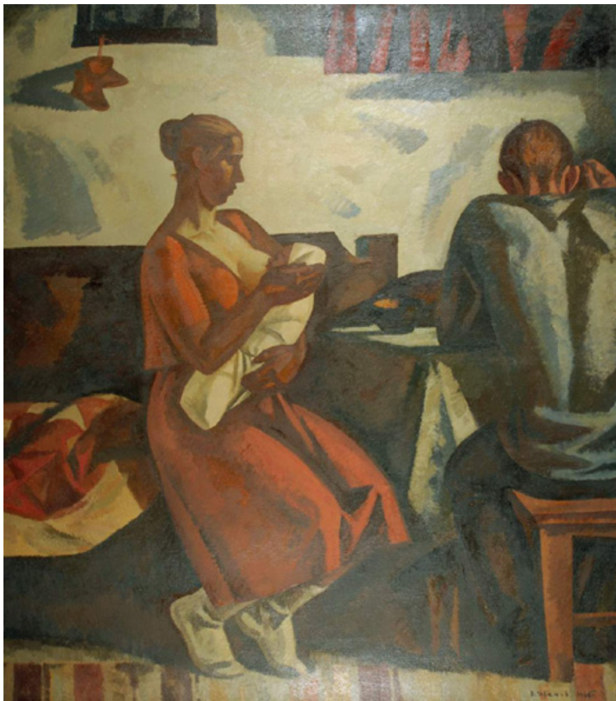
Ил. 5. В.И. Иванов. Человек родился. 1969. Холст, масло. Государственная Третьяковская галерея. Москва.

собственных мыслей, Крамской как никто понимал архитектуру процесса преобразования «художника-человека» в «художника-гражданина» и отводил этому важную роль не только в эволюции конкретной личности, но и в развитии всей культуры эпохи. Не будет преувеличением сказать, что для второй половины XX века в отечественном искусстве воплощением такого типа творца стал В.И. Иванов. Его наследие, как живописное, так и литературное, является своеобразным продолжением традиций русской культуры века девятнадцатого с их с их человекоцентричностью, ориентацией на нравственные смыслы и исключительным значением самосознания общества, но уже на следующем этапе. В подтверждение этому тезису можно привести и столь близкие сердцу Виктора Ивановича слова его соратника по «суровому стилю» Г.М. Коржева: «В творчестве Иванова гармонично сочетаются такие явления, как традиционность и новаторство, современность и извечные начала, он — следующее звено русской живописной школы» [Иванов, 2016, с. 32].