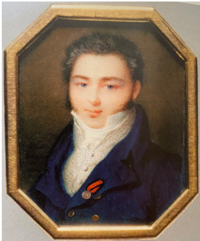
Ил. 3. Портрет неизвестного с «дворянской» медалью. 1816. Кость, акварель, Sepherot Foundation, Лихтенштейн.

сохранила свою оригинальную золоченую бронзовую раму. Григорьев создает очень лаконичный и четкий портрет Аракчеева, синеватый подтон делает лицо государственного деятеля несколько уставшим, осунувшимся, но чрезвычайно характерным. В какой коллекции сейчас находится миниатюра — неизвестно (ил. 2).