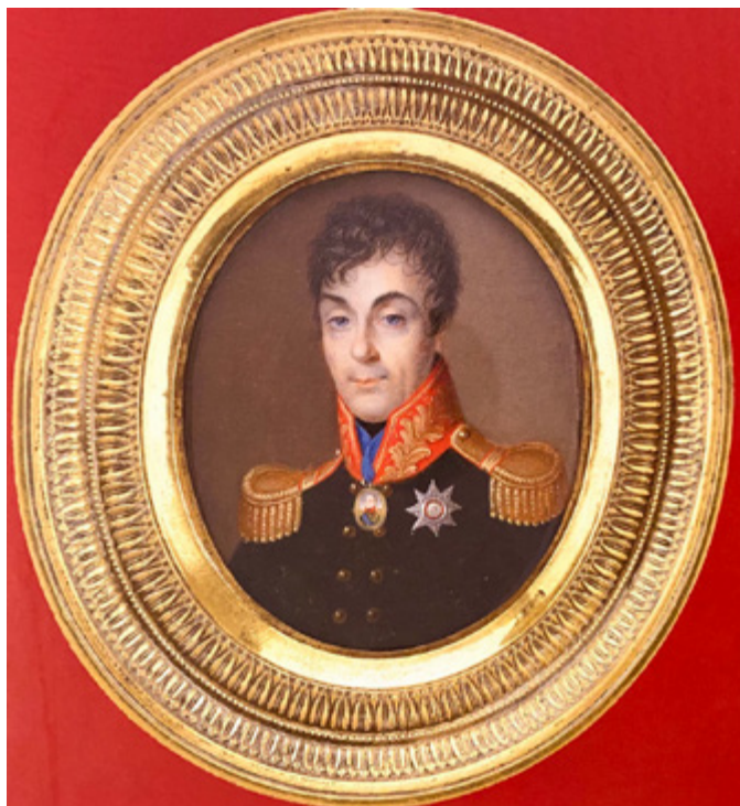
Ил. 2. Иван Григорьев. Портрет А. А. Аракчеева. 1800-е. Кость, акварель. Частное собрание.

Сестренцевича-Богуша, первого архиепископа Могилевского и президента Вольного экономического общества [Сборник 1865, с. 188, 194]. Местонахождение произведения неизвестно, но портрет был опубликован среди других в пятитомном труде великого князя Николая Михайловича [Русские портреты 2003, с. 128] (ил. 1).