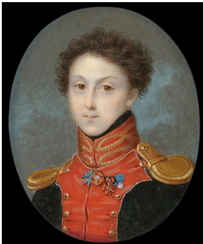
Ил. 5. Иван Григорьев. Портрет В.А. Бибикова. 1816. Boris Wilnitsky Fine Arts, Вена.

отличия. Эта миниатюра подтверждает, что Григорьев был близок с семьей Кутузова. Известно, что он написал портрет самого Михаила Илларионовича, его дочери Д.М. Опочининой, его внуки Е.Ф. Тизенгаузен, М.Ф. Толстого (зятя М.И. Кутузова).