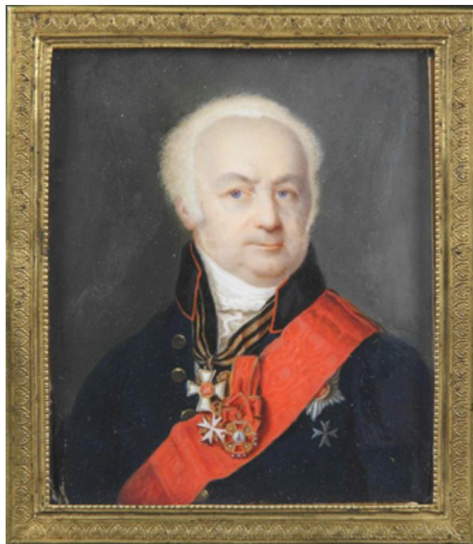
Ил. 8. Иван Григорьев. Портрет Л. М. Яшвиля. 1832–1833. Ярославский художественный музей, А-1284.

художеств, получал постоянные заказы от прославленной русской аристократической фамилии, свидетельствует о высокой оценке его творчества. Биография и творческое наследие Ивана Григорьева дают достаточно информации для того, чтобы рассматривать этого художника как яркого представителя самобытной, формирующей подлинную творческую индивидуальность авторов, русской школы миниатюры.