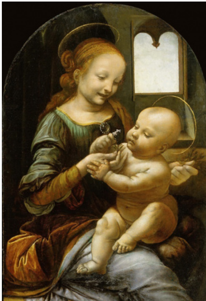
Ил. 2. Леонардо да Винчи. Мадонна Бенуа. Около 1478–1479. Государственный Эрмитаж, Санкт-Петербург.

умею отбояриваться, только посредством взглядов и жестов» 9 . Проведя две ночи в поезде, с остановками в пограничных городках Модан в Савойе и Бардонеккья в Пьемонте 10 , они приехали в главный город их путешествия — Рим. За первые дни они успели посмотреть правобережную часть города с собором святого Петра, в котором Е.Е. Лансере поразили масштаб, великолепие, но и толпы разнообразной публики: «Вчера мы прониклись его громадностью; просто чудовищно велик, и в желтых лучах заката, в синей мгле внизу, с горящими золотыми потолками, в неумолчном шуме громадной но теряющейся совершенно в этой громаде гуляющей толпы и с дальним пением службы — он великолепен» 11 .