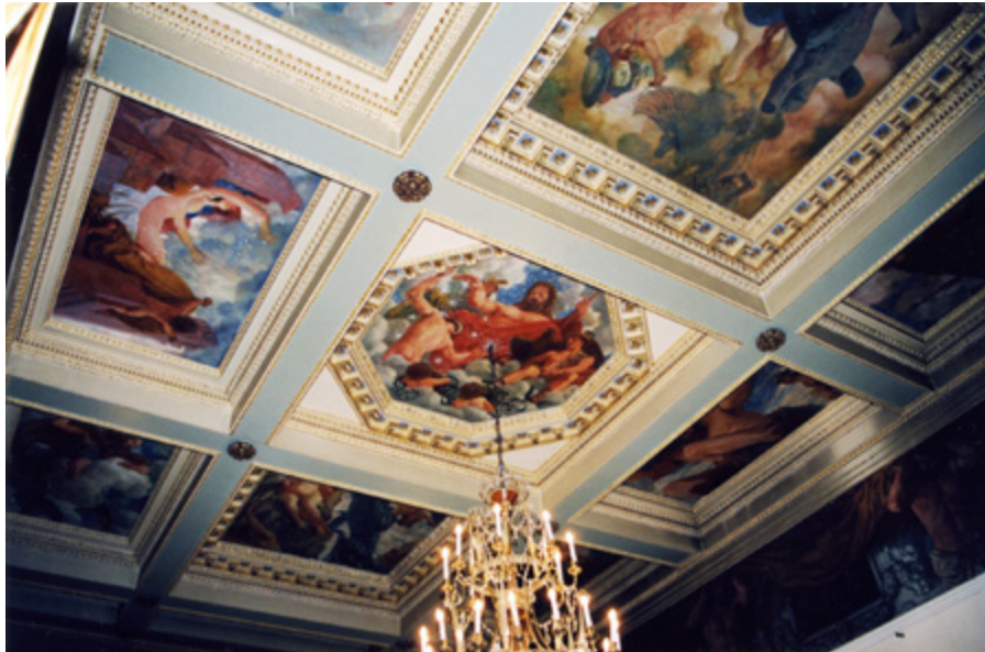
Ил. 9. Е. Е. Лансере. Роспись Белого зала особняка Г. А. Тарасова в Москве. 1910–1911. 2003.

Первоначально художник создал эскизы шести продолговатых восьмиугольных декоративных панно для простенков окон и трафареты растительного орнамента, который должен был украсить бортики по углам комнаты и рядом с окнами и дверью 37 . С 1910 года художник перерабатывал панно 38 , после чего в апреле 1911 года посетил Новый Кучук-Кой, чтобы на месте их подправить и установить 39 .