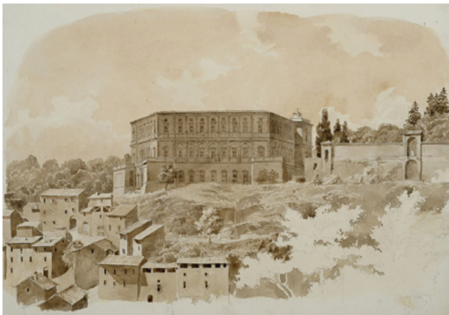
Ил. 1. Н. Л. Бенуа. Капрарола. 1840-е годы. Российская национальная библиотека, Москва.

своего дяди. Однако Александр Бенуа опережал своего племянника по восприятию живописи итальянского Ренессанса (от Джотто до Тинторетто).