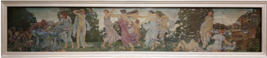
Ил. 7. Е. Е. Лансере. Сумерки. Танцующие нимфы и фавны. Эскиз панно для зала ресторана Большой Московской гостиницы. 1906. Государственный Русский музей, Санкт-Петербург.

палладианства находило в известной мере сочувствие и у Лансере» [Подобедова 1961, с. 305].