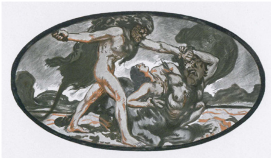
Ил. 10. Е.Е. Лансере. Похищение Деяниры. Эскиз росписи плафона столовой особняка Е. П. и В. В. Носовых в Москве. 1911. Одесский национальный художественный музей. Репродукция из Ежегодника общества архитекторов-художников. 1913.

были расположены надписи, относящиеся к частям верхнего плафона: «Minerva Perseam Protectrissa», «Andromedam Liberat Perseus» и другие.