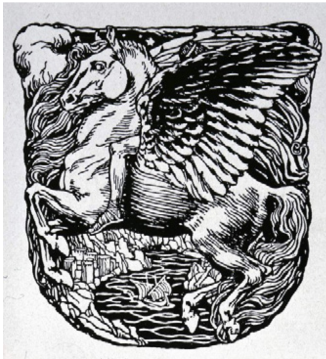
Ил. 3. Е. Е. Лансере. Пегас. Концовка первого раздела журнала «Мир искусства». 1900. Цинкография. Частное собрание.

Евгений Лансере вместе с Анной Остроумовой вернулся на поезде из Парижа в Санкт-Петербург, где начался новый петербургский период его творчества. Вскоре по рисунку Евгения художница награвировала ксилографию «Колесница Аполлона» (25×23 см) для обложки нереализованного издания историко-литературного журнала «Пантеон», предполагавшегося С.П. Дягилевым. А в 1900-м Евгений создал образ Пегаса для концовки к первому разделу журнала «Мир искусства» (ил. 3).