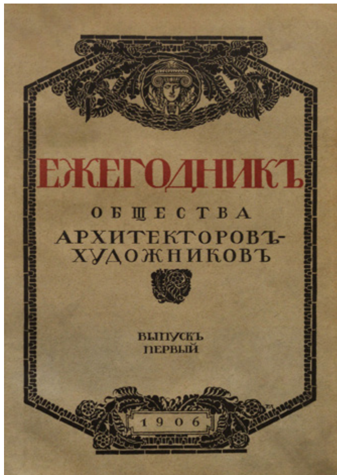
Ил. 6. Е. Е. Лансере. Обложка «Ежегодника Общества архитекторов-художников». 1906.