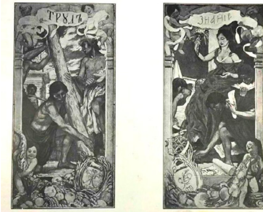
Ил. 8. «Труд» и «Знание». Панно на Главном входе на Международную строительно-художественную выставку в Санкт-Петербурге. 1908.

произвели Джотто, Тинторетто и, как можно предположить, Лука Синьорелли в Орвието и Джулио Романо в Мантуе. Среди важнейших по своим музеям изученных городов — Рим, Флоренция, Сиена, Неаполь. В Ватиканской пинакотеке художник выделил картины Гверчино, но в целом в его пристрастиях доминируют мастера XVI столетия.