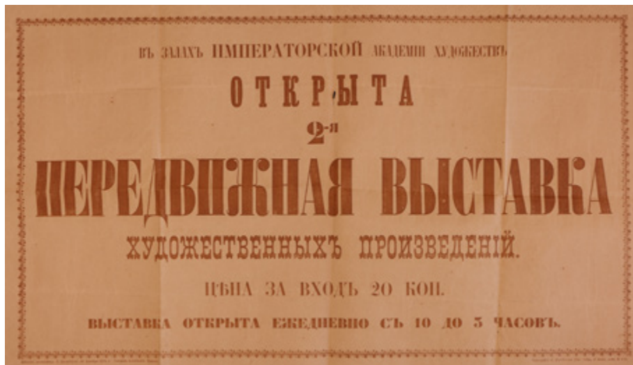
Ил. 1. Афиша 2-й выставки Товарищества передвижных художественных выставок в Петербурге. 1872. Государственная Третьяковская галерея, Москва.

также немного об уставе, структуре объединения, его устройстве и немного о выставочной деятельности ТПХВ [Юденкова 2024, с. 10–22].