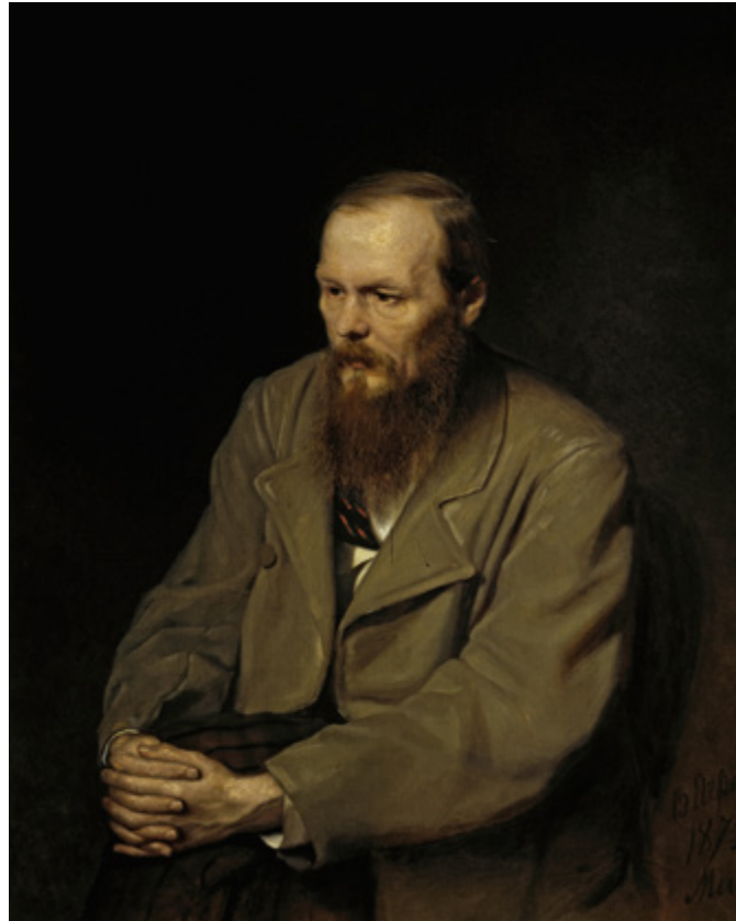
Ил. 6. В.Г. Перов (1833–1882). Портрет Ф.М. Достоевского. 1872. Холст, масло. 99,6 × 81. Государственная Третьяковская галерея, Москва.

бросившей вызов многовековой системе ценностей и нормам поведения. Значение пейзажа вырастает до философского постижения бытия в картине «Над вечным покоем» (1894, ГТГ) И.И. Левитана, в его же масштабном полотне «Владимирка» (1892, ГТГ) для русского зрителя продолжают звучать и социальные ноты.