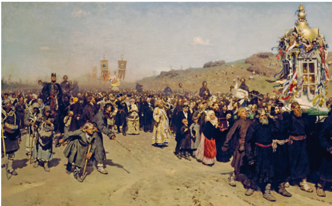
Ил. 8. И. Е. Репин (1844–1930). Крестный ход в Курской губернии. 1881–1883. Холст, масло. 178 × 285,5. Государственная Третьяковская галерея, Москва.

Первые четыре передвижные выставки прошли в залах Академии. С 1876 года (5-й передвижной) возник конфликт-противостояние Товарищества и Академии, столь заостренный советскими критиками. Поводом послужил отказ Академии предоставлять залы, но истинной причиной стала развернувшаяся борьба на рынке и конкуренция за первенство в искусстве и среди публики. Отныне ТПХВ каждый год было вынуждено в Петербурге искать помещения для своих выставок.