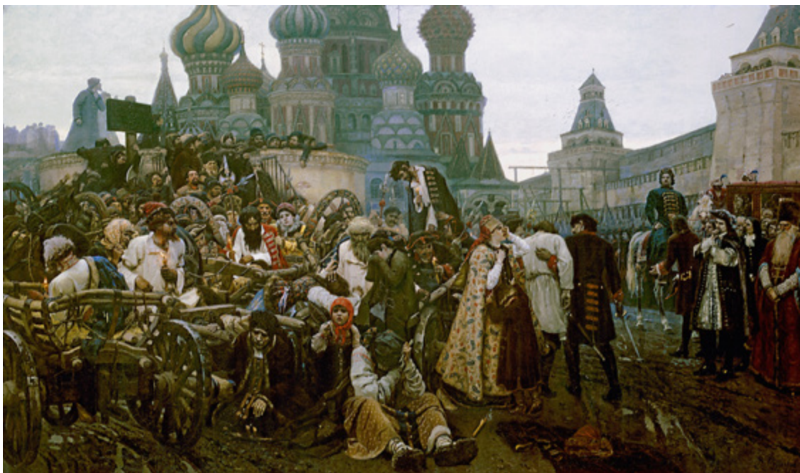
Ил. 9. В. И. Суриков (1848–1916). Утро стрелецкой казни. 1881. Холст, масло. 218 × 379. Государственная Третьяковская галерея, Москва.

«Золотое Руно», в статье «Забутые заветы», возражая против эстетского «отбрасывания» реализма, напоминал: «Идея передвижничества была глубоко национальной в лучшем значении слова, отражая лучшие сокровенные стороны „святая святых“ русской души. Передвижники стремились проникнуть в дух истории и отразить быт, носили в себе Христа как символ нравственных запросов души. <...> Если русское искусство хочет стать нужным <...> оно должно приобщиться той великой душевной глубины, бодрости и веры, которые оставили нам как завет первые учителя передвижничества» [Милиоти 1909, с. VI] (ил. 9).