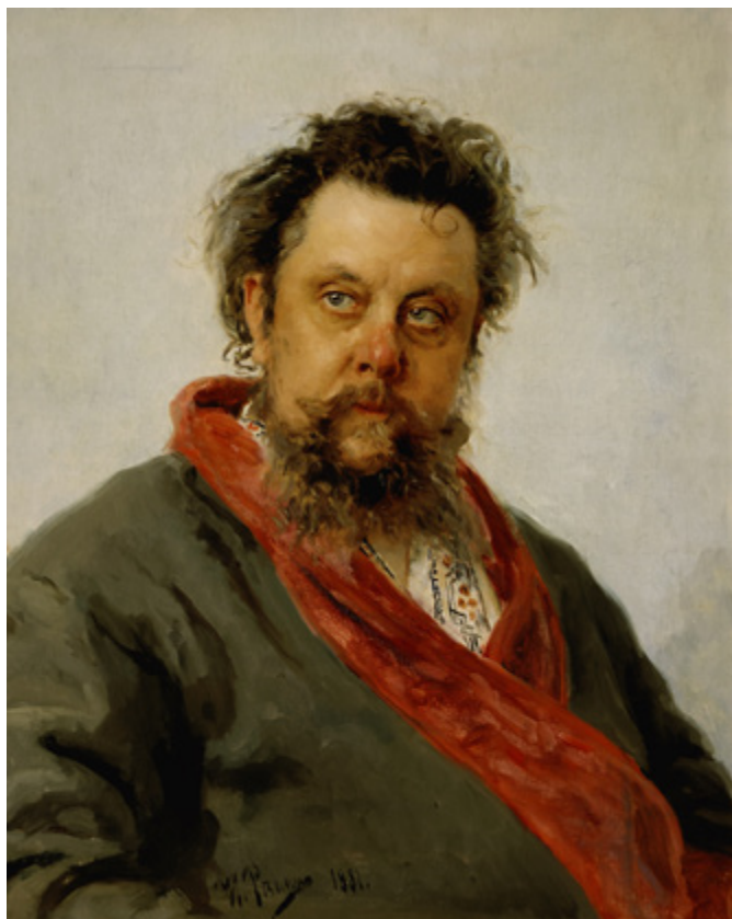
Ил. 11. И. Е. Репин (1844–1930). Портрет М. П. Мусоргского. 1881. Холст, масло. 71,8 × 58,5. Государственная Третьяковская галерея, Москва.