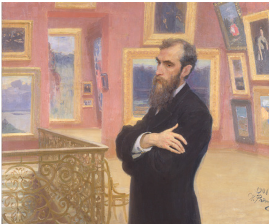
Ил. 4. И.Е. Репин (1844–1930). Портрет П.М. Третьякова. 1901. Холст, масло. 111 × 134. Государственная Третьяковская галерея, Москва.

а только одну часть <...> ...все отрицающий XIX век вместе с тем — эпоха еще небывалого научного и художественного мистицизма, неутомимой потребности новых религиозных идеалов (выделено авт. — прим. Т. Ю.), подготовительной работы еще неясного, но, во всяком случае, не разрушительного, а творческого движения. В этой мучительной борьбе, в глубоком контрасте двух основных начал жизни — характерная черта XIX века» [Мережковский 1991, с. 173, 175].