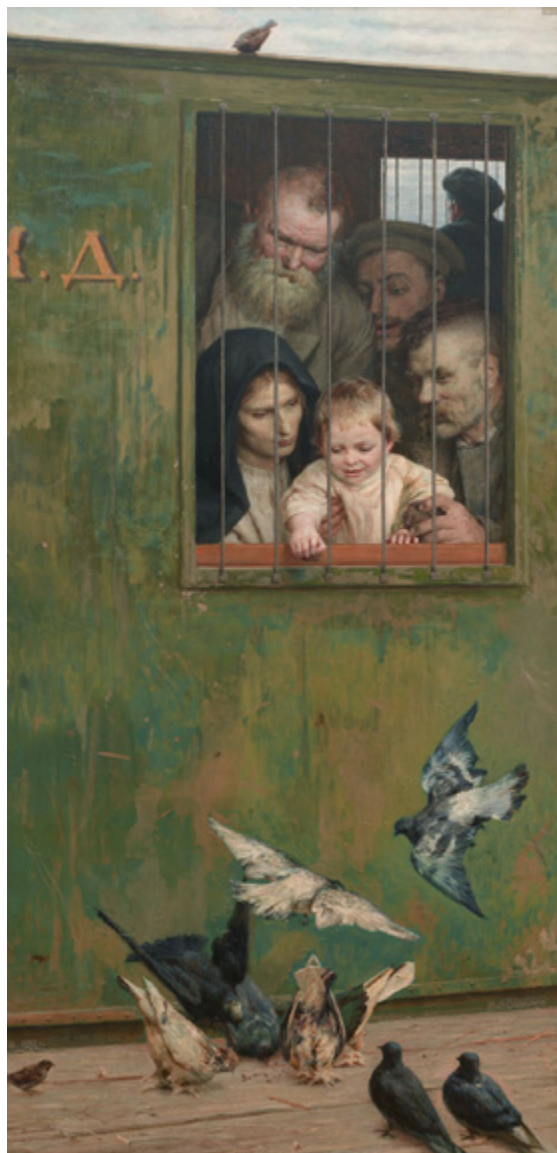
Ил. 7. Н. А. Ярошенко (1846–1898). Всюду жизнь . 1888. Холст, масло. 213,7 × 107,5. Государственная Третьяковская галерея, Москва.

ТПХВ» призваны раскрыть процесс освоения искусством стилистики художественного языка модерна и импрессионизма, первые ростки которого, хотя и с трудом, но появлялись на передвижных выставках. Рождение новой реальности Серебряного века связано с отходом молодых мастеров от системы реалистического мышления. Этому также предшествовал и ряд кризисов внутри ТПХВ.