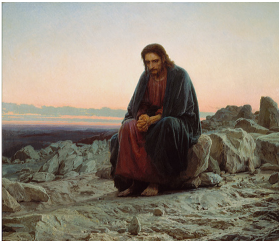
Ил. 5. И.Н. Крамской (1837–1887). Христос в пустыне. 1872. Холст, масло. 184 × 214. Государственная Третьяковская галерея, Москва

будь то живая современность, исторический или евангельский сюжет. Каждое полотно несло в себе разнонаправленные токи, несомненно, порожденные историко-культурным контекстом, иногда и помимо воли автора. Именно в этот период получил распространение ставший характерным тип картины-раздумья, которому внутренне присущи вопросительные интонации, отсутствие однозначных и прямолинейных ответов.