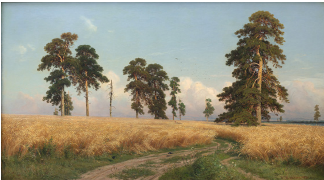
Ил. 10. И. И. Шишкин (1832–1898). Рожь. 1878. Холст, масло. 107,5 × 188. Государственная Третьяковская галерея, Москва.

в массовой культуре XX века посредством производства сувенирной продукции, в том числе и насаждая дурной эстетический вкус.