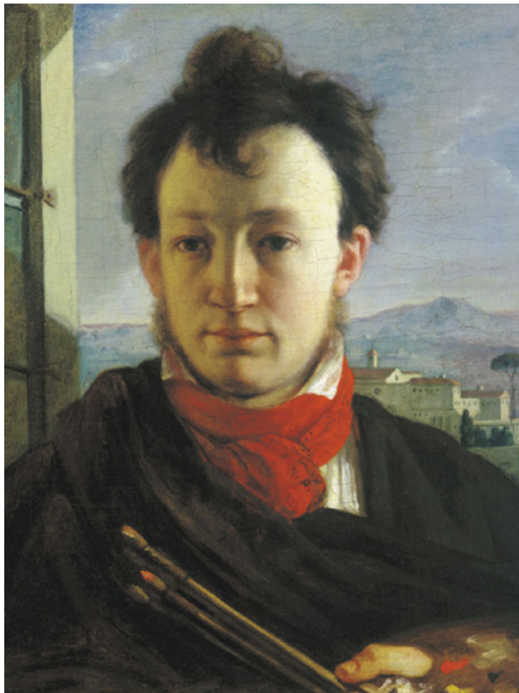
Ил. 9. Александр Варнек. Автопортрет с палитрой и кистями в руке. 1805. Холст, масло. Государственная Третьяковская галерея, Москва. Инв. 11019.

задавались для приобретения технических навыков, зато копии со станковой живописи выполнялись в миниатюре, на чем особенно настаивал Александр Варнек. Так, в 1815-е — 1820-е годы он задает А.А. Фомину копировать в миниатюре «Богородицу с Христом» Д. Бамбини и «Капуцина» Г. Доу и в «нормальном размере» — «Апостола Андрея» А.П. Лосенко [Молева, Белютин 1963, с. 144].