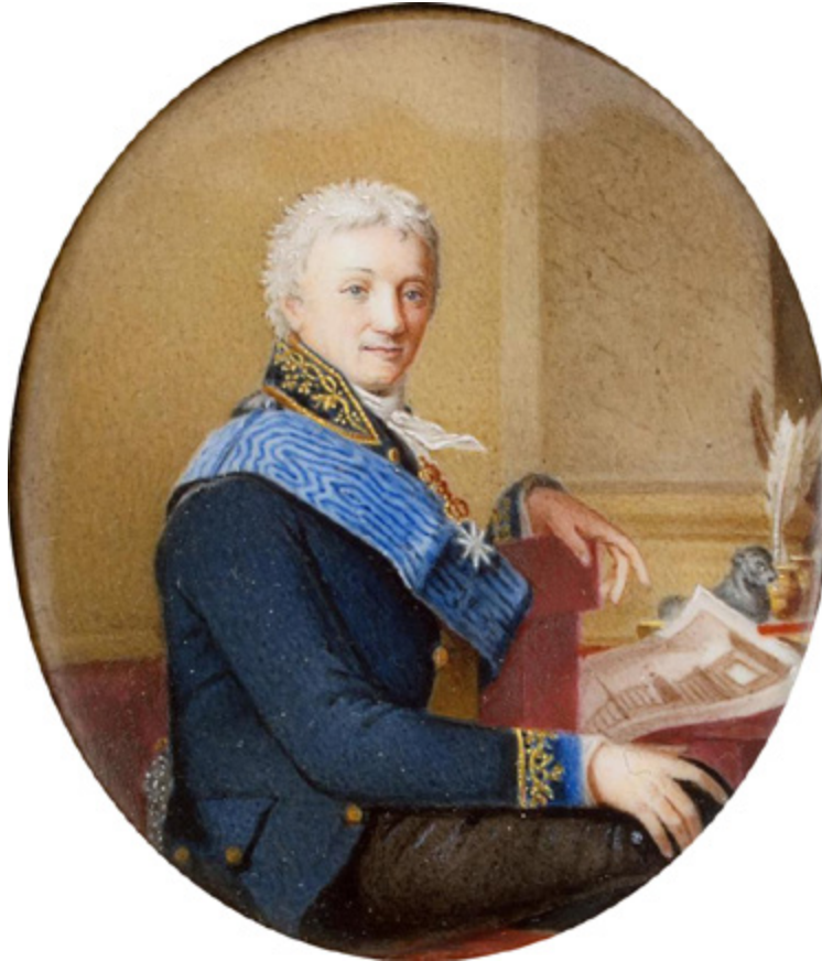
Ил. 2. Дмитрий Евреинов. Портрет графа А. С. Строганова. 1806–1807. Медь, эмаль. Государственный Эрмитаж, Санкт-Петербург. ОЗЕИ-1231.

были установлены все должности для прикладных дисциплин. В живописном отделе — это были академики мозаики, сухими красками, финифтью, миниатюрой...» [Бецкой 1764, с. 35]. В 1766 году живописное искусство представлялось «в рисунках, картинах и миниатюре карандашом, чернилами, красками на масле, воску, воде, сухими и чрез огонь составленными» 3 .