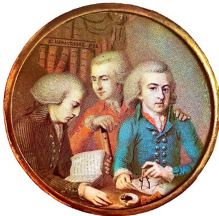
Ил. 5. Корнелий Новоселов. Портрет трех молодых людей (воспитанники Академии художеств?). 1792. Акварель, гуашь. Государственный Русский музей, Санкт-Петербург, Ж-3124.

масляными красками писанный портрет. Эти этюды награждались серебряными медалями. Кстати, серебряные медали портретисты получали и за композиции (ил. 5).