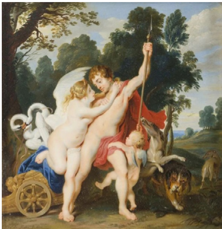
Ил. 7. Петр Росси. Венера и Адонис. 1803. Акварель, кость. Частное собрание.

В методике преподавания Щукина еще сильны традиции XVIII века, но непосредственная работа с натуры постепенно занимает все больше и больше места, а изображение человека по памяти со временем отходит на второй план. Это выражалось в том, что после гризайли ученики переходили не к этюду головы, а к портрету как таковому, в связи с чем преподаватели учили их делать так называемый портретный рисунок. Чем точнее такое впечатление было передано, тем вернее считался портретный рисунок. Подобных рисунков портретные художники делали очень много и даже рисовали во внеурочное время. «Развитие наблюдательности, умения схватывать характерное в индивидуальном облике человека закреплялось затем в цветowych этюдах, выполнявшихся в короткое время и представлявших собой, по существу, подобный рисунку цветовой эскиз, в котором преимущественное внимание уделялось как характеру, так и цветовым особенностям портретируемого человека» [Целищева 1977, с. 123].