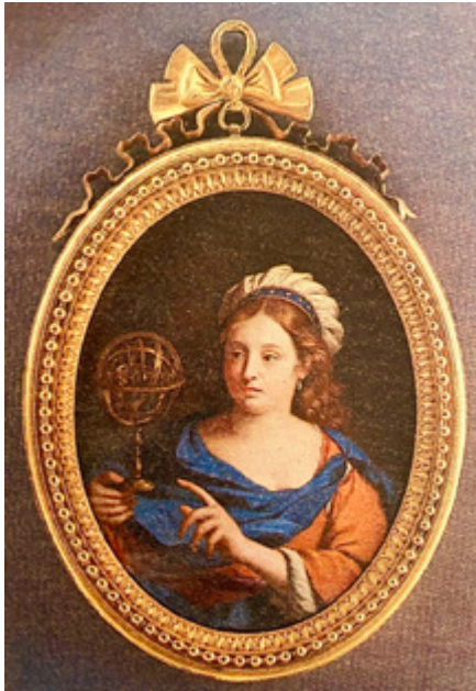
Ил. 3. Петр Жарков. Муза Урания. 1780-е годы. Медь, эмаль. Государственный Русский музей, Санкт-Петербург, Ж-3064.