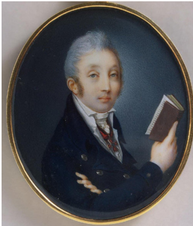
Ил. 8. Павел Иванов. Портрет графа М. М. Сперанского. 1806. Кость, акварель, гуашь. Государственный Эрмитаж, Санкт-Петербург. ЭРР-7753.

обогащены были отчасти лесом, а за оным показывались бы усеянные кустарником холмы, небольшие селения, долины и в отдалении приморской город» 10 .