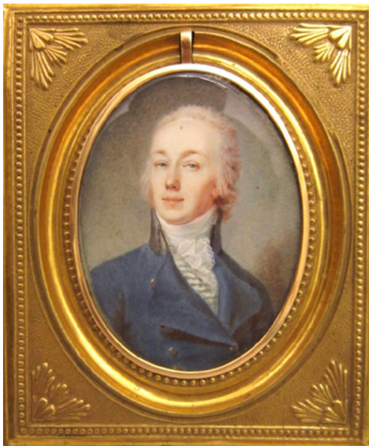
Ил. 6. Степан Щукин. Портрет А. Н. Шемякина. 1801. Акварель, кость. Государственный Русский музей, Санкт-Петербург. Ж-3118.

В 1797 году — «Ной по выходе из ковчега приносит жертву Богу» (за эту программу П.И. Иванов получил большую золотую медаль) 8 .