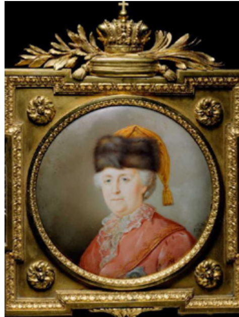
Ил. 4. Петр Жарков. Портрет императрицы Екатерины II в дорожном костюме. 1791. Медь, эмаль. Коллекция Spherot Foundation, Лихтенштейн.

миниатюры покупают два ящика соковых 5 красок для учеников 6 . Петр Жарков — известный и уважаемый мастер, писавший прекрасные эмалевые миниатюры. Среди его работ выделяются портреты Петра I и Екатерины II, а так же Муза Урания (ил. 3, 4). За два года до вступления в новую должность, в 1777 году, Жарков был произведен из «назначенных» в академики по сочиненной им программе «живописная пиеса на финифте, представляющая поколенный портрет сидящего охотника музыки». Задание звучало так: «Поколенная фигура с натуры, мужская или женская, которую следует воспроизвести, «наблюдая во всем исправность» 7 .