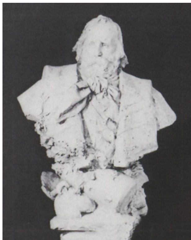
Ил. 2. Эрколе Роза. Джузеппе Гарибальди. 1875. Национальная галерея современного искусства, Рим.