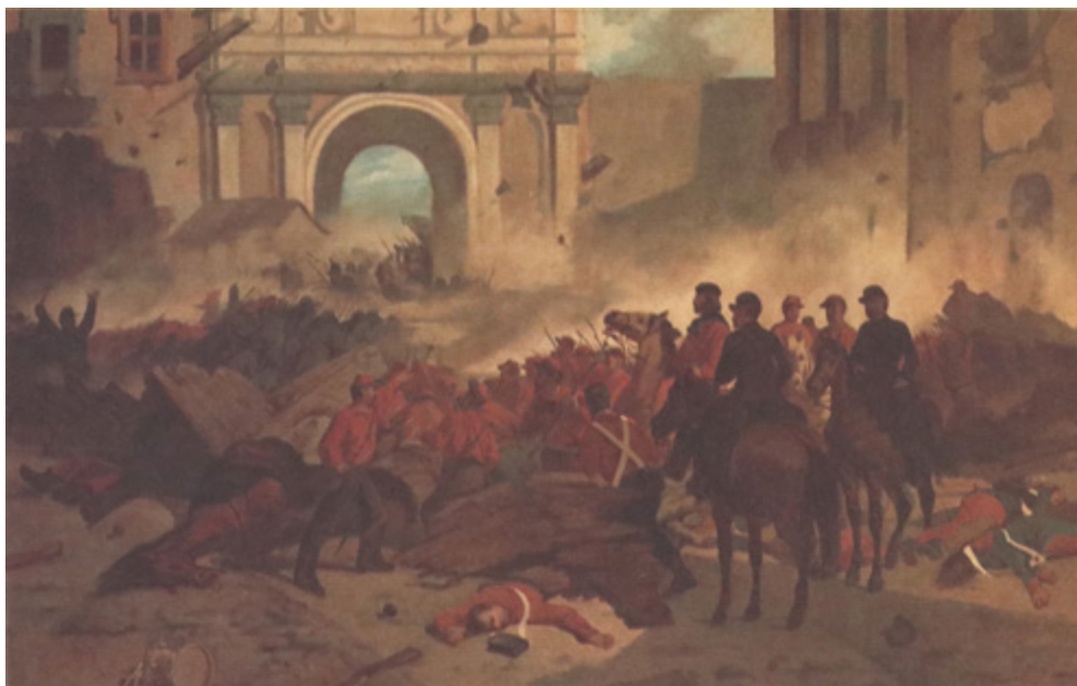
Ил. 12. Джованни Фаттори. Гарибальди в Палермо. 1860–1862. Галерея Питти, Флоренция.