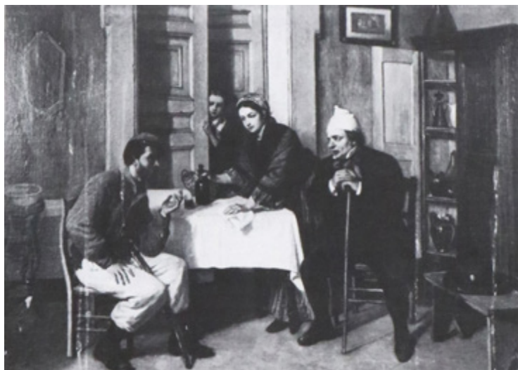
Ил. 18. Акиле Мартинелли. Рассказ раненого гарибальдийца. Муниципалитет, Неаполь.