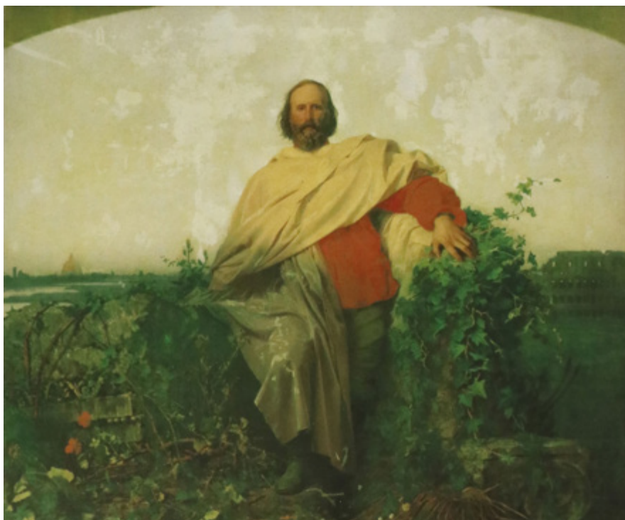
Ил. 8. Доменико Руссо. Гарибальди в Риме. 1862. Национальный музей Сан Мартино, Неаполь.

музей Сан-Мартино, Неаполь) (ил. 8) — в одежде «краснорубашечника» с грустью смотрящим на Вечный город, за который храбро сражался он сам и его волонтеры.