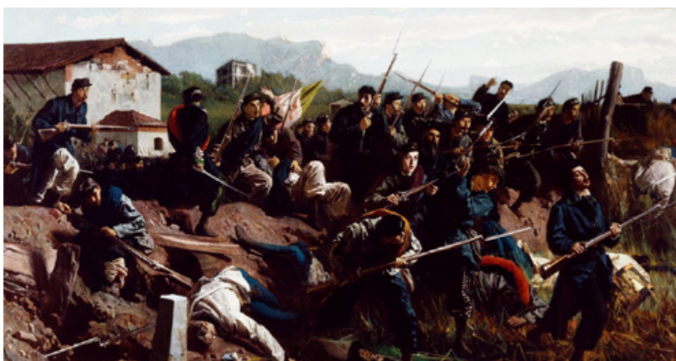
Ил. 13. Федерико Фаруффини. Битва при Варезе. Городской музей Каstellо, Павия.

войну 29 апреля 1859 года. Союзником пьемонтского правительства провозгласил себя Наполеон III, хотя партия Мадзини разоблачала его планы. Против небольшой армии Гарибальди сражалась сорокатысячная армия австрийцев под командованием генерала Удино. Но храбрецы Гарибальди брали один город за другим, и народ Ломбардии радостно встречал их. Наполеон III и Виктор-Эммануил II, испугавшись успехов его армии, поспешили закончить войну, заключив договор с австрийцами в Виллафранка. Он навсегда остался фактом предательства национальных интересов народа Италии в годы Рисорджименто.