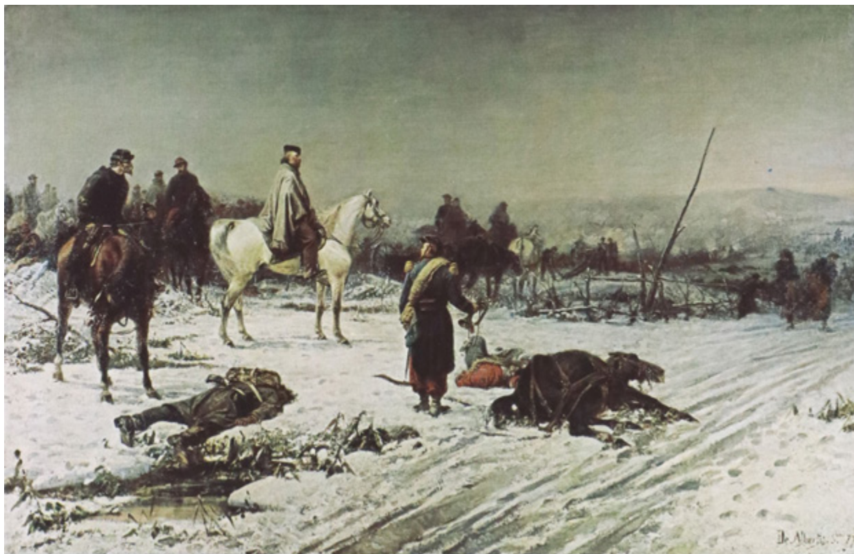
Ил. 14. Себастьяно Де Альбертис. Гарибальди в Дижоне. Ок. 1877. Музей Рисорджименто, Милан.