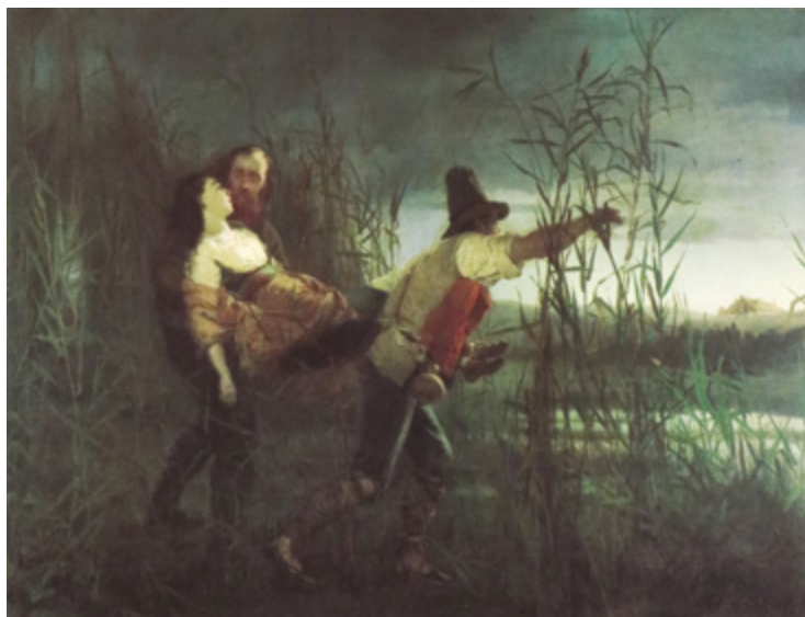
Ил. 15. Пьетро Бувье. Гарибальди и гарибальдиец переносят раненую Аниту Гарибальди. 1864. Музей Рисорджименто, Милан.

в качестве матроса в Бразилию, участвовал в морских сражениях, попал в Аргентину (она поддерживала императора Бразилии), где был взят в плен, бежал, возвратился в Республику Рио-Гранде, где и встретил Аниту. Эта храбрая девушка, покинув свой дом, пошла за ним, принимала участие в сражениях в Италии, родила сына Менотти в 1840 году, который стал помощником отца, участником его походов. Художники часто изображали Менотти рядом с отцом на театрах военных действий. Анита была ранена во время отступления отряда Гарибальди, шедшего на помощь Венецианской республике. Восемь месяцев с огромными потерями, отбиваясь от сил противника, двести храбрецов его отряда пробивались на лодках в Венецию через Сан-Марино, по ним стреляли из пушек австрийцы. В этих сражениях 1849 года и погибла Анита Гарибальди.