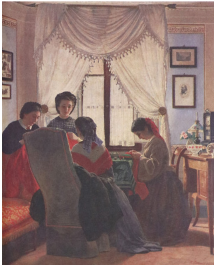
Ил. 20. Одоардо Боррани. За шитьем красных рубашек. 1860-е. Частное собрание.

Дзанетти, спасавшего жизни волонтеров Рисорджименто. Он лечил и Гарибальди после его ранения у горы Аспромонте 29 августа 1861 года, взятия в плен и заключения в крепость Вариньяно. Джозуэ Кардуччи посвятил герою такие строки: «Непобедимый, ты пал, но ты победил своим падением» [Невлер 1961, с. 92].