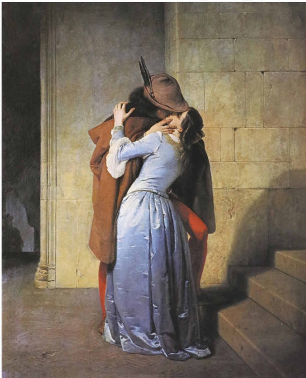
Ил. 21. Франческо Айец. Поцелуй. 1859. Пинакотека Брера, Милан.