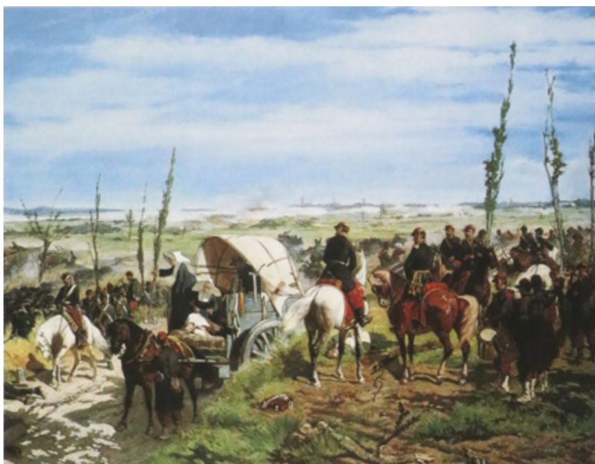
Ил. 10. Джованни Фаттори. Итальянский лагерь в битве при Маджента. 1860. Галерея Питти, Флоренция.

живописец, глава Школы Маккьяйоли Джованни Фаттори (1825–1908) был непосредственным участником сражений. «Наступил 1859 год, — писал художник, — и он стал нашей революцией за освобождение искусства, он и породил движение „маккьяйоли“» [De Micheli 1981, p. 2]. Художник документально запечатлел сцену битвы при Кустоце, значительный эпизод в истории освободительной борьбы 1850-х годов на полотне «Битва при Кустоце» (1876–1878, Галерея Питти, Флоренция) (ил. 9). «Искусство должно отражать только события современной истории» [De Micheli 1981, p. 91–92] — этому девизу следовали все «маккьяйоли», мечтавшие о создании «живого искусства», раскрывающего подлинную реальность своего времени. Фаттори сумел освободить батальные сцены от условности и пафоса театральности. В полотне «Итальянский лагерь в битве при Маджента» (1860, Галерея Питти, Флоренция) (ил. 10) он прославлял не доблесть короля Пьемонта Карла-Альберта, принцев Умберто и Амедео, генерала Ла Мермора, а солдат-артиллеристов и командующих ими офицеров, стрелков-берсальеров ( bersagliere — стрелок). Большие