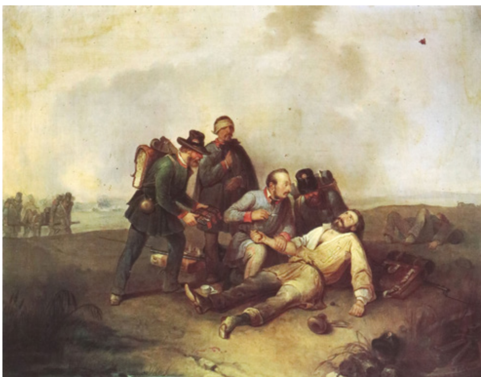
Ил. 19. Джузеппе Мориччи. Врач Дзанетти лечит солдат. 1848. Частное собрание.

во Флоренцию, держа в руках знамя воинов Гарибальди. Художник был участником сражений Рисорджименто.