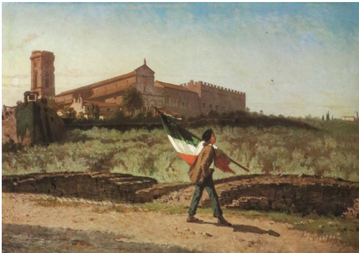
Ил. 16. Франческо Саверио Альтамура. Первое знамя гарибальдийца во Флоренции в 1859 году. Национальный музей Рисорджименто, Турин.