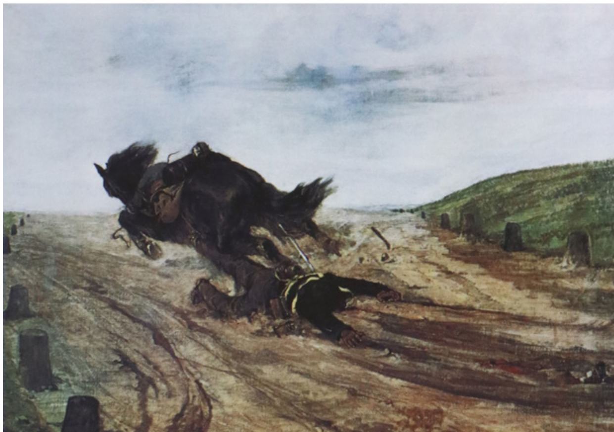
Ил. 11. Джованни Фаттори. Раненый. 1878–1879. Галерея Питти, Флоренция.

полотна с батальными сценами писались на основании этюдов, сделанных на местах сражений. Процесс овладения методом пленэрной живописи был очень важен для мастеров Школы Маккьяйоли. Автобиографично полотно Фаттори «Раненый» (1878–1879, Галерея Питти, Флоренция) (ил. 11), на котором изображен посыльный, везущий пакет в ставку. Он ранен, вывалился из седла, а конь его, оглушенный грохотом боя, несет вскачь. Эта сцена вызывает в памяти строки стихотворения Джозуэ Кардуччи «К итальянцам»: