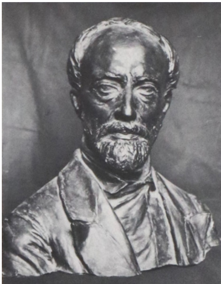
Ил. 4. Уго Пиццикелли. Джузеппе Мадзини. Музей Рисорджименто, Флоренция. Тосканское общество истории Рисорджименто ?