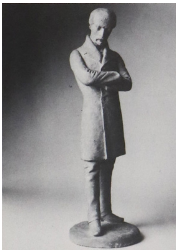
Ил. 5. Адриано Чечони. Джузеппе Мадзини. Ок. 1880. Частное собрание.