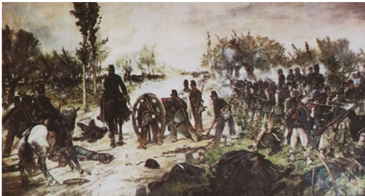
Ил. 9. Джованни Фаттори. Битва при Кустоце. 1876–1878. Галерея Питти, Флоренция.