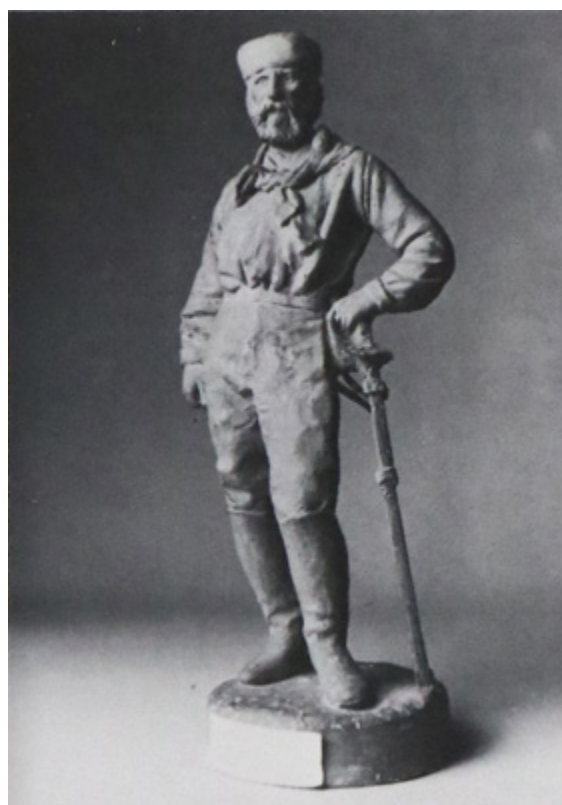
Ил. 6. Адриано Чечони. Джузеппе Гарибальди. Ок. 1880. Частное собрание