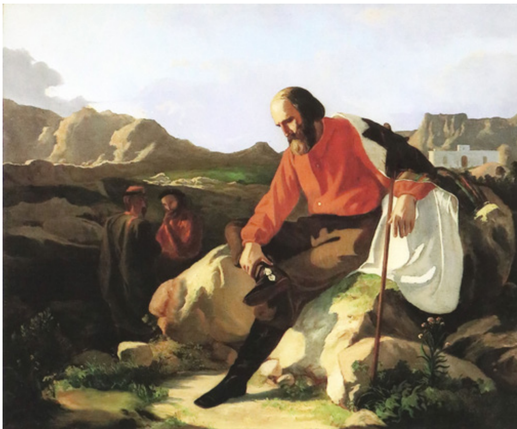
Ил. 7. Винченцо Кабянка. Гарибальди в Капрера. 1880-е. Частное собрание.