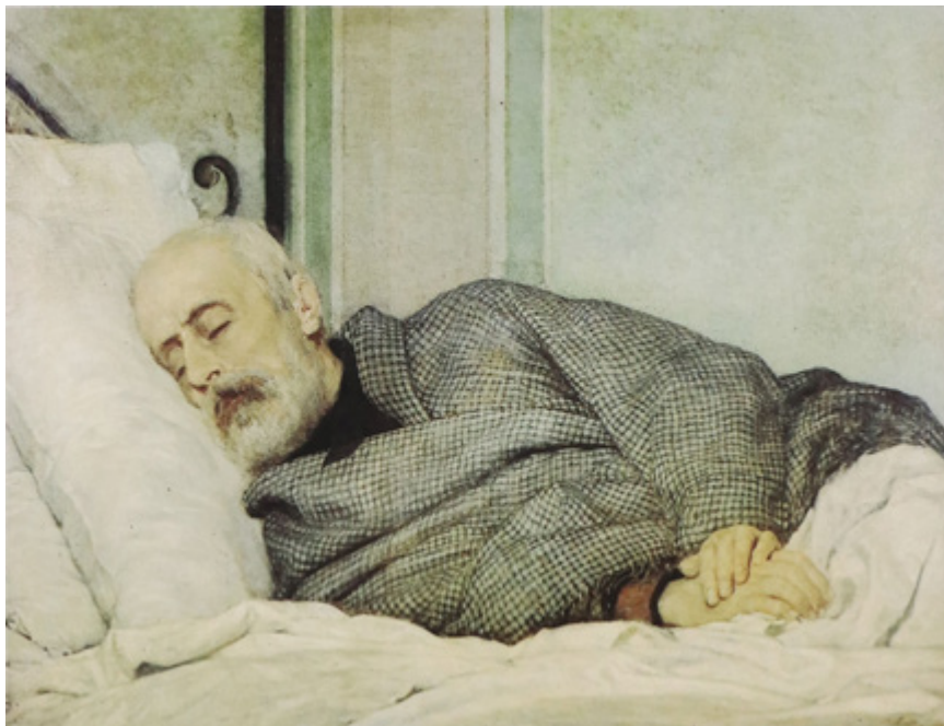
Ил. 1. Сильвестро Лега. Мадзини на смертном одре. 1872–1873. Частное собрание.