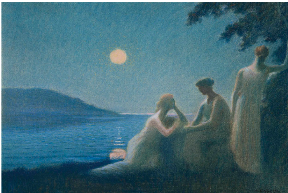
Альфонс Обер. Под лунным светом. 1895.