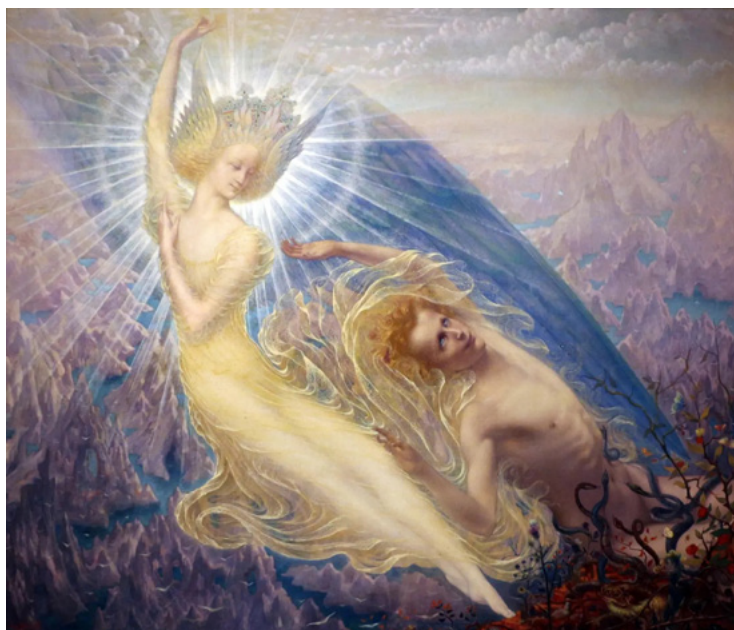
Жан Дельвиль. Блещающий ангел. 1894. Королевский музей изящных искусств, Брюссель.

в наше время представляются все более нужными. Оказывается, современное искусство может быть и таким: стремиться к идеальному и возвышенному, выражать религиозное начало — а его творцы вполне способны быть «жрецами, королями и магами». В манифесте Салона «Роза+Крест», написанном Пеладаном, подчеркивалось, что основанный им в 1891 году Католический и эстетический Орден Розы+Креста Храма и Грааля (L'Ordre de la Rose+Croix Catholique et esthétique du Temple et du Graal) представляет оккультные идеалы искусства, тяготеет к католицизму и мистицизму, к мифу. Пеладан не разделял ценности современного ему искусства (импрессионизма, реализма), более того, он предрекал гибель латинского мира. На исторических рубежах трансформации этого