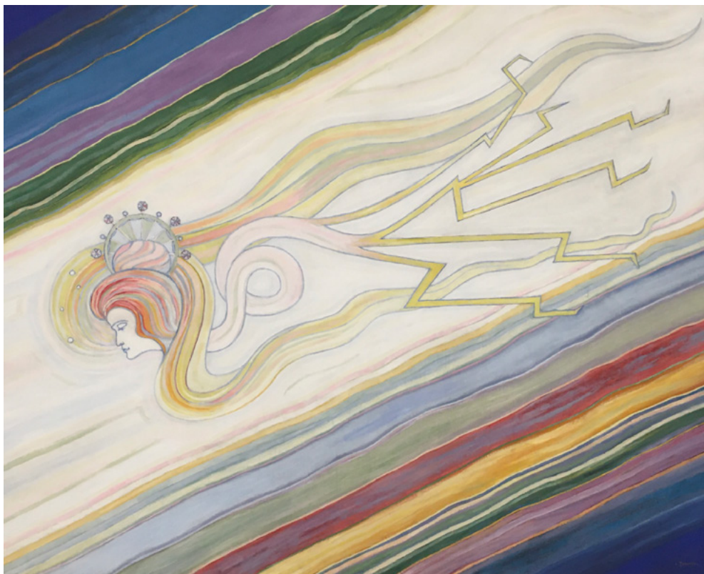
Альбер Траксель. Молния. 1901. Художественный музей, Золотурн, Швейцария.