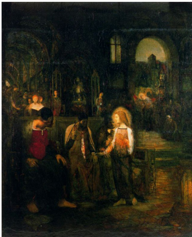
Жорж Руо. Молодой Христос среди учеников. 1894.

Впечатляющее предисловие Игоря Светлова сразу настраивает читателя на определенный лад: авторы сборника не уклоняются от полемики и видят альтернативу устоявшимся искусствоведческим точкам зрения, хотя и не стремятся к обязательному пересмотру всего и вся. Они предлагают своему читателю присоединиться к научному исследованию с неизвестным заранее финалом, главная цель которого – нахождение новых ракурсов, а не перечисление и подтверждение привычного.