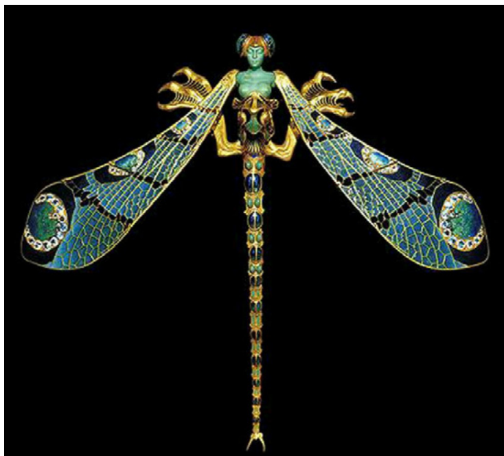
Рене Лалик. Пектораль «Женщина-стрекоза». 1900-е.