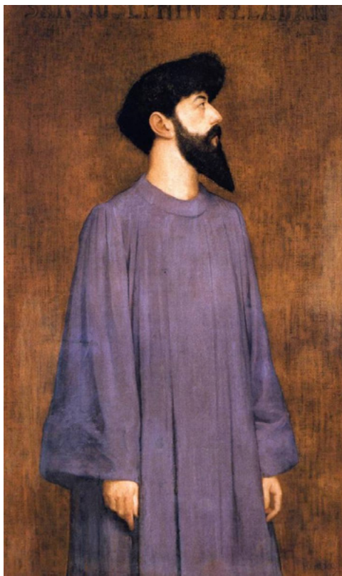
Александр Сеон. Сар Жозефен Пеладан. 1881. Лионский музей изобразительных искусств, Лион.

В самом конце XIX столетия русские художники — создатели современного искусства, обосновавшиеся в Абрамцево вокруг Саввы Мамонтова — познакомились с выставками Salon de la Rose+Croix / Салона «Роза+Крест», ставшими к тому времени одной из заметных составляющих парижской художественной жизни. Каталоги этих выставок привез в Абрамцево из Франции Константин Коровин, с 1890-х годов часто бывавший в тогдашней столице мирового искусства. Они вызвали у художников-абрамцевцев интерес, но не более. Почему? Тут необходимо вспомнить, как в целом в русской художественной школе эпохи передвижничества относились к «французам». Об этом ярко свидетельствуют, например, письма Ивана Крамского. «Эффектно, но не глубоко», — так можно обобщенно представить его тогдашнюю точку зрения. Только Василий Поленов вносил в этот хор голосов иную ноту: в письме к Владимиру Стасову он утверждал, что высоко ценил и ценит французскую художественную школу. Триумфальное шествие современного французского искусства, увлечение им начинаются в России в начале XX века — с «Мира искусства» и учебы русских художников (таких как Виктор Борисов-Мусатов, Анна Остроумова-Лебедева, Мария Якунчикова, Константин Сомов и многих других живописцев и скульпторов) в парижских академиях. Французское искусство в этот момент уверенно входит в круг интересов российских художников и утверждается здесь на несколько десятилетий XX века.