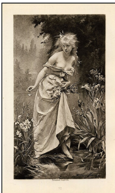
Мадлен Лемер. Офелия. 1880.

цивилизационного феномена он мечтал о его возрождении на основе идеала в новом блеске и великолепии, видел его альтернативой бескрылой буржуазности и, метафорически выражаясь, «звал в будущее».