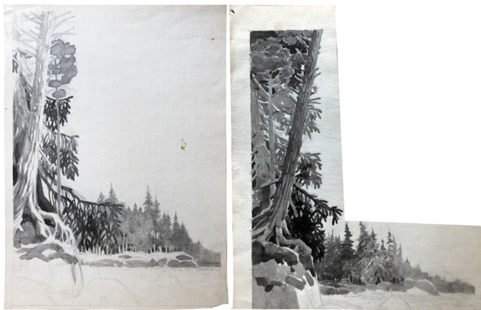
Ил. 9, 10. С. П. Лодыгин. Эскизы. 1920–1930-е. Бумага, акварель. 24,5 × 33,5; 26 × 31. Частное собрание.

Занимаясь биографией Лодыгина долгие годы и понимая скромный, ненавязчивый, интровертный склад его характера, можно предположить, что пейзаж для него стал именно такого рода компенсаторным механизмом и средством психологической защиты. Для художника, профессионально и очень активно работавшего в это же самое время в жанрах журнальной иллюстрации, книжного оформления и агитационного плаката, пейзаж, оставаясь сугубо частным, внутренним делом, приватным, но каждодневным занятием, был сродни аутогенной арт-терапии или личному дневнику.