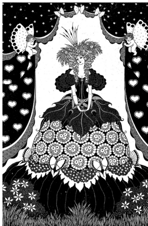
Ил. 3. С. П. Лодыгин. «Печальная Весна». Иллюстрация из журнала «Солнце России», 1916, № 321–322 (15–16).

художником столичных журналов. А после революции и фронтов Гражданской войны Лодыгин оказался в Москве и возобновил контакты с издателями.