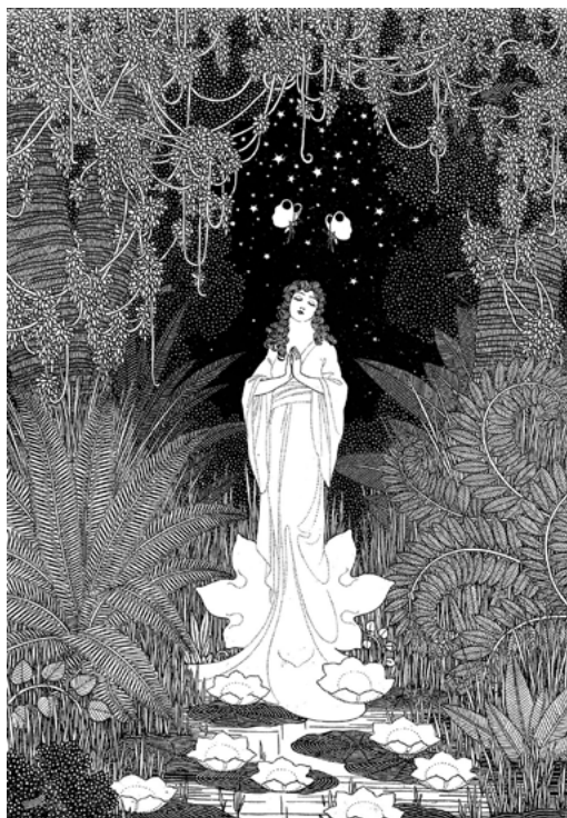
Ил. 2. С. П. Лодыгин. «Радость жизни». Иллюстрация к рассказу Владимиру Келера из журнала «Нива». 1916. № 52. с. 857.