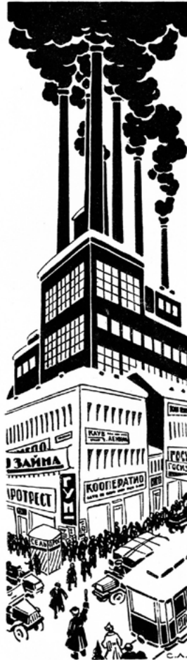
Ил. 4, 5. С. П. Лодыгин. Иллюстрации к стихам А. Жарова из журнала «30 дней», 1925, № 1, с. 13–14.