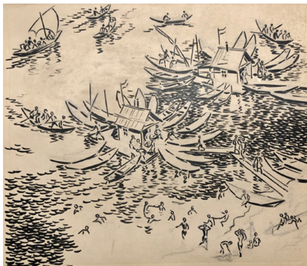
Ил. 14. С. П. Лодыгин. Эскиз. 1920-е. Бумага, карандаш, тушь. Частное собрание.