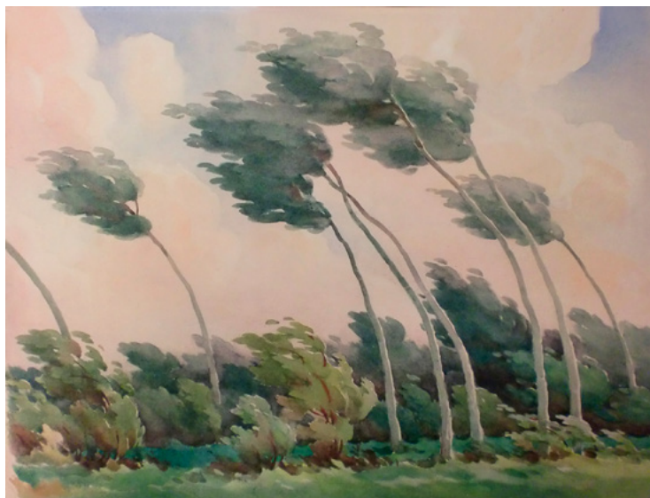
Ил. 8. С. П. Лодыгин. Пейзаж. 1920-е. Бумага, акварель. 38,2 × 51,3. Собрание М. Я. и А. В. Чапкиных.