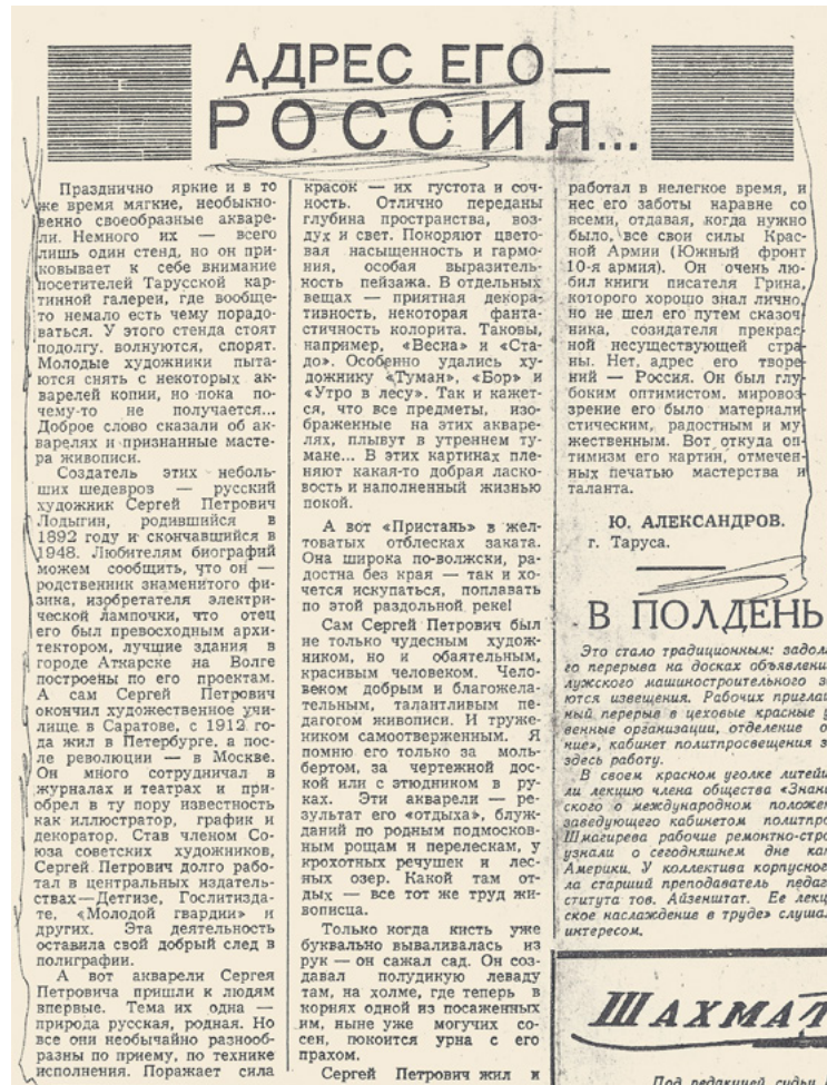
Ил. 16. Вырезка из статьи «Знамя». Калуга, 1966. 26 февраля. С. 4.

автору Тарусской картинной галереи 13 и опубликованным в рецензии, о которой речь далее) и некоторые другие, названия которых неизвестны. Вторая персональная выставка художника случилась только почти четверть века спустя — в 1990 году в Неаполе, несколько работ экспонировалось на выставках 2012 и 2014 годов в Государственной Третьяковской галерее и ГМИИ имени А.С. Пушкина. От неаполитанской выставки остался буклет 14 , от выставок в центральных музеях, где пейзажи художника представлены не были, — несколько слов в журнальной статье 15 и репродукции графики в каталоге 16 , а от давней выставки в Тарусе — небольшая, но полноценная статья-заметка, пусть и в провинциальной газете 17 , посвященная специально художнику и написанная хорошо знавшим его человеком; она особенно интересна и важна для биографии Лодыгина. Пожалуй, это была первая и на долгие годы единственная публикация о художнике, вышедшая после его смерти в 1948 году. В связи с малодоступностью издания и актуальностью высказанных в ней наблюдений по интересующей нас теме, приведем ее с максимальной полнотой (ил. 16):