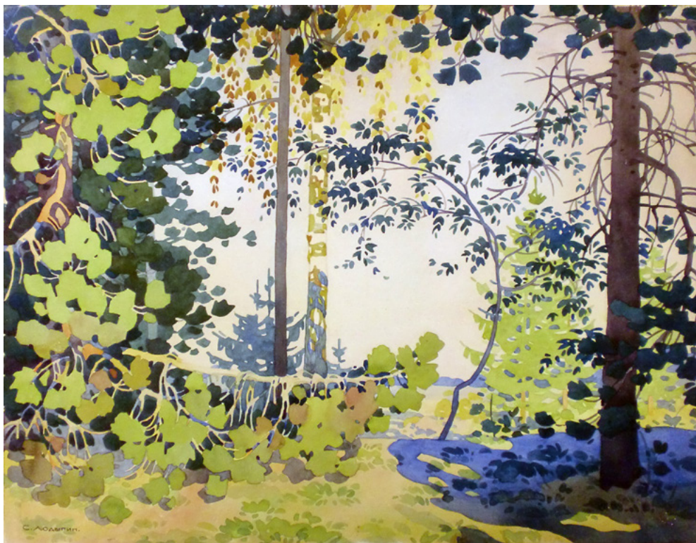
Ил. 7. С. П. Лодыгин. Пейзаж. 1920-е. Бумага, акварель. 31,5 × 41,5. Собрание М. Я. и А. В. Чапкиных.