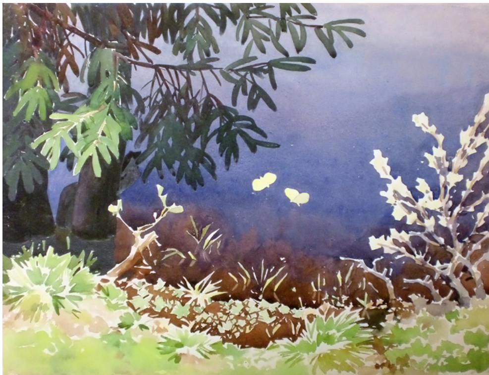
Ил. 18. С. П. Лодыгин. Пейзаж. 1920-е. Бумага, акварель. 31,5 × 41,5. Собрание М. Я. и А. В. Чапкиных.

было установлено, что прах Лодыгина развеян в Удельной — одной из подмосковных станций Казанского направления железной дороги — В. Г.].