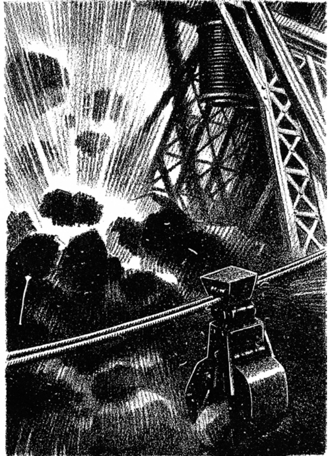
Ил. 6. С. П. Лодыгин. Иллюстрация к рассказу А. Платонова «Лунная бомба» из журнала «Всемирный следопыт», 1926, № 12.

чаще обращается к стилизованным городским архитектурным сюжетам (ил. 4, 5) в духе ар деко — к футуристической и конструктивистской графике, адаптированной в целях большей декоративности и приспособленной для аудитории популярных журналов 1920-х годов, — тех самых «левых течений», которые подметил в изменившемся стиле художника автор журнала «Всемирная иллюстрация» 4 .