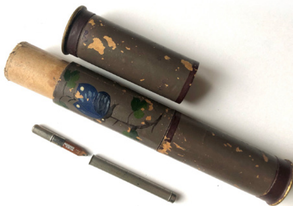
Ил. 17. Пенал для карандашей и перьевых ручек. 1940-е. Авторская роспись масляными красками. Частное собрание.

Тарусской картинной галереи, где вообще-то немало есть чему порадоваться. У этого стенда стоят подолгу, волнуются, спорят. Молодые художники пытаются снять с некоторых акварелей копии, но пока почему-то не получается... Доброе слово сказали об акварелях и признанные мастера живописи.