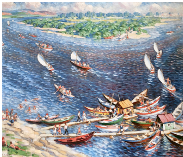
Ил. 13. С. П. Лодыгин. Пейзаж. 1928. Холст, масло. 67 × 83. Частное собрание.