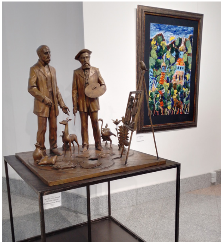
Ил. 7. З. К. Церетели. Мои любимые художники. Пиромани и Руссо. 2006. Бронза. На стене справа: З. К. Церетели. Древняя церковь. 2008. Эмаль.