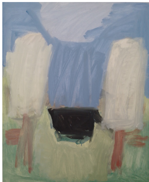
Ил. 4. И. А. Старженецкая. День Святого Духа. 2015. Холст, масло.