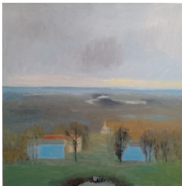
Ил. 6. Е. Е. Буравлева. Экскурсия. 2013. Холст, масло.

историческими вторжениями в тот ареал вечности, который периодически разрушается человеком сначала в себе, а затем уже и вовне.