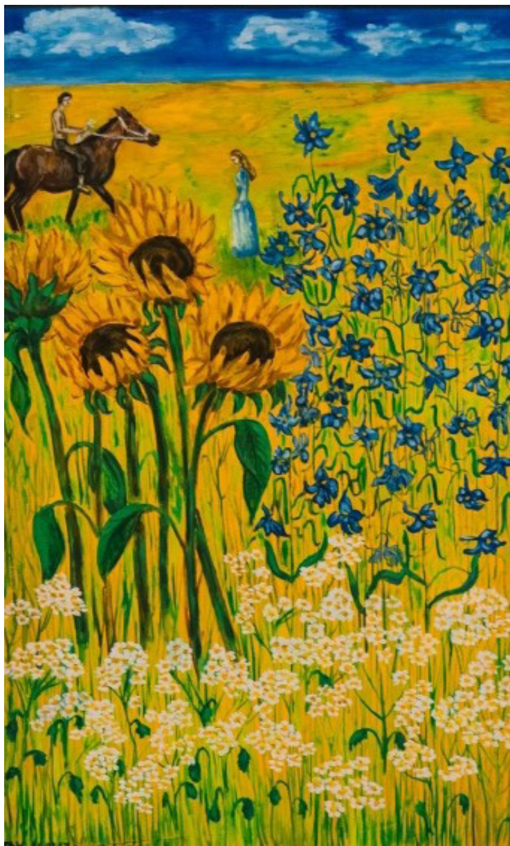
Ил. 10. Т. А. Кочемасова. Романтический пейзаж. 2017. Холст, масло.