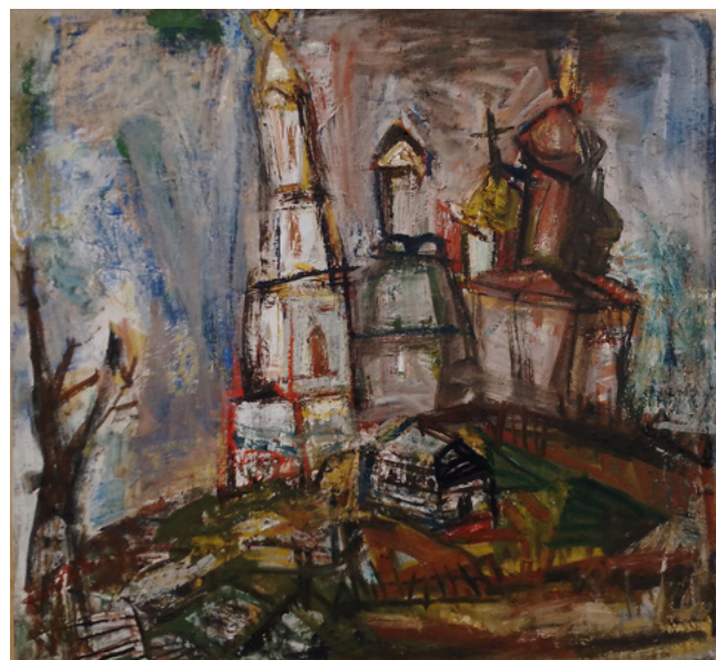
Ил. 2. П. Ф. Никонов. Разрушенный храм. 2023. Картон, масло.