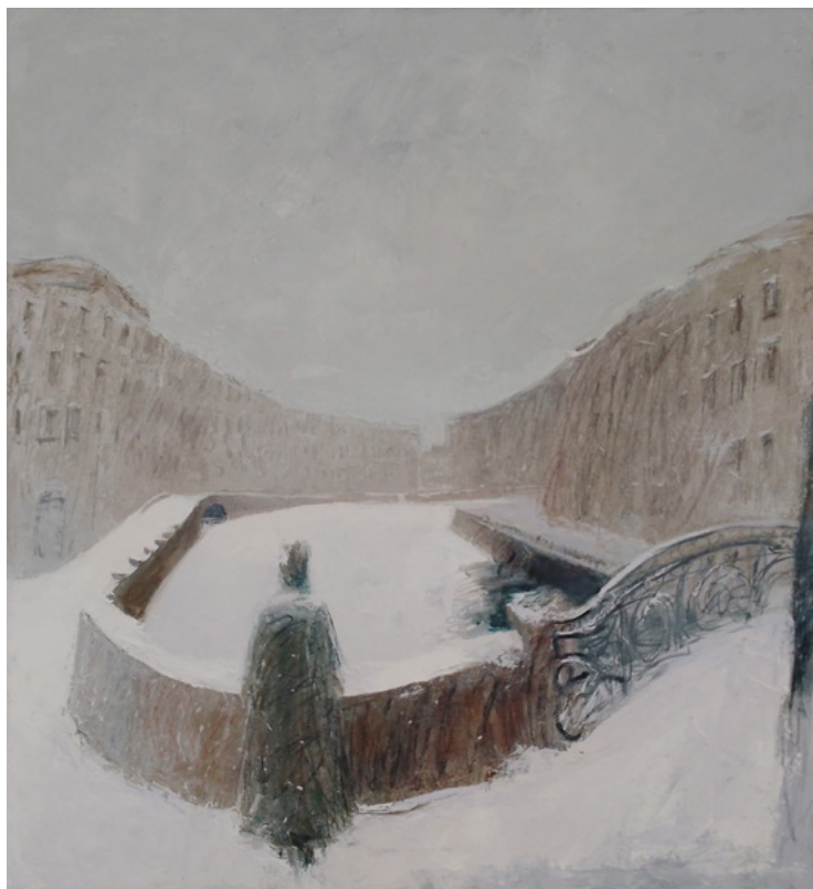
Ил. 17. А. А. Братыкин. Снег идет. 2021. Холст, масло.