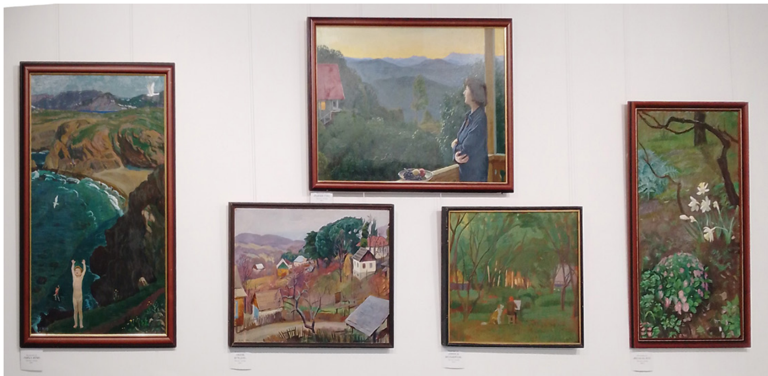
Ил. 20–24. Д. Д. Жилинский. Раннее утро. 1960. Оргалит, темпера (вверху). Чайки летят. 2008. Оргалит, темпера (первая слева). Осень в Уч-Дере. 1960. Оргалит, темпера (вторая слева). Нина за мольбертом. 1976. Оргалит, темпера (третья слева). Весна на юге. 2008. Оргалит, темпера (правая).

Ныне пейзаж как жанр отмечен многоаспектной полифоничностью передачи внутренних смыслов, синтезирующих переживание с рефлексией его осмысления. Именно поэтому в выставочном пространстве органично взаимодействовали разные по психологическим качествам и пластическим языкам произведения. Абстрактная ассоциативность, романтическая мечтательность, содержательность визуальной метафоры обретаются современными художниками в единстве соприкосновения с реальным натурным мотивом, цельность которого не уничтожается, а, напротив, преобразуется и обогащается коннотациями, вносимыми искусством.