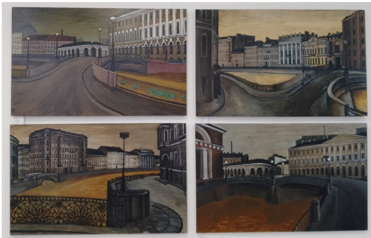
Ил. 13–16. Б. А. Мессерер. Мойка. Вид с Малоко́ньюшенного моста. Холст, масло. 2017. Верхняя слева. Вид на Мойку со стороны Певческого моста. Холст, масло. 2017. Нижняя слева. Вид на Мойку с Большо́го Староко́ньюшенного двора. 2017. Холст, масло. Верхняя справа. Мойка. Вид с театрального моста. 2017. Холст, масло. Нижняя справа.