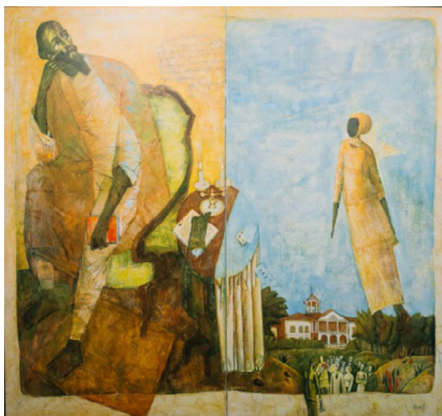
Ил. 5. Н. А. Мухин. Экскурсия в Карабаху. 1989. Холст, темпера, масло.