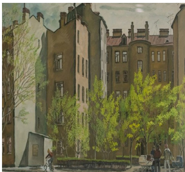
Ил. 11. Л. В. Шепелев. С. П. Весна. 2002. Тонированная бумага, карандаш, гуашь.