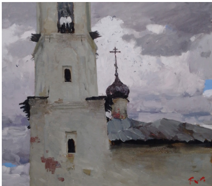
Ил. 3. А. В. Тыщенко. Колокольня. 2022. Холст, масло.