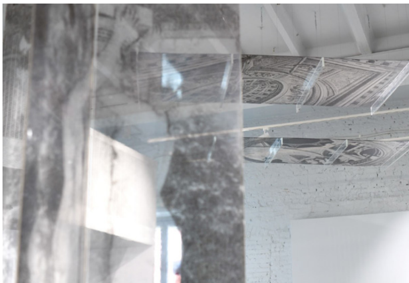
Произведения В. Куприянова в экспозиции «Тень времени», галерея POP/OFF/ART. Москва, июнь 2021.