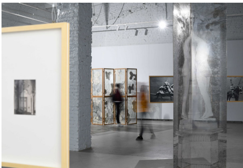
Произведения В. Куприянова в экспозиции «Тень времени», галерея POP/OFF/ART. Москва, июнь 2021.

Для тех, кто не представляет себе московскую, российскую арт-сцену 1980-х — начала 1990-х, важно сказать, что Куприянов был из числа немногих пионеров, использовавших новые материалы (не только новые для традиционного искусства,