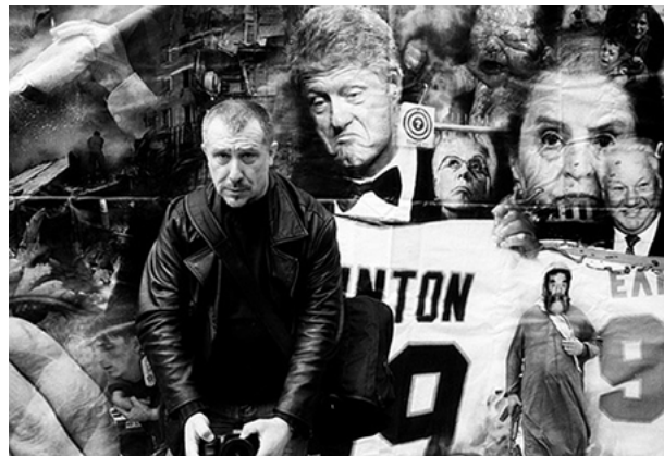
Поздний портрет: Автор неизвестен. Владимир Куприянов. Коллаж. Начало 2000-х гг.

но придуманные в XX веке, в эпоху технологического развития цивилизации). Куприянов стал одним из первых работать с целлюлозными и полиэфирными пластиками, акриловым полимером, комбинировать стекло и дерево, полистирол (известный как пенокартон) и бумагу в своих произведениях. Перед ним не стояла задача изобрести новое сочетание материалов в искусстве, но сам выбор материалов был продиктован идеями, образами, которые предстояло воплотить. Его творчество — это борьба с веществом и гравитацией, основанная на знании сопромата и геометрии. Это создание формы, парадоксальной в своей простоте; формы, отменяющей тяжесть и плотность; формы, становящейся зыбкой и призрачной. Формы, которая развоплощает вещество.