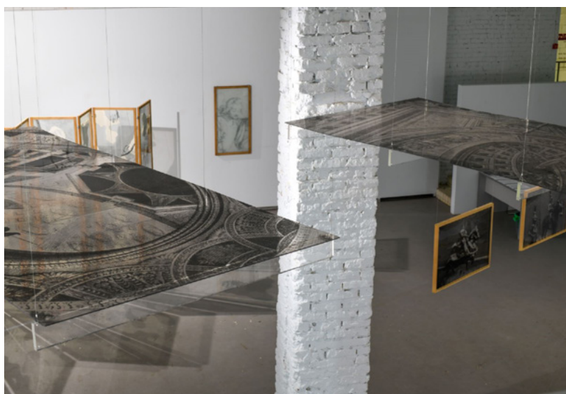
Произведения В. Куприянова в экспозиции «Тень времени», галерея POP/OFF/ART. Москва, июнь 2021.

В начале 1990-х Куприянов создает цикл многосоставных панно, где фотография проходит через разъятие, и в разобщении фрагментов, обретении ими самости получает новые смыслы. Так рождаются его наиболее известные проекты «Не отвержи мене...» и «Поминки». О связи этих произведений с романтической традицией позднесоветского