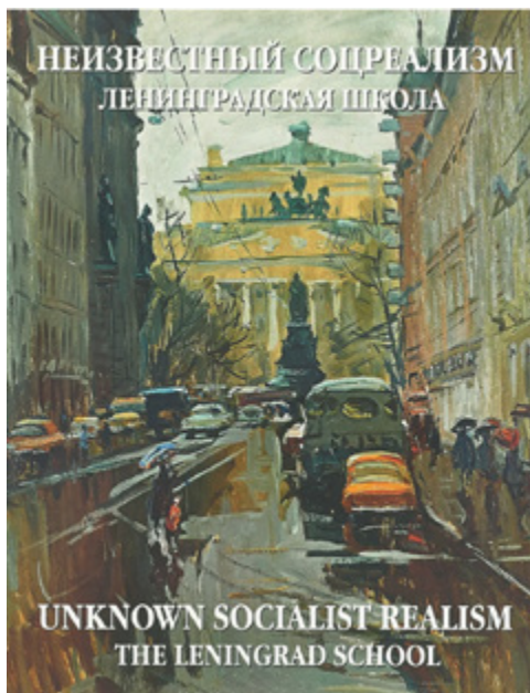
Ил. 3. Обложка книги «Неизвестный соцреализм. Ленинградская школа». 2007.