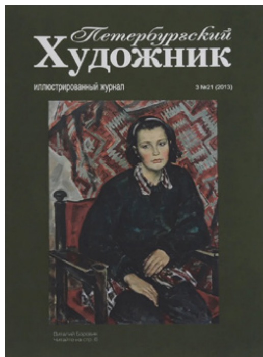
Ил. 5. Обложка журнала «Петербургский художник».