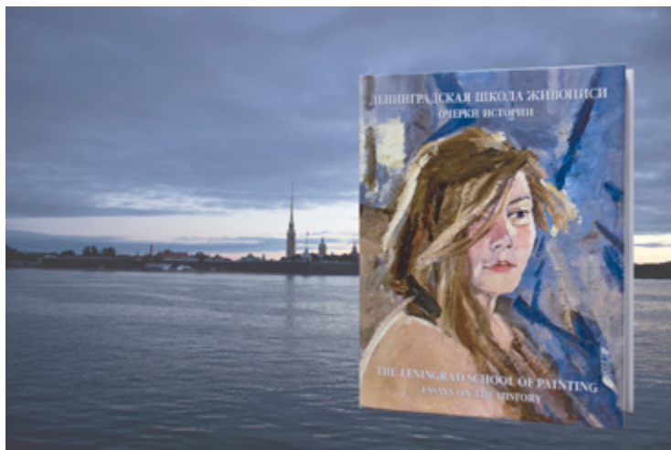
Ил. 1. Ленинградская школа живописи. Очерки истории. 2017.