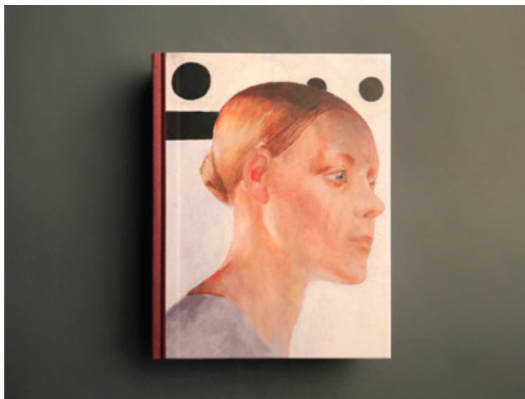
Ил. 2. Дейнека. Самохвалов. Каталог выставки. 2020.

коллекционера. Вторая половина XX века. Ленинградский опыт» (2019) [Кононихин 2019], появившиеся уже после выхода упомянутой книги (ил. 2).