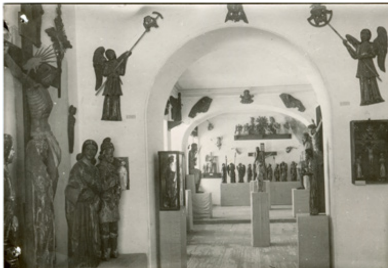
Ил. 2. Первая экспозиция деревянной скульптуры. 1925.