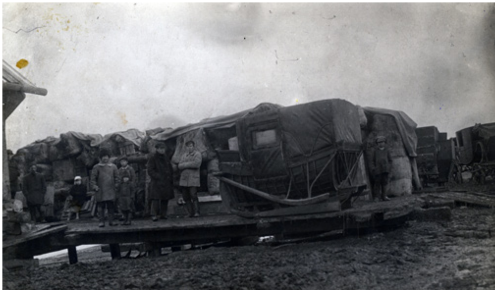
Ил. 3. Музейные грузы на пристани Пажва. Конец сентября 1925. Ф. 2. Д. 1125. Л. 40.