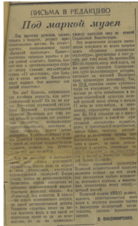
Ил. 5. Вырезка из газеты «Уральский рабочий». 10 сентября 1938.