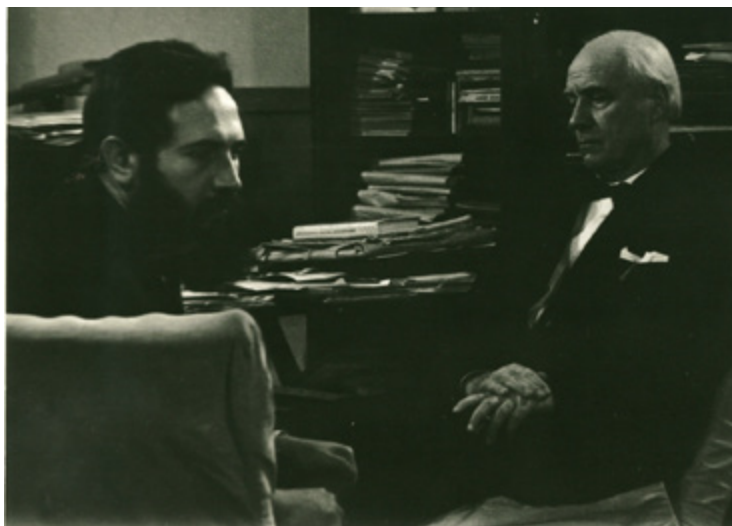
Ил. 14. Дома у Ивана Семеновича Козловского. Звучит Вторая симфония Иоганнеса Брамса в исполнении Е.А. Мравинского и его оркестра. Москва. 1978.

В силу этого примененная автором формулировка заглавия становится неким прототипом для концентрации смыслов в большинстве глав научно-художественного исследования, а сверх того — убедительным средством показать читателям, насколько естественно и близко соотносятся друг с другом гармоничные комплексы выразительных средств в казалось бы различных видах художественного творчества.