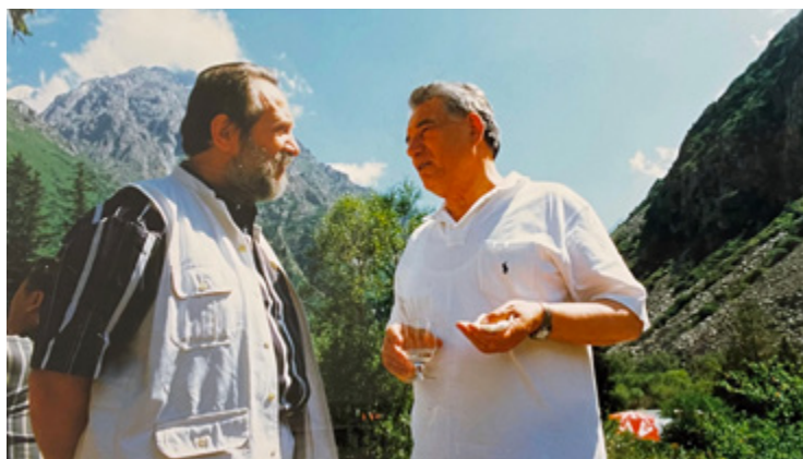
Ил. 19. С Чингизом Торекуловичем Айтматовым. 1980-е. Урочище Ала-Арча близ Бишкека.

На протяжении всей творческой жизни автор счастливо и близко общался с выдающимися творческими личностями: Константин Паустовский, Александр Твардовский, Чингиз Айтматов, Виктор Астафьев, Валентин Распутин, Мариэтта Шагинян, Дмитрий Шостакович, Георгий Свиридов, Валерий Гаврилин, Пауль Хиндемит, Бенджамин Бриттен, Золтан Кодай, Игорь Стравинский, Святослав Рихтер, Артур Рубинштейн, Генрих и Станислав Нейгаузы, Евгений Мравинский, Евгений Светланов, Геннадий Рождественский, Владимир Федосеев, Александр Юрлов, Иван Козловский, Нина Дорлиак, Зара Долуханова, Елена Образцова, Галина Писаренко, Александр Ведерников, Николай Луганский... В круге общения были ученые-искусствоведы и литературоведы первого ряда, и среди них Михаил Алпатов, Дмитрий Сарабьянов, Петр Палиевский, Александр Михайлов, Георгий Гачев, Ирина Антонова. В фотогалерее, органично включенной в книгу, также представлены достойнейшие люди театра и кино — Галина Уланова,