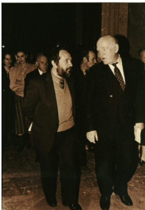
Ил. 7. Со Святославом Теофиловичем Рихтером в ГМИИ имени А.С. Пушкина по завершении концерта «Декабрьских вечеров». 1980-е. Москва.

На протяжении всей своей длительной творческой деятельности А.А. Золотов стремился рассматривать различные области творчества в их неразрывной связи. Следует также признать, что эта непростая задача всегда вполне успешно разрешалась автором. Поэтому крайне объемная рукопись «Книги критика» написана в целом очень ровно и читается от начала до конца с неослабевающим интересом. Ее автору выпала счастливая судьба быть очевидцем многих важнейших событий в мире искусства, и он