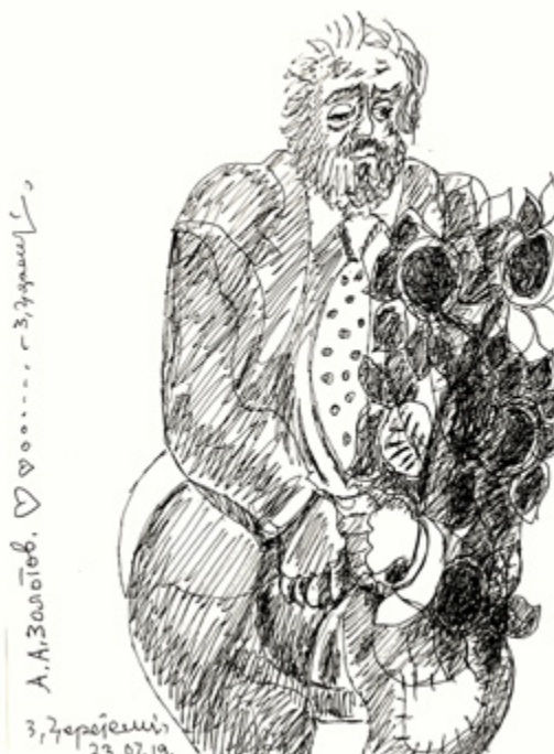
Ил. 13. З. К. Церетели. А. А. Золотов. 2019. Бумага, перо. Частная коллекция. Москва.

мировоззренческих философий до конкретики многих предшествующих стилевых концепций.