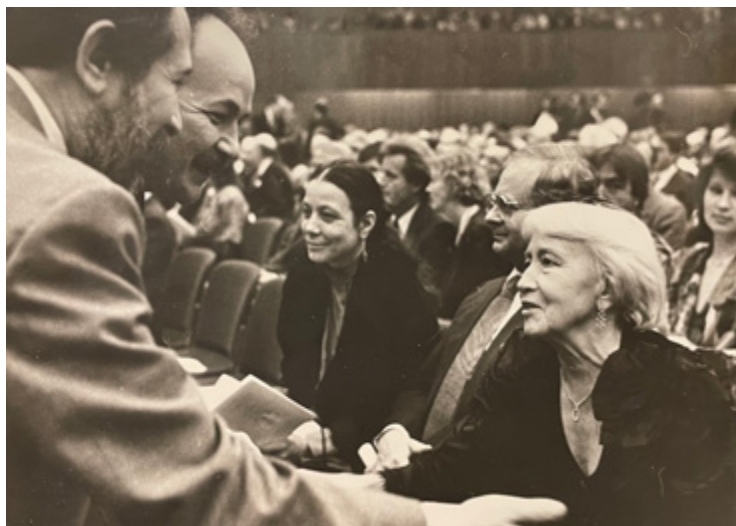
Ил. 10. С Галиной Сергеевной Улановой — министр культуры СССР Н.Н. Губенко и заместитель министра А.А. Золотов на Международном фестивале музыки С.С. Прокофьева. Дуйсбург. Германия. 1991.

Принципиально важной представляется первая и самая большая по объему часть, озаглавленная строкою А.С. Пушкина «И виждь, и внемли». Она включает в себя 64 статьи. В них представлены непрерывные размышления автора о назначении художественной критики, ее роли в развитии искусства и общества, судьбе ряда ведущих представителей русской школы критики. В текстах этого раздела автор обращается к творчеству В.В. Стасова, Д.В. Сарабьянова (проанализировав поэтические произведения выдающегося ученого), Н.А. Дмитриевой и многих своих коллег — современных критиков и историков искусства. Ряд статей посвящен заметным событиям в жизни Российской академии художеств (обзоры выставок, рецензии на книги) и отражает роль Академии художеств в современном культурном процессе.