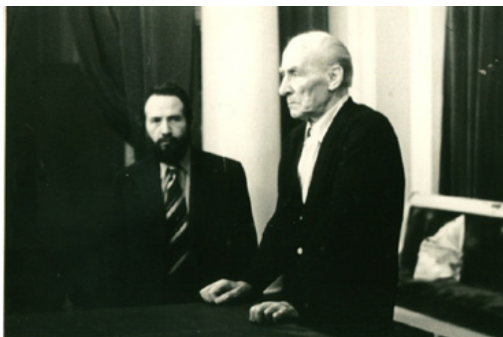
Ил. 5. В Большом зале Ленинградской филармонии с Евгением Александровичем Мравинским на съемках документального телефильма. 1973. Ленинград.

Далее, трактуя эту мысль, А.А. Золотов говорит: «Современная жизнь, разнообразная и капризная, дает нам множество примеров решительно отличных друг от друга подходов к тому, что именуют сегодня искусством. Художественная среда ныне как никогда активна, в своих устремлениях противоречива, подчас агрессивна в своей актуальной антитрадиционности... Символизм при этом по-своему охраняет высокое искусство от буйства амбициозных претензий на имя в его чистом небе...» Прекрасно сказано.