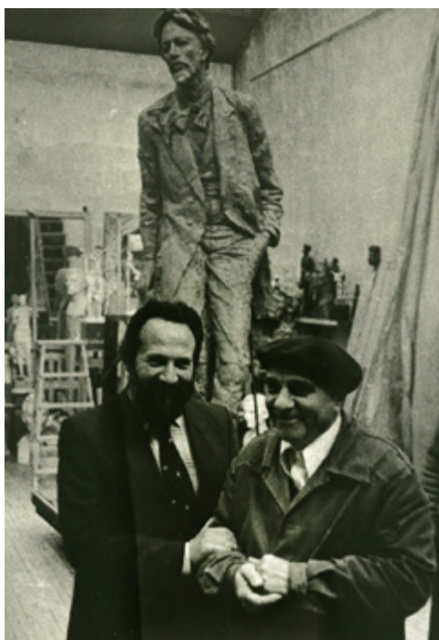
Ил. 3. В мастерской Михаила Константиновича Аникушина у модели памятника А.П. Чехову для Москвы. 1990. Ленинград.

Фундаментальный труд целой жизни, изданный в двух томах, содержит множество острых идей и догадок, разбросанных по тексту, словно драгоценные камни. А.А. Золотов старается быть максимально объективным, отбрасывая всякую тенденциозность.