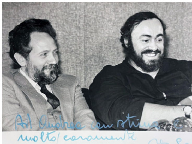
Ил. 18. Лучано Паваротти прилетел в Москву. Пресс-конференция в аэропорту Шереметьево. 1990. Москва.

Золотовым была создана книга-альбом «Знаки жизни. Неизвестный Свиридов» (М., Центр книги Рудомино, 2014).