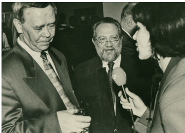
Ил. 9. С Валентином Григорьевичем Распутиным. Москва. 2000.

Автор поделил свою весьма объемную рукопись на пять частей, в каждой из которых представлена группа статей и материалов, объединенных общим смыслом. Каждой из частей рукописи предпослан свой эпиграф, передающий настроение автора и, словно звук камертона, настраивающий на чтение последующих статей.