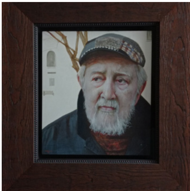
Ил. 15. Т.В. Чувашева. А.А. Золотов в Бунинском сквере. 2021. Дерево, левкас, темпера. Частная коллекция. Москва.