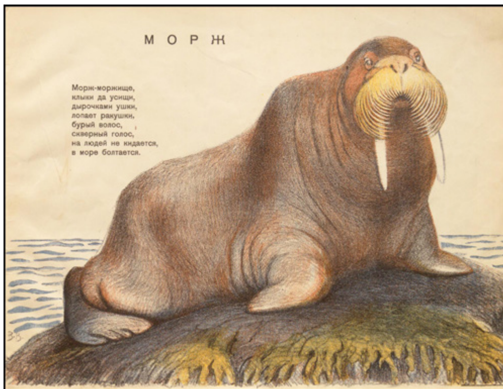
Ил. 7. В. А. Ватагин. Иллюстрация к книге С. З. Федорченко «Зоологический сад. Звери диковинные». 1927. Цв. литография.

капризными, прожорливыми, неаккуратными. Только возвращение мамы спасает квартиру от полного разгрома и затопления. Черно-белые иллюстрации ненавязчиво подчеркивают основной посыл текста: насколько органично смотрятся африканские животные в клетках, настолько же несуразно выглядят они в гостях у мальчика.