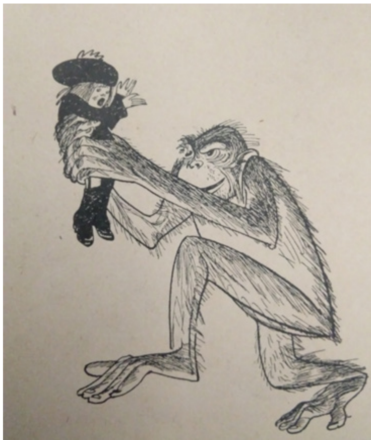
Ил. 1. Ре-Ми (Н.В. Ремизов). Иллюстрация к поэме К.И. Чуковского «Крокодил». 1919. Б., тушь, перо, кисть.

Как известно, жизнь животных всегда была и остается одной из главных, любимых тем детской литературы; не представляет исключения в этом отношении и период 1920-х гг., отмеченный расцветом отечественного книжно-оформительского искусства. В данной статье речь пойдет лишь об одном сравнительно небольшом, но очень интересном сегменте детской анималистической литературы — о книгах, действие которых разворачивается в зверинце, зоосаде, зоопарке (конечно, между этими понятиями есть существенная разница, но в данном случае можно перечислить их в одном ряду). Рассматриваться будут преимущественно «книжки-картинки», то есть издания, адресованные читателям дошкольного или младшего школьного возраста, в которых зрительный ряд занимает не меньше места, чем текст, и играет основную роль. Чаще всего в них описывается экскурсия детей по зоосаду, фиксируются самые яркие впечатления ребенка от встреч с представителями фауны.