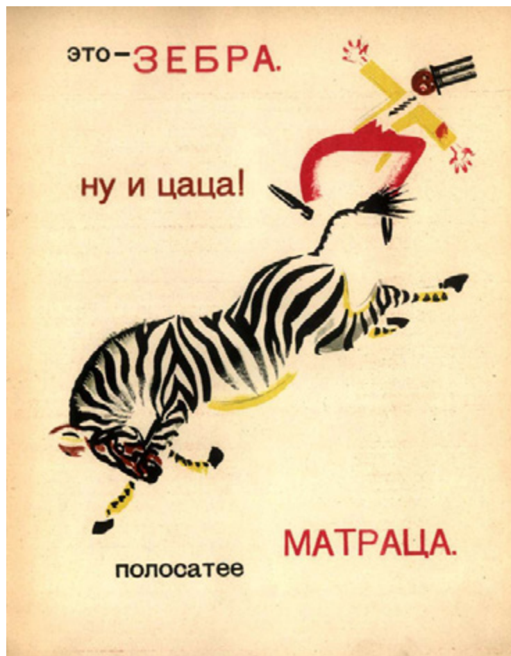
Ил. 2. К. М. Зданевич. Иллюстрация к книге В. В. Маяковского «Что ни страница — то слон, то львица». 1928. Цв. литография.

условиях, в каком-то смысле позволял маленькому читателю познакомиться не только с отдельными особями и видами, но и с царством животных в целом.