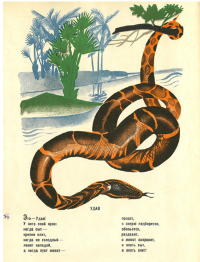
Ил. 4. Ю. И. Пименов. Иллюстрация к книге С. З. Федорченко «Зоосад у воды». 1928. Б., акв., тушь.

поверить услышанному; зубр и тигр преисполнены жаждой мщения. На следующей странице нестройное, разношерстное звериное войско уже отправляется на штурм Петрограда, чтобы спасти несчастных братьев, выволить их из плена.