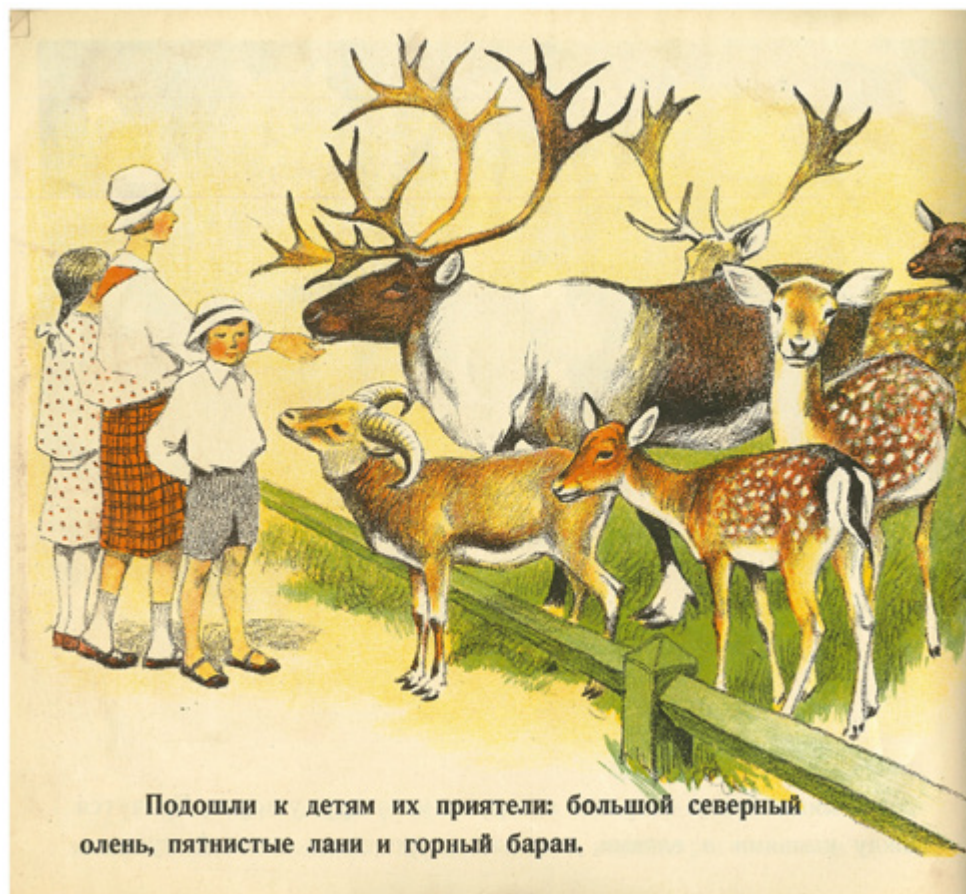
Ил. 8. А. Н. Комаров. Иллюстрация к книге «Звери на свободе в московском зоопарке». 1927. Цв. литография.

беглые карандашные наброски с натуры, очень точно фиксирующие не только внешний облик, но и характеры портретируемых.