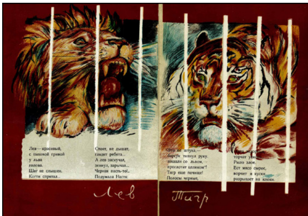
Ил. 6. Л. А. Бруни. Разворот из книги С. В. Шервинского «Зоологический сад». 1927. Цв. литография.

зверей, чтобы продавать за границу их ценные меховые шкурки, мы должны знать, как же живут эти зверьки. Иначе не сможем разводить их в неволе, а значит и не получим дорогого меха. Меха наше государство вывозит за границу в обмен на тракторы, сеялки и другие машины» [Кастальская 1930, с. 4]. Разумеется, в этой системе координат нет места никакой любви к животным.