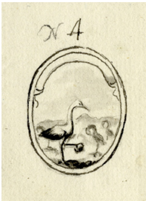
Ил. 3. Эмблема № 4 «Журавль, держащий камень» Яузских триумфальных ворот 1743 года в Москве по случаю заключения Абоского мирного договора со Швецией. 1742–1743(?). Бумага; тушь(?).

противники России. Например, лисица олицетворяла хитрого врага, павлин — гордого, а осел и заяц — трусливого 3 . Содержание таких композиций близко басням, где героями выступают животные.