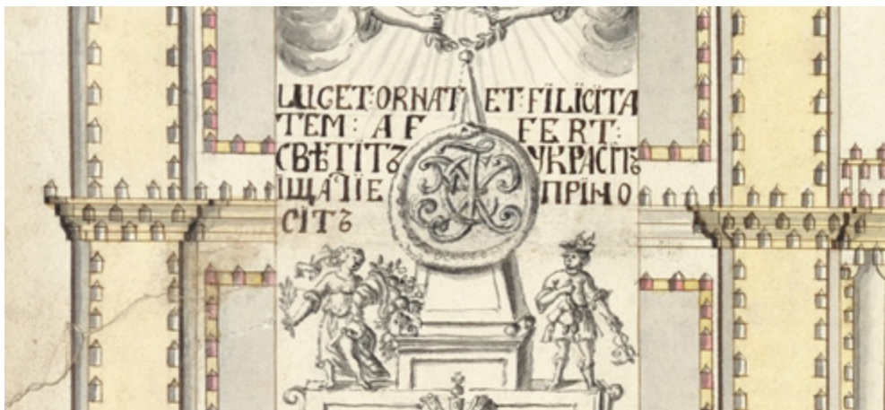
Ил. 4. Иллюминация «Нового Зимнего дворца» (дома Ф.М. Апраксина?) в Санкт-Петербурге по случаю свадьбы голштинского герцога Карла Фридриха и цесаревны Анны Петровны в 1725 году. Ок. 1726. Бумага; графитный карандаш, тушь, акварель. Фрагмент: вензель с образом змеи, держащей в пасти собственный хвост.

На триумфальных вратах «от школьных учителей» 1709 года по случаю Полтавской победы встречалось изображение впряженных в одно ярмо льва, буйвола и змея, обозначавшее шведскую коалицию с польским королем Станиславом Лещинским и гетманом Мазепой 6 .