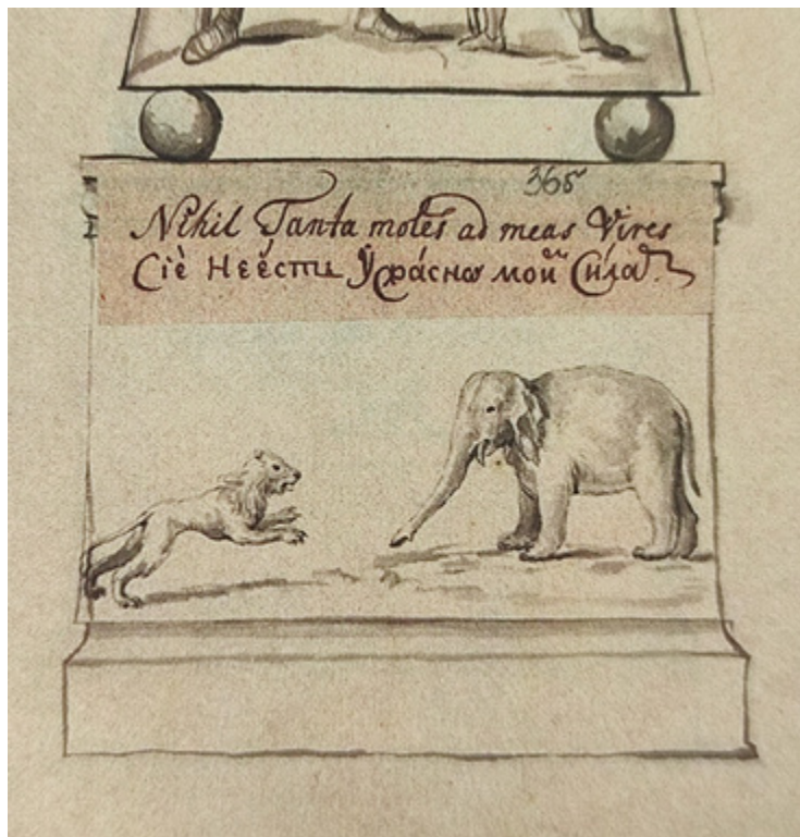
Ил. 2. Проект фейерверка и иллюминации к коронации Петра II. 1727–1728(?). Бумага; тушь(?). Фрагмент: эмблема «Молодой лев, бросающийся на слона».

В первой половине XVIII века праздничное убранство получали преимущественно столичные города — Москва и Санкт-Петербург. С восшествием на престол Екатерины II географические границы «искусства к случаю» значительно расширяются и начинают охватывать целый ряд провинциальных городов, что во многом было связано с маршрутом путешествий императрицы [Махотина, т. 1, с. 139–169]. В царствование Петра I торжества в честь Российского государства активно устраивали и за границей, где особым размахом отличалось празднование Ништадтского мира осенью 1721 — зимой 1722 года [Шебалдина; Тюхменева 2022, с. 139–144]. В ту эпоху основным поводом к созданию триумфальных комплексов служили военные успехи России. С 1724 года — коронации супруги Петра I Екатерины Алексеевны — начали публично отмечать коронационные торжества. Обе традиции сохранялись и в дальнейшем. В постпетровское время провинциальные города также нередко декорировали к посещению их монаршими особами. Огненные «потехи» организовывали по случаю событий, определяющих жизнь правителя и его семьи (коронаций, дней рождения, тезоименитств, обручений и свадеб), наступления Нового года, орденских и других общероссийских праздников.