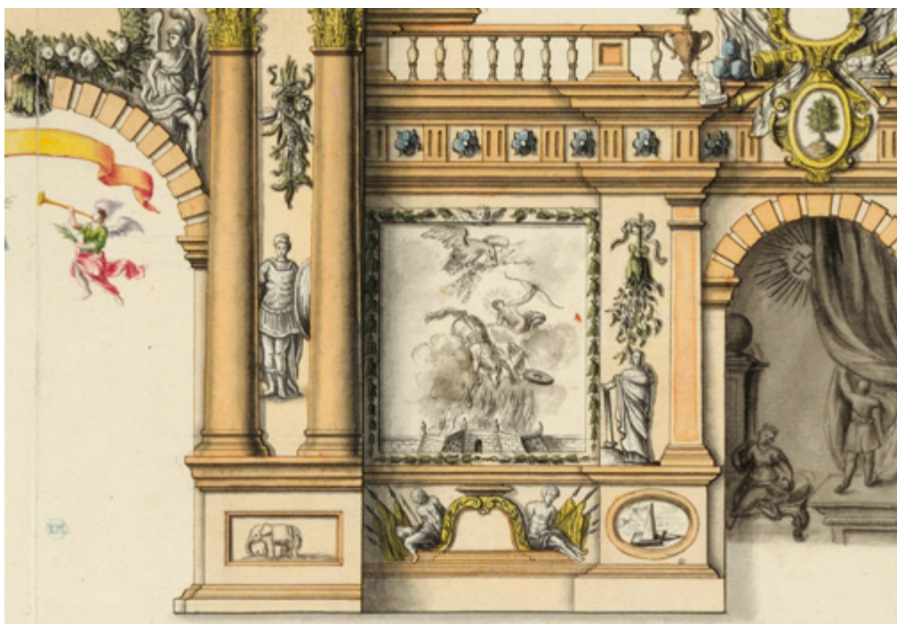
Ил. 1. Строгановские триумфальные ворота в Москве по случаю Полтавской победы. Первая половина XVIII в. Бумага; тушь, акварель. Фрагмент: композиция «Падение Фаэтона».