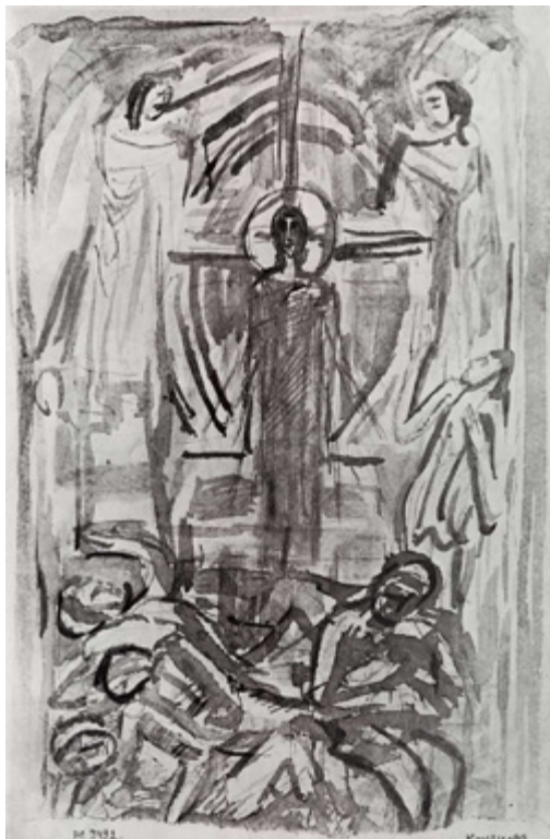
Ил. 7. П. И. Бромирский. Воскресение Христова. 2-я пол. 1910-х. Бумага, тушь, кисть, перо. 31 × 21,5. ГРМ, Санкт-Петербург.