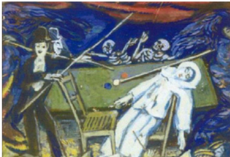
Ил. 4. П. И. Бромирский. Бильярд. 1908. Бумага, гуашь. 17,5 × 25. Собрание Е. М. Кругловой, Москва.

решения представления: «Вся сцена по бокам и сзади завешена синего цвета холстами; это синее пространство служит фоном и оттеняет цвета декораций маленького „театрика“» [Мейерхольд 2015, с. 70]. Художник явно желал продолжить сотрудничество с режиссером и в следующем, 1907 году спрашивал Мейерхольда: «Когда думаете ставить „Незнакомку“?» 2