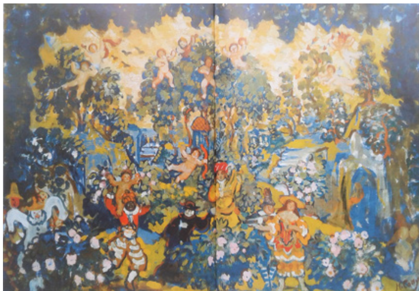
Ил. 6. Н.Н. Сапунов. Весна. 1912. Х., м. ГРМ, Санкт-Петербург.

посвятил рисунок, на котором были изображены амурь. Рисунок был отвергнут издателями памятной книги: они сочли его безнравственным и малоподходящим для мемориального издания [Романович 2, 2011, с. 81]. Здесь правомерно задать вопрос: а какое именно содержание вкладывал Ларионов в свое произведение, посвященное памяти Сапунова?