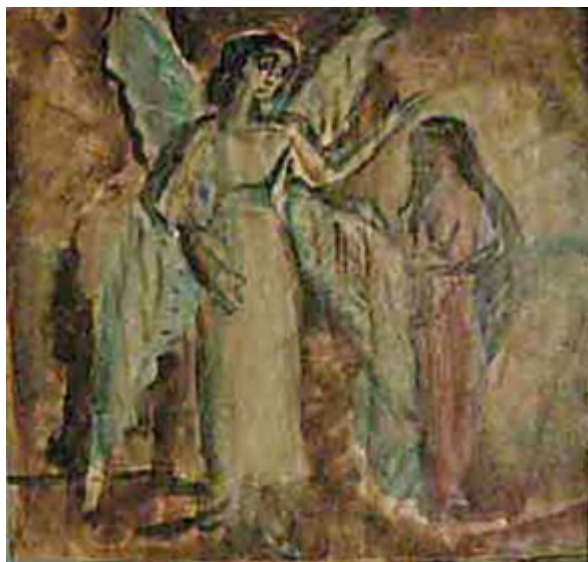
Ил. 10. П. И. Бромирский. Благовещение. Конец 1910-х. Бумага линованная, акварель. 22 × 23. Собрание Е. М. Кругловой, Москва.

сохранил также рисунки — наброски, в которых Бромирский пытался проработать и зафиксировать на бумаге отдельные детали и варианты своего замысла (ил. 9).