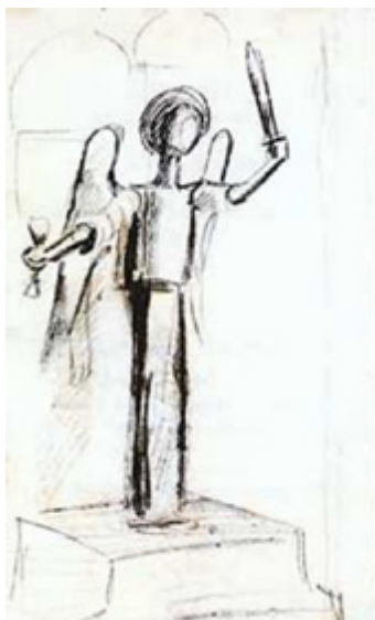
Ил. 9. П. И. Бромирский. Ангел с мечом. Проект памятника В. И. Сурикову. 1918–1919. Бумага, графитный карандаш, 22,8 × 13,8. Музей-заповедник Абрамцево.