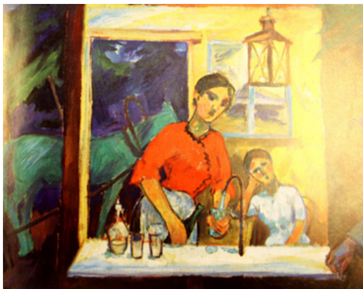
Ил. 3. М. Ф. Ларионов. Продавщица газированной воды. 1905–1907. Х., м. Местонахождение неизвестно.

должное. Явно под воздействием живописи Ларионова он изобразил вывески в своем произведении.