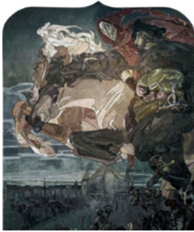
Ил. 10. М. А. Врубель. Полет Фауста и Мефистофиля. 1896. Панно для готического кабинета в особняке А. В. Морозова. Холст, масло. 290×240. Государственная Третьяковская галерея, Москва.