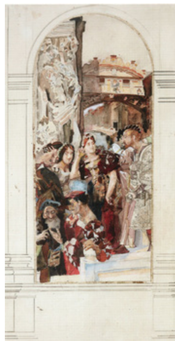
Ил. 9. М. А. Врубель. Венеция. 1893. Эскиз панно. Бумага, акварель, белила, графитный карандаш. 36,4×19,3. Государственная Третьяковская галерея, Москва.

Палья и перекинутого через узкий канал на высоте и в некотором отдалении «Мост вздохов» [Врубель 1976, с. 206] 12 . Однако в изображении здесь отразились не только оптические особенности фотографии и театральный эффект, но и сложность присущей художнику визуальной манеры, в которой при акцентах на дробную энергию крупных фрагментов, раскрывающих содержательные мотивы, архитектурные «пассажи» несут функцию сугубо иллюстративную, остаются менее всего, если можно так выразиться, по-врубелевски специфичными и представляют собой своего рода пространственные паузы. Подтверждением такого наблюдения, опирающимся на схожую задачу контраста динамичной кристаллизации, служит участок живописной поверхности с ночным готическим городом, над которым происходит собственно «полет Фауста и Мефистофеля» в одноименном панно (1896, ГТГ; ил. 10) для особняка А.В. Морозова во Введенском (сегодня — Подсосенский) переулке.