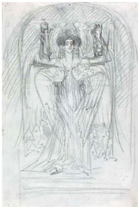
Ил. 8. М. А. Врубель. Ангел с мечом и кадилом. 1903–1904. Набросок первоначальной композиции картины «Шестикрылый серафим». Бумага, графитный карандаш. 24,7×16,5. Государственная Третьяковская галерея, Москва.