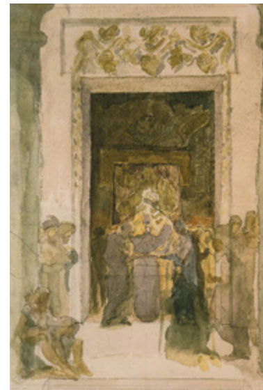
Ил. 7. М. А. Врубель. Обручение Святой Девы Марии и Иосифом. 1881. Бумага на картоне, акварель, тушь, сепия, перо, графитный карандаш. 69,7×61,7. Государственный Русский музей, Санкт-Петербург.

академического обучения. Яремич определяет манеру исполнения «Обручения Святой Девы Марии с Иосифом» 11 (1881; 69,7×61,7; ГРМ, ил. 6) как «в стиле древней росписи на вазах» [Яремич 1911, с. 24], Нестеров — «в стиле мастеров Возрождения» [Врубель 1976, с. 224], исследователь И. В. Шуманова — блестящим парафразом «Библейских эскизов» А. А. Иванова и откликом на искусство Рафаэля [Врубель, 2021, с. 97]. Действие канонического сюжета Врубель переносит на ступени античного храма, исполненного с тщательностью квадратуриста. Виртуозное использование сепии и акварели придает композиции сложность светотеневой аранжировки почти монохромной гаммы и, прежде всего, в лестничном пространстве паперти и в затененном интерьере. Столь же утончена градация подсветки в маленьком эскизе на тот же сюжет («Обручение Святой Девы Марии с Иосифом», 1881; 23,3×15,7; ГРМ, ил. 7), где над высоким порталом появляется растительный орнамент, который тактично убран в первом упоминаемом эскизе и в котором расширено пространство для присутствующего на торжестве множества персонажей в одеяниях, решенных чисто графически, без цвета.