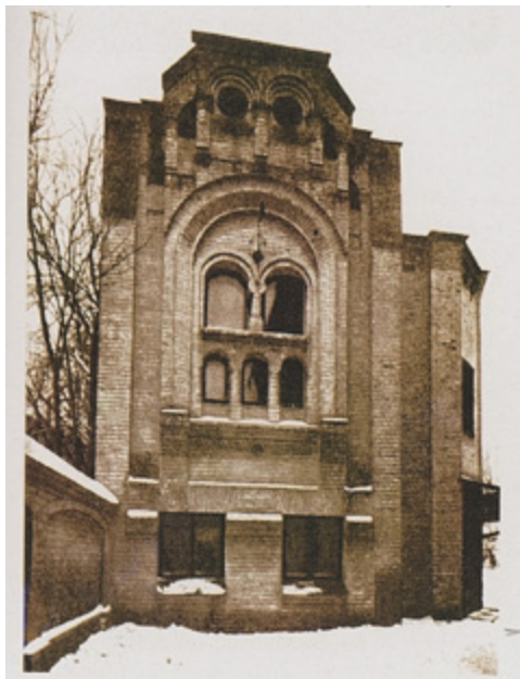
Ил. 1. Флигель городской усадьбы С. И. Мамонтова (1891, проект М. А. Врубеля). Фотография. 1910-е. Сохранился до наших дней.