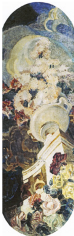
Ил. 5. М. А. Врубель. Хризантемы. Центральный плафон триптиха «Цветы». 1894. Холст, масло. 300×163. Омский областной музей изобразительных искусств им. М. А. Врубеля.