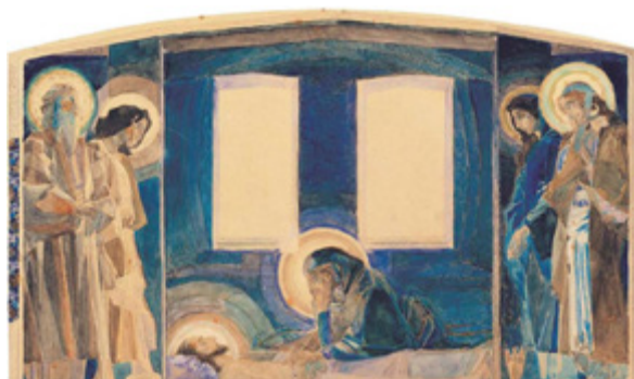
Ил. 4. М. А. Врубель. Надгробный плач. 1887. Бумага, акварель, графитный карандаш. 18×29,8. Национальный музей «Киевская картинная галерея», Украина.

арсенала с зубцами кремлевских стен! <...> Тот, кому было дано осмыслить физиономию огромного города, и кто мог бы породить целую архитектурную школу, был обречен увидеть осуществление своей архитектурной мысли лишь в виде маленького флигелька на Спасской Садовой и то в упрощенной и далеко несогласной с первоначальным планом форме» [Яремич 1911, с. 138, 141].