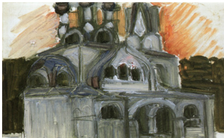
Ил. 2. М. А. Врубель. Проект церкви для села Талашкина. 1899. Дерево, масло, графит. 18×27. Государственный Русский музей, Санкт-Петербург.