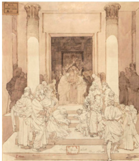
Ил. 6. М. А. Врубель. Обручение Святой Девы Марии и Иосифом. 1881. Бумага на картоне, акварель, тушь, сепия, перо, графитный карандаш. 69,7×61,7. Государственный Русский музей, Санкт-Петербург.