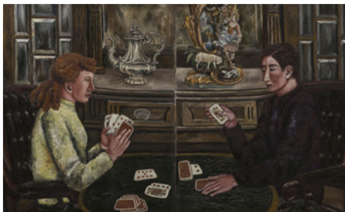
Ил. 3. Н.Н. Нестерова. Игра. Диптих. 1982. Собрание ГМВЦ «РОСИЗО».