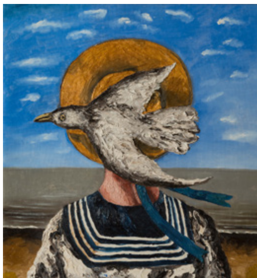
Ил. 4. Н.Н. Нестерова. Маленькие облака. 2001. 76×65. Собрание В.И. Некрасова.