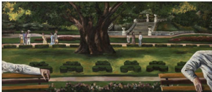
Ил. 5. Н. Н. Нестерова. В парке (Замок Hluboka). 1985. 90×200. Собрание ГМВЦ «РОСИЗО».